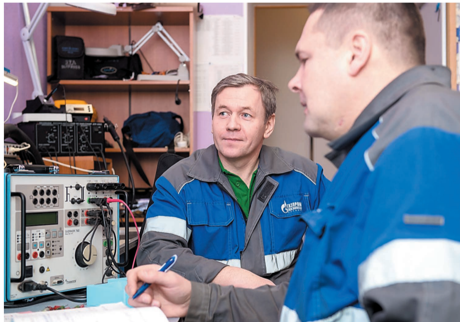
В электротехнической лаборатории завершается подготовка к очередной периодической регистрации в органах Ростехнадзора