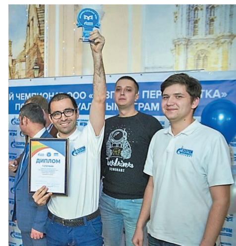
Команда компании — победитель двух отборочных туров чемпионата