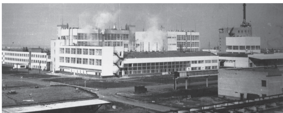
Середина 1980-х. Завод нефтехимических производств