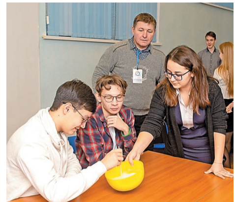
Многие из учеников отметили, что знания, полученные на форуме, понадобятся им в дальнейшей учебе