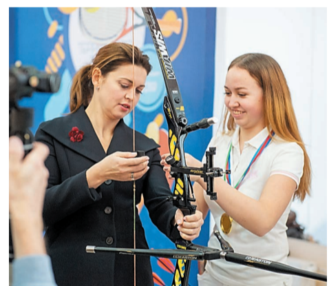
Любители стрельбы из лука с удовольствием рассказали о своих спортивных снарядах