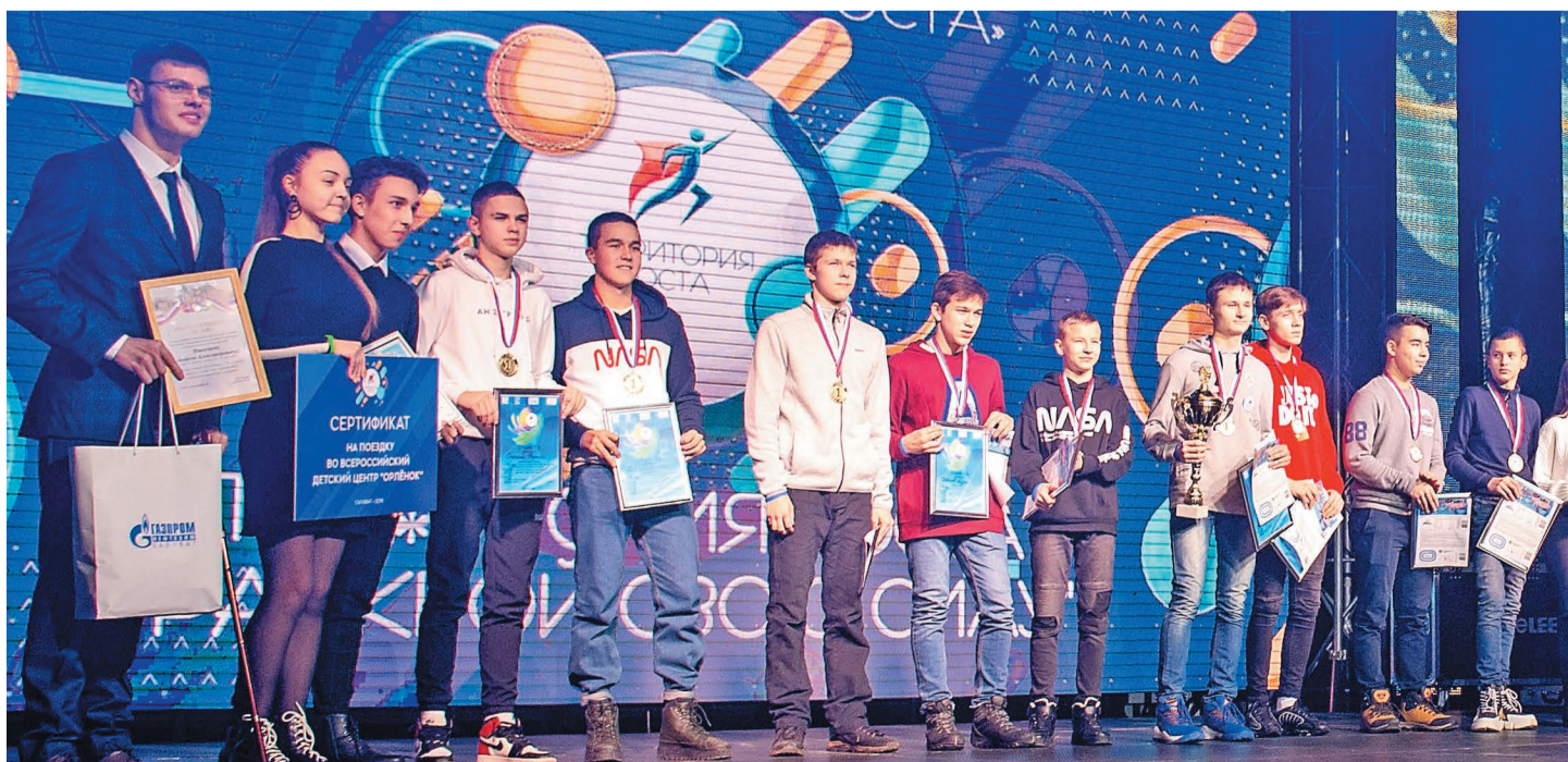
На сцене СКК «Салават» победители каждой из пяти образовательных платформ получили дипломы и заслуженные награды

– Форум «Территория роста» стал грандиозным событием для города, и мы решили показать его яркие моменты в нашем видеоклипе. Специально для форума «Территория роста» подготовили песню, и вожатский отряд детского центра «Спутник» исполнил ее на торжественном открытии и закрытии форума. Выступление вожатых стало настолько ярким, а текст песни настолько искренним и вдохновляющим, что на официальном закрытии эту песню наизусть знал каждый участник. Когда звучал припев этой песни, все дети на трибунах вставали, включали фонарики на телефонах и громко пели. Это масштабное зрелище найдет отражение в нашем видеоклипе, который скоро можно будет увидеть в социальных сетях «Газпром нефтехим Салават».