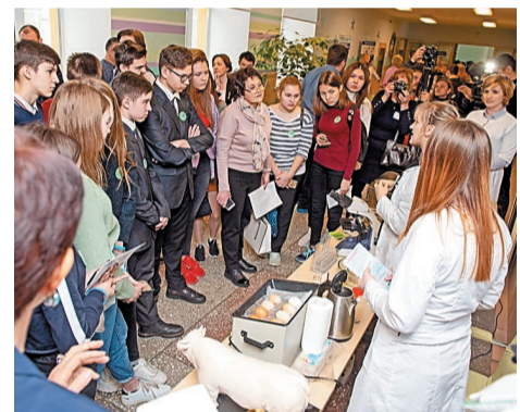
В Лицее № 1 ребята с удовольствием приняли участие в исследованиях