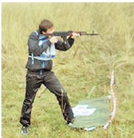
Некоторые участники с большим трудом но преодолели гоночные дистанции, никто не сошел с трассы

После жеребьевки первыми стартовали спортсмены-любители ООО «Акрил Салават», за ними с интервалом в пять минут другие команды. На финише лучший результат показал коллектив «ПАТиМ-1», почти четыре минуты ему проиграла вторая команда «ПАТиМ-2». Третьей фини-