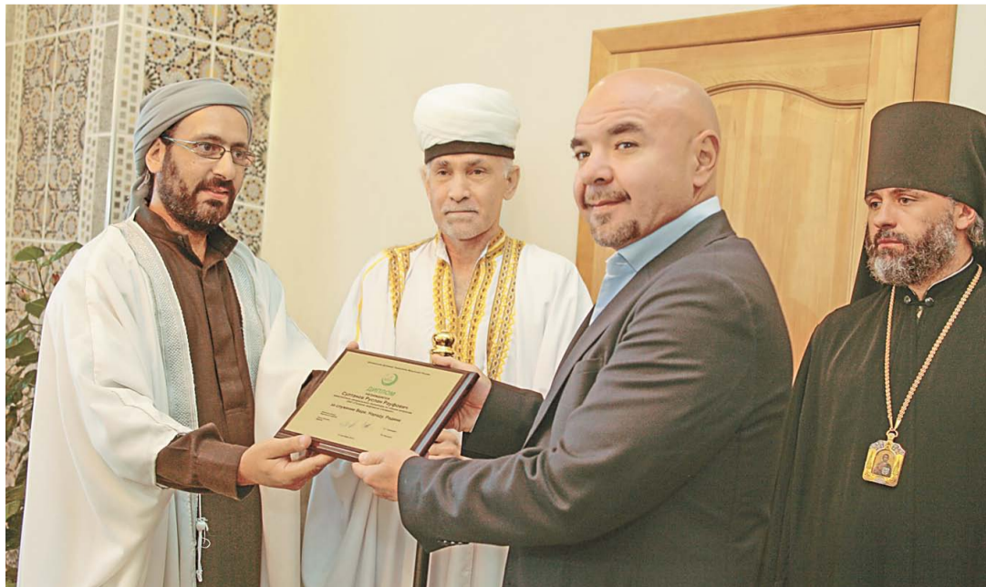
Зал для прочтения никаха – единственный специализированный в республике