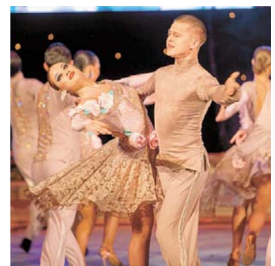
Еще несколько часов назад «Весна» и «Улыбка» выступали на московской сцене