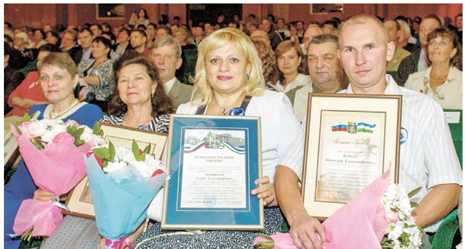
В честь профессионального праздника наградами отмечены около 200 сотрудников компании