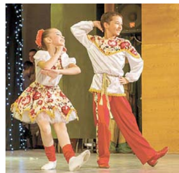
«Родничок» с задором исполнил постановку «Семечки калины»