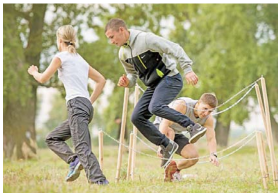
При преодолении препятствий требовалась особая ловкость