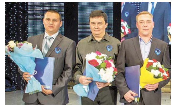
Всех награжденных коллеги встречали бурными аплодисментами