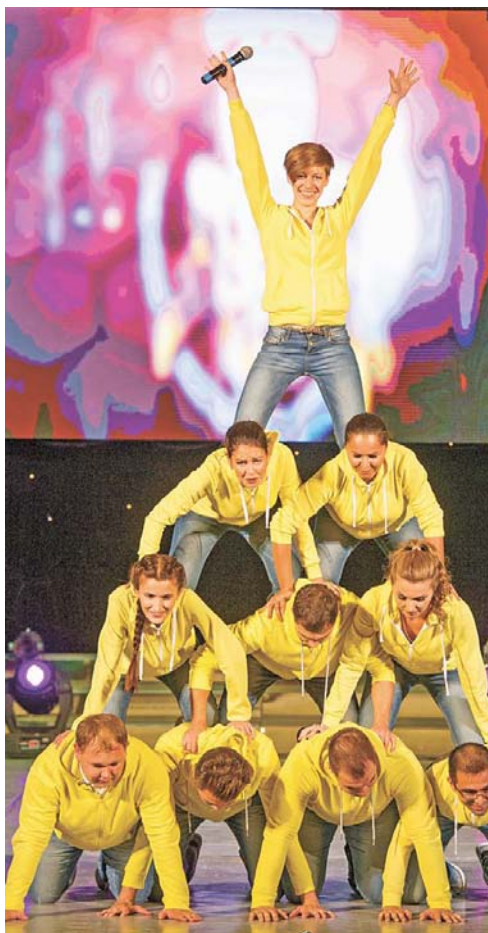
«Отчаянные пчелы» с удовольствием представили свой номер, подготовленный к II Фестивалю рабочей молодежи «Газпром переработка»