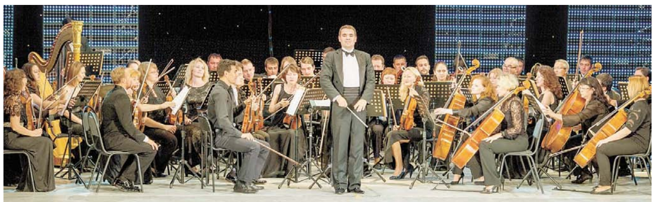
После концерта салаватцы долго не отпускали музыкантов симфонического оркестра РБ