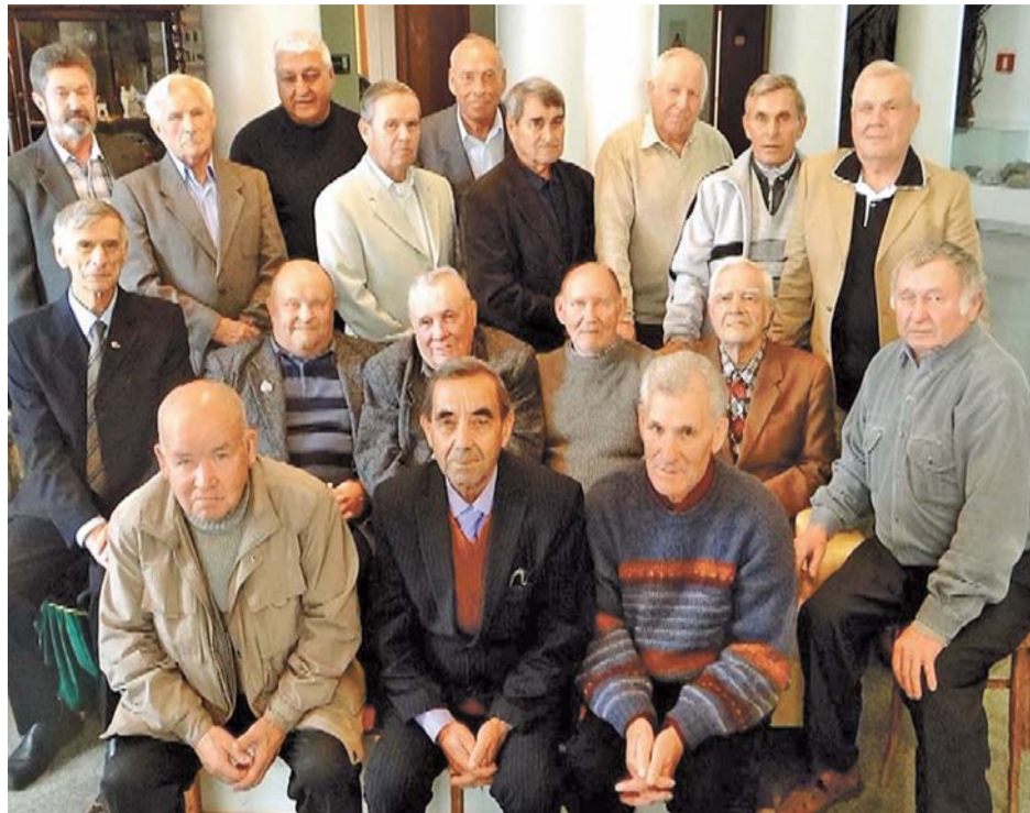
Встреча заводчан в 2014 году

Цех № 38 был основан на базе бывшего цеха экстрагентов; чтобы пустить его, нам сначала пришлось демонтировать старое оборудование и трубопроводы. Параллельно в цехе работали представители монтажных и строительных организаций. Помню, из проектного института