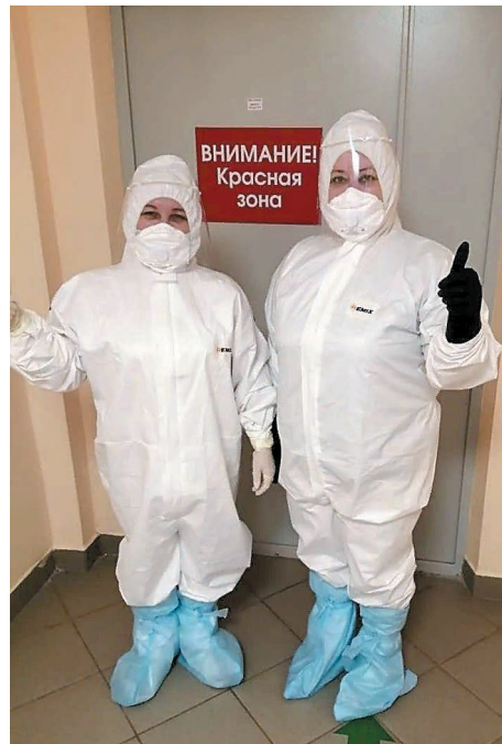
Медицинские работники города Салавата с удовольствием используют визоры в своей работе

– Первый мой принтер мне подарила супруга четыре года назад. В то время им пользоваться было сложно – это был