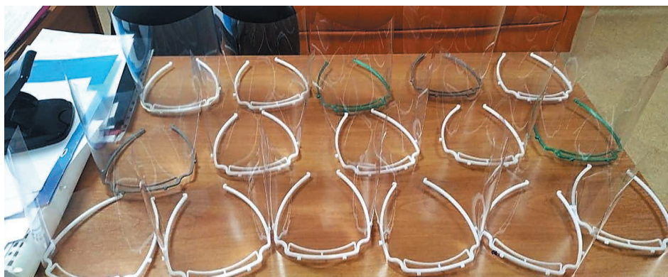
Так выглядят защитные экраны после печати на 3D-принтере