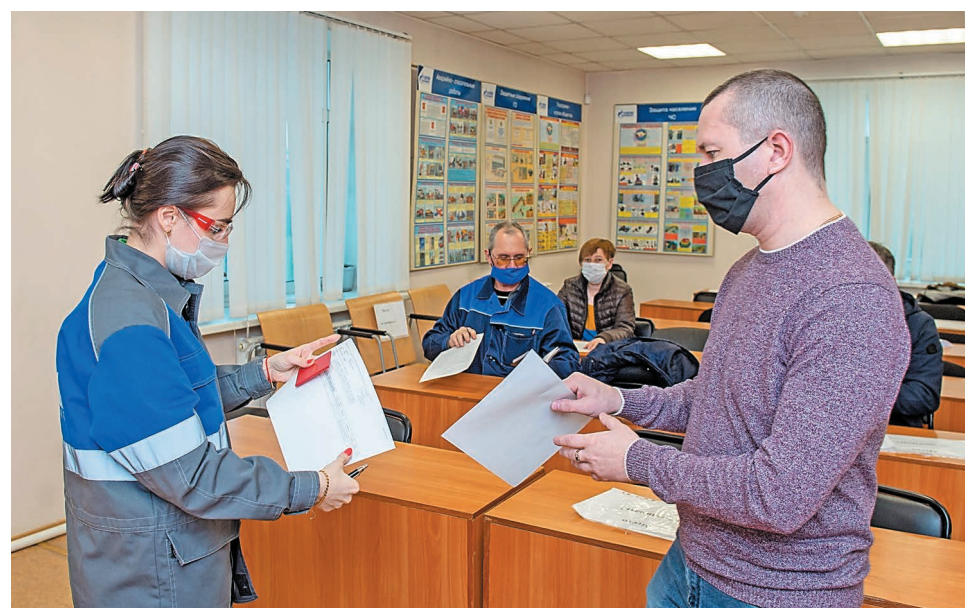
Вводный инструктаж проводится с применением необходимых средств защиты

алист совместно со специалистами других отделов проводит вводный инструктаж вновь принимаемым работникам Общества и подрядных организаций для ознакомления с вопросами охраны труда. На территорию Общества заходит большое количество подрядных организаций, и специалист должен проверить у каждого