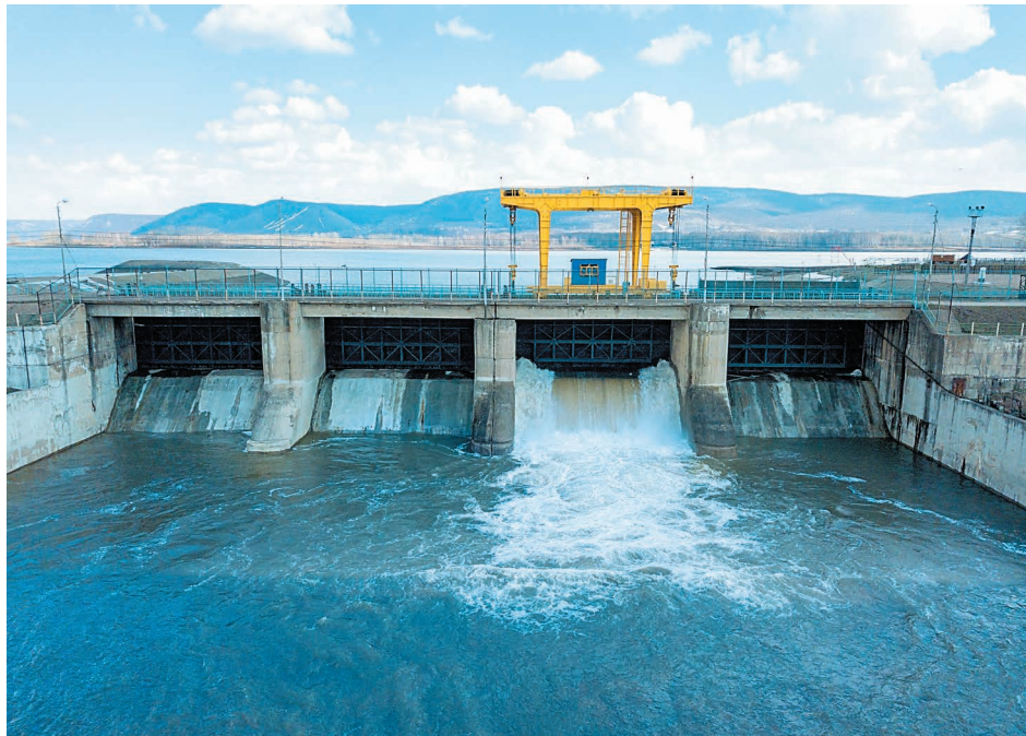
Гидроузел – это целый комплекс гидротехнических сооружений, включает в себя плотину, береговой водосброс и электростанцию

Заблаговременно был издан приказ «О подготовке к паводковому периоду