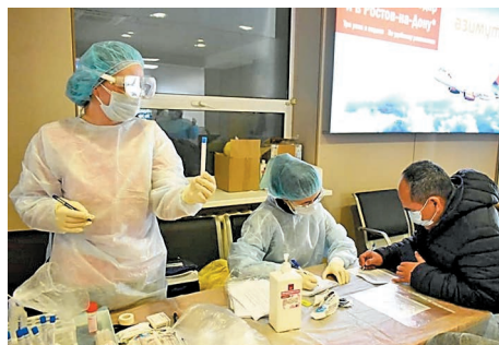
В международном аэропорту «Уфа»

– Согласно п. 7 Указа Главы РБ № УГ-111 в отношении граждан, прибывших из иностранных государств, в том числе прибывших в международный аэропорт «Уфа» им. Мустая Карима, на железнодорожный вокзал города Уфы и города Янаула, решение об их изоляции и медицинском наблюдении в домашних условиях, в условиях обсерватора, инфекционного стационара, медицинского учреждения, функционирующего в режиме инфекционного стационара, на срок 14 календарных дней со дня их прибытия принимается оперативным штабом по недопущению завоза и распространения новой коронавирусной инфекции на территории Республики Башкортостан.