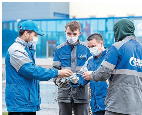
Всем участникам субботника были выданы защитные маски, перчатки и антисептики

– Стало реально чисто и красиво. Надеюсь, что в скором времени, когда закончится режим самоизоляции, по улицам вновь будет гулять много горожан с детьми. И я обязательно тоже сюда приду и приведу своих близких показать свою работу.