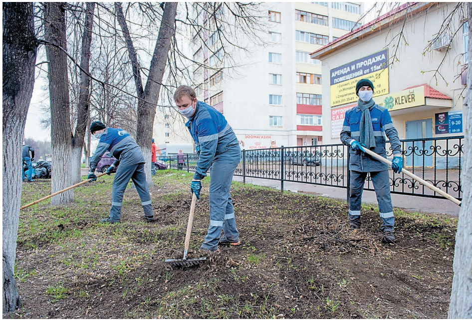
При помощи граблей, лопат и веников нефтехимики навели порядок в городе

– Как видите, у нас все работают строго в защитных масках и перчатках. Каждому,