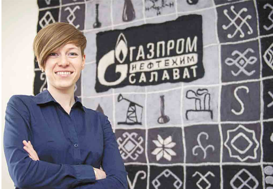
Сейчас войлочное панно с логотипом компании украшает рабочий кабинет в Управлении Общества

Для работы специалисты выбрали шерсть нейтрального цвета: черного, бе-