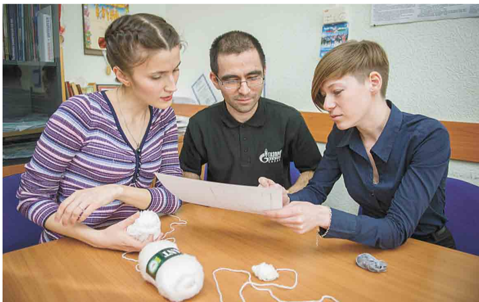
Чтобы реализовать свою идею, молодым людям потребовалось три недели