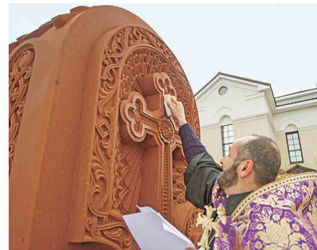
Священный хачкар возведен как дань памяти к 100-летию геноцида армян

Хачкар – вид армянских архитектурных памятников, представляющий собой каменную стелу с резным изображением креста. В ноябре 2010 года искусство создания хачкаров с формулировкой «символика и мастерство хачкаров, армянские каменные кресты» было внесено в репрезентативный список ЮНЕСКО по нематериально-