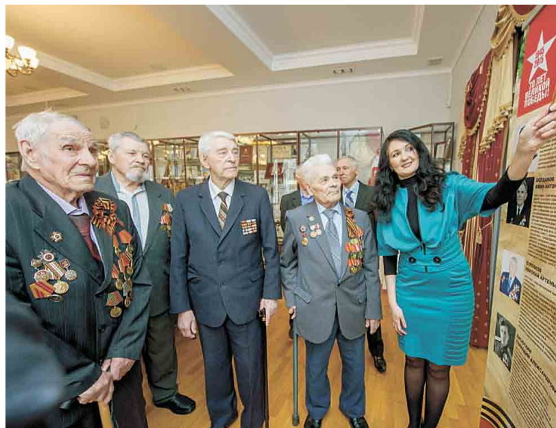
Встреча с ветеранами продолжает череду праздничных мероприятий, запланированных в компании в честь 70-летия Великой Победы