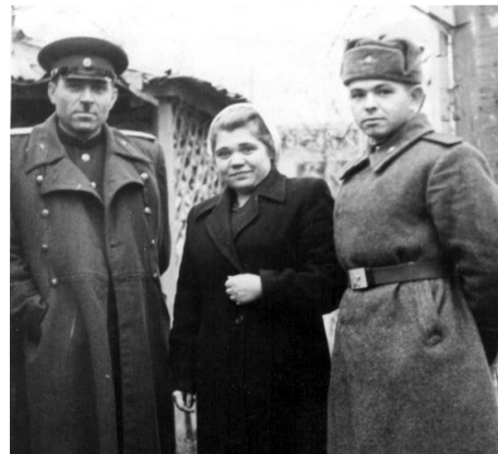
В московском госпитале