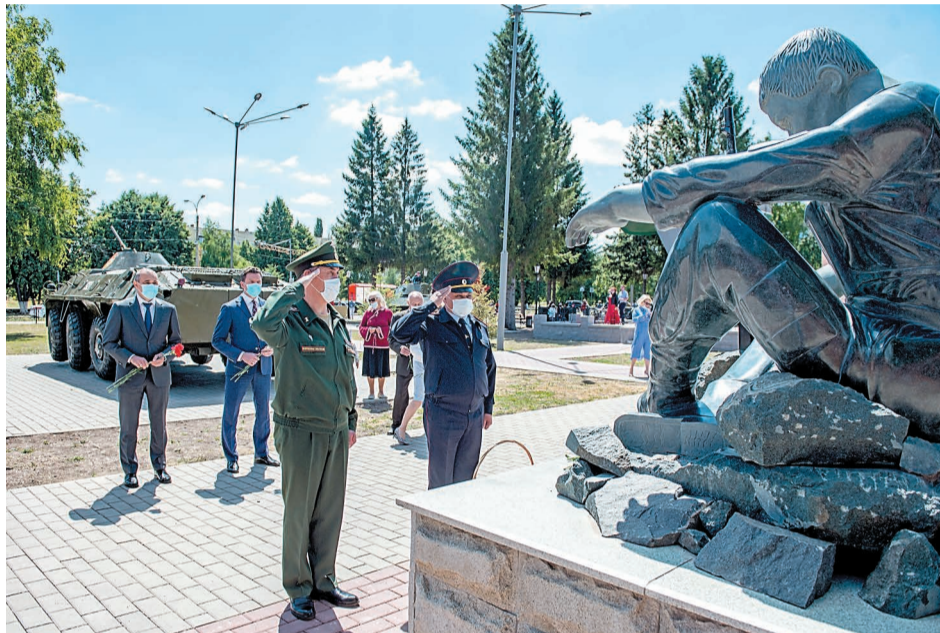
Участники церемонии также почтили память павших воинов-интернационалистов и участников локальных конфликтов

В этом году к 75-летию Великой Победы компания «Газпром нефтехим Салават»