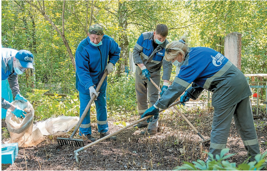
Проведение экологических акций – хорошая традиция нефтехимиков

Участники мероприятия отнеслись к своей задаче с воодушевлением, каждый добросовестно выполнял свою работу. Несмотря на то, что территория была распределена между подразделениями, работали сообща, не деля обязанности на «свои» и «чужие», помогали друг другу. По собственной инициативе работники компании очистили мусорные баки, которые были заполнены после недавно прошедших родительских дней. Также были расчищены не