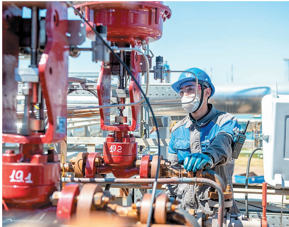
В цехе № 34 смонтирован новый клапан КИП для регулирования расхода водорода

В цехе № 48 завершена реализация проекта «Учет материальных потоков «PI-SYSTEM»», что даст возможность организовать более точный учет и использовать в дальнейшем данные для составления суточного баланса по установкам цеха в автоматическом режиме. В цехе № 34 выполнены работы по монтажу технологических трубопроводов и их переподключение на новой внутрицеховой эстакаде. Прежняя эстакада, имеющая высокий физический износ, в последующем будет демонтирована. Проведена перегрузка катализатора гидрирования в реакторе Р-401 IV в цехе № 52.