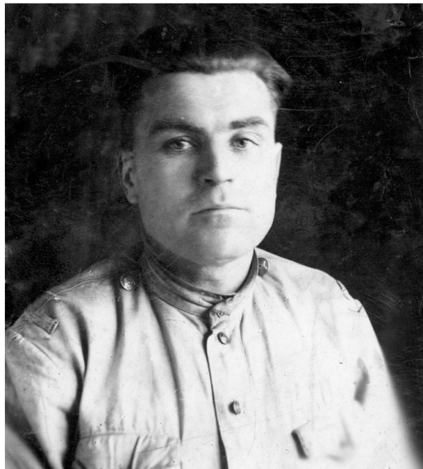
1944 год, Одесса. После успешной боевой операции

Дорогие читатели! У каждого треугольника, полученного по военно-полевой почте, своя история, счастливая или печальная. Если у вас сохранились письма с фронта, можете присылать их вместе с фотографиями и рассказом об авторах на адрес 021aa@sno.su , и мы обязательно их опубликуем. Телефон для справок (3476) 39-24-44.