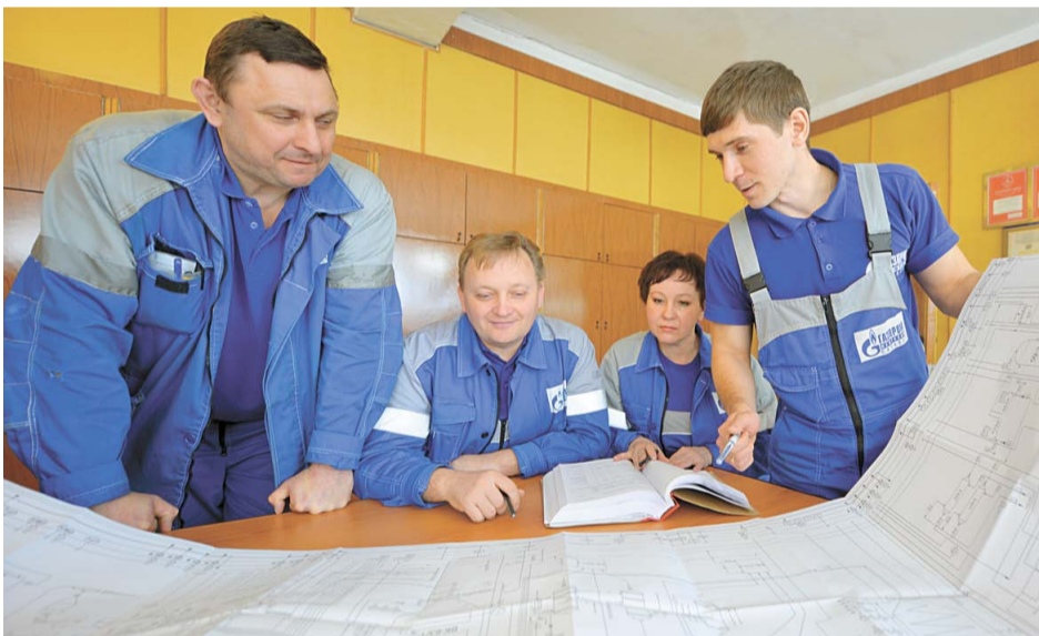
Многие специалисты завода не первый раз участвовали в разработке новых марок полистирола

С первого марта на заводе «Мономер» приступили к выпуску нового полистирола ПСМ-Э. Эта марка полистирола используется для изготовления теплоизоляционных материалов, которые, в свою очередь, служат для утепления жилых домов, сооружений, кровли. До последнего времени отечественные производители теплоизоляции приобретали импортное сырье, в настоящий момент перешли на продукцию российских нефтехимических компаний. В частности, используют салаватский полистирол, выпускаемый в цехе № 47.