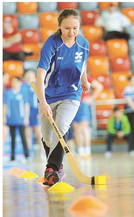
За победу в фестивале развернулась принципиальная борьба

В минувшую субботу во Дворце спорта «Нефтехимик» прошел фестиваль рабочего спорта, который собрал 16 команд из разных подразделений ОАО «Газпром нефтехим Салават». Все участники – 150 мужчин и женщин – выступили в четырех видах спортивной программы.