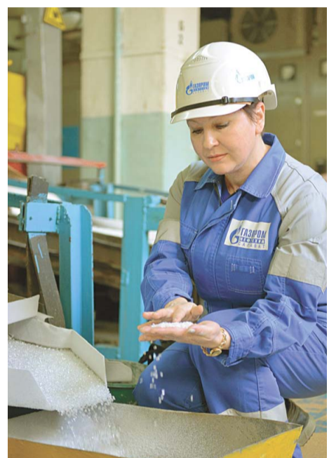
Опытный персонал цеха даже по внешнему виду гранул может судить о качестве готовой продукции

– В цехе № 47 налажено производство специальной марки полистирола ПСМ-Э, который отправляется российским потребителям – производителям теплоизоляции. Общая мощность двух технологических ниток установки ударопрочного полистирола, задействованных в выпуске новой продукции, составляет 70 тонн в сутки. Наши гранулы производители используют для изготовления теплоизоляционных плит методом экструзии (XPS). Экструдированный полистирол XPS характеризуется очень хорошими термоизолирующими свойствами, устойчивостью к проникновению влаги и высокой прочностью. Эксперты считают, что применение полистирола в качестве теплоизоляционного материала позволит к 2020 году решить на 40% задачу по повышению энергоэффективности в масштабах всей страны.