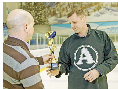
«Альянс» получил награду за волю к победе