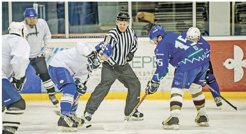
Чемпионат отчетливо показал, что работникам компании понравился любительский хоккей

На заключительной игре чемпионата команда «Управление» (Управление Общества) встретилась с командой «Торнадо» (Управление информационных технологий и связи). «Торнадо» не смогла противостоять натиску сильнейшего соперника, матч завершился со счетом 4:0. Спортсмены-любители «Управления» стали безоговорочными победителями корпоративной хоккейной лиги. На второе место вышла команда «Мономер» (завод «Мо-