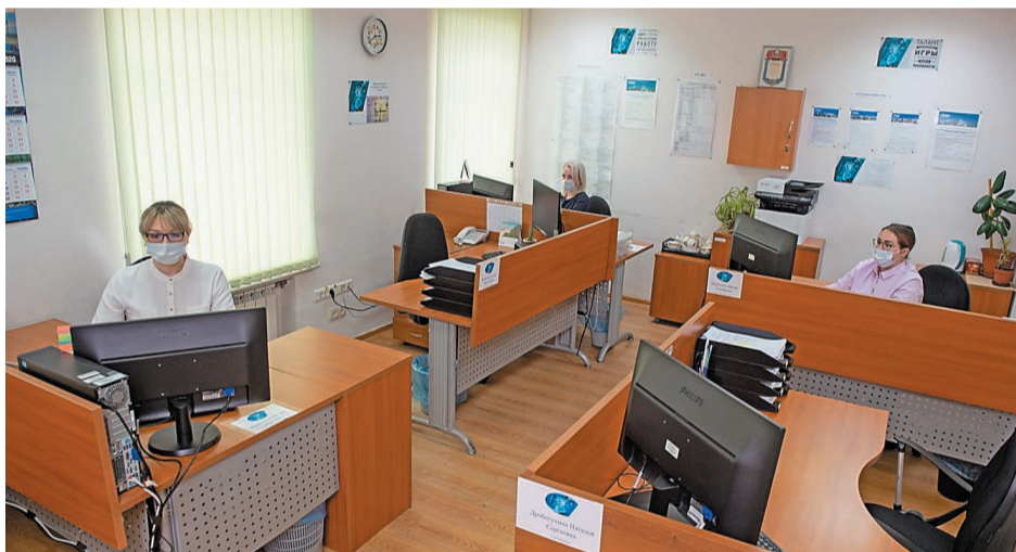
За короткий срок сотрудники подразделений навести порядок в кабинетах

Помимо наведения логического порядка сотрудникам предложили создать некий индивидуальный лейбл с учетом специфики своего отдела или центра. На работу был выделен месяц. Лучшим по сумме баллов оказался кабинет центра