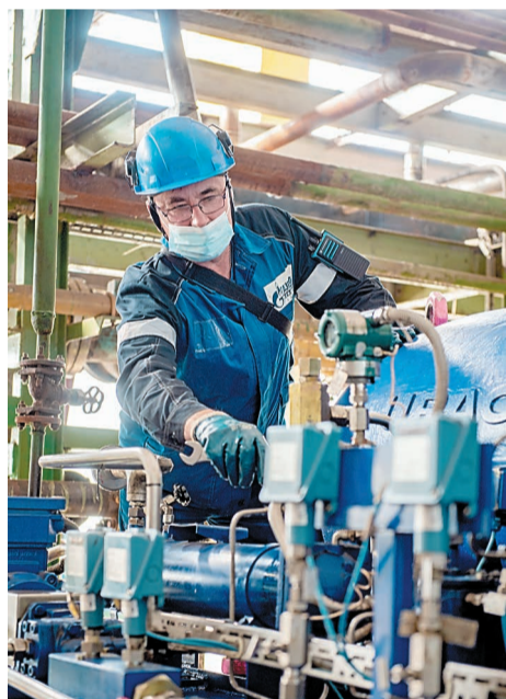
Работа была направлена на повышение безопасности эксплуатации оборудования

Во время капитального ремонта в цехе № 54 также были осуществлены работы по каталитическому сервису. В аппарат гидрирования сернистых соединений поз. 105 догружен катализатор ГПС-2Ф. В конвертере метана поз. 110 произведена частичная перегрузка катализатора НИАП-03-01 и загружены свежие катализаторы НИАП-03-01, ReforMax-210 LDP, ReforMax-330LDP. Данные работы выполнены для снижения складских запасов и продления срока службы каталитических систем. Выполнена замена адсорбента в аппарате поз. 418А, загружен новый адсорбент LMS Linde GB163.