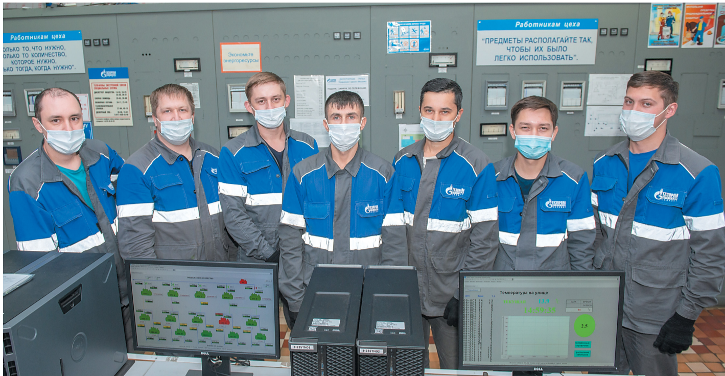
Вахту несет профессиональный коллектив