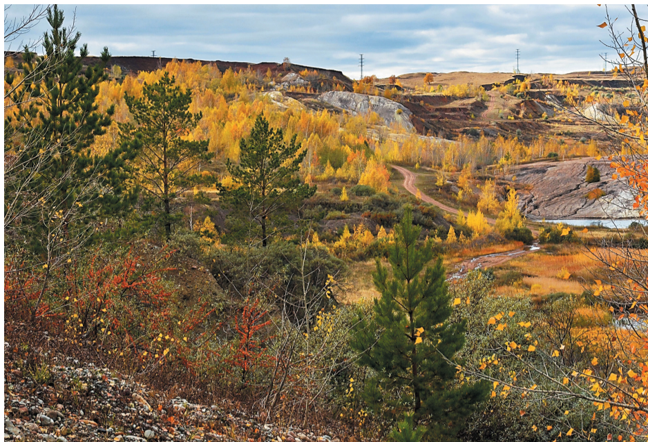
Бывший угольный разрез (карьер в г. Кумертау)

Фотоработы принимаются до 31 октября на электронных носителях в редакции газеты «Салаватский нефтехимик» (Пресс-центр, 2 этаж, кабинет № 209, тел. 42-08) каждый понедельник и четверг с 9 до 13-00 либо по электронной почте 02dnu@snos.ru. При отправке по электронной почте фотографии желательно разместить на корпоративном файлообменнике http://webfile.snos.ru/ либо на ЯндексДиске. Количество работ ограничено: не более 5 от одного участника.