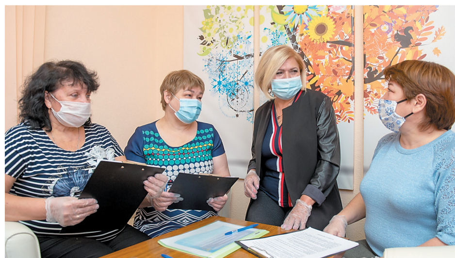
Координаторы центра «Молоды душой» отвечают ветеранам на все вопросы