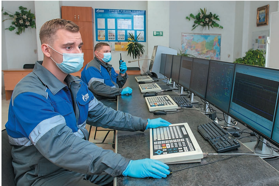
В компании реализуются мероприятия для создания комфортной рабочей среды

Следует сказать, что в соответствии со статьей 226 Трудового кодекса Российской Федерации предприятие должно осуществлять финансирование программы мероприятий в размере не менее 0,2 % суммы затрат на производство продукции (работ, услуг). Мероприятия Плана мероприятий составляются с учетом «Типового перечня ежегодно реализуемых работодателем мероприятий по улучше-