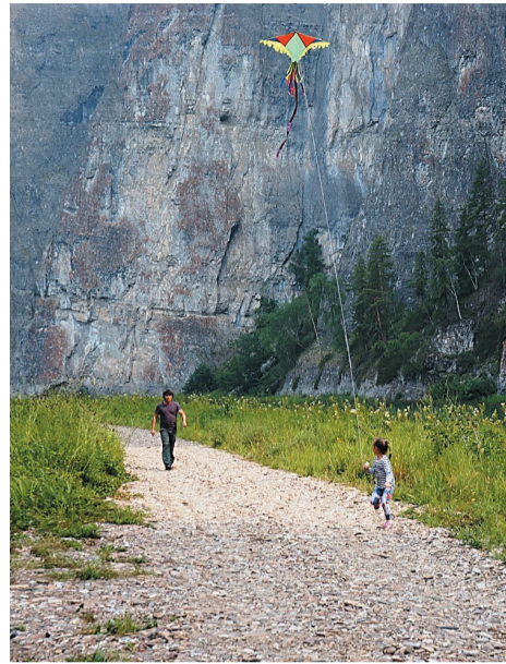
Возле скалы Мамбет.

Завершился фотоконкурс «Мы на природе», объявленный среди сотрудников ООО «Газпром нефтехим Салават». Конкурс длился почти три месяца и оказался очень актуальным, ведь этим летом многие сотрудники компании провели отпуск в родной Башкирии и в выходные не упускали момент – делали вылазки в красивейшие места республики, главным же условием конкурса было прислать фото на фоне башкирской природы.