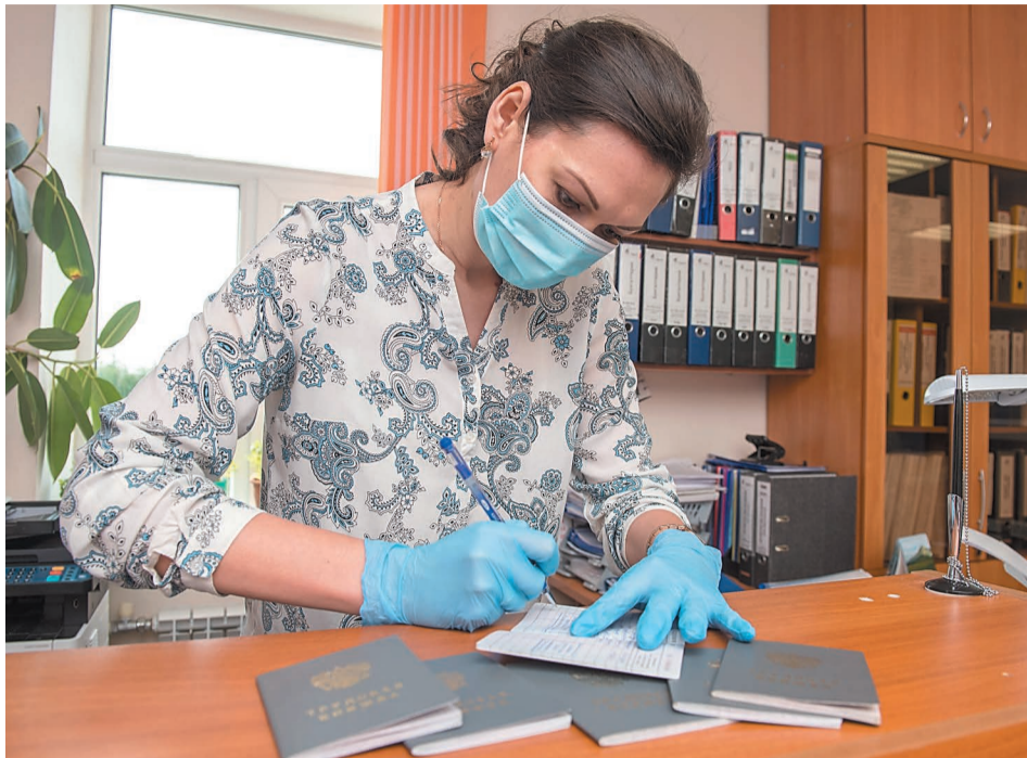
С 2020 года сведения о трудовой деятельности будут храниться в электронном виде

Сотрудникам, которые выбрали электронную трудовую книжку, специалисты