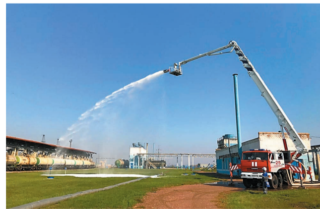
После модернизации АКП-50 возможности пожарно-спасательной части Общества повысились

Так, во время модернизации автомобиля был установлен сухотруб для обеспечения подачи требуемого количества воды (60 литров в секунду), насос-повыситель для обеспечения требуемого давления, емкость для хранения пенообразователя, лафетный ствол и комбинированные установки тушения пожаров «Пурга-30» и «Пурга-60». В результате получился уникальный автомобиль, совмещающий в себе функции пожарного автоколенчатого подъемника и пожарного пеноподъемника. Теперь с помощью данной техники, кроме спасения людей с высоты до 50 метров, можно еще проводить тушение пожаров на объектах Общества с использованием таких огнетушащих