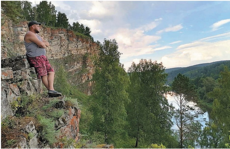
Вблизи Идрисовской пещеры с видом на реку Юрюзань.