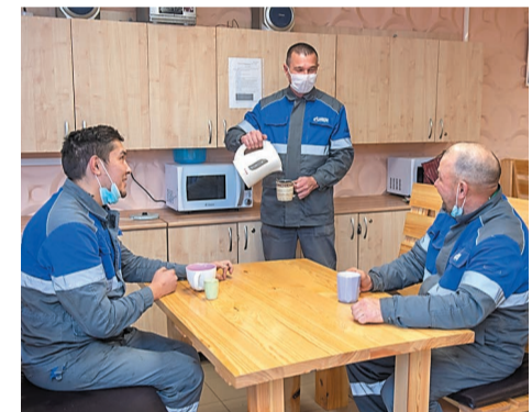
На участке технологического оборудования ЕСК отремонтировали комнату приема пищи