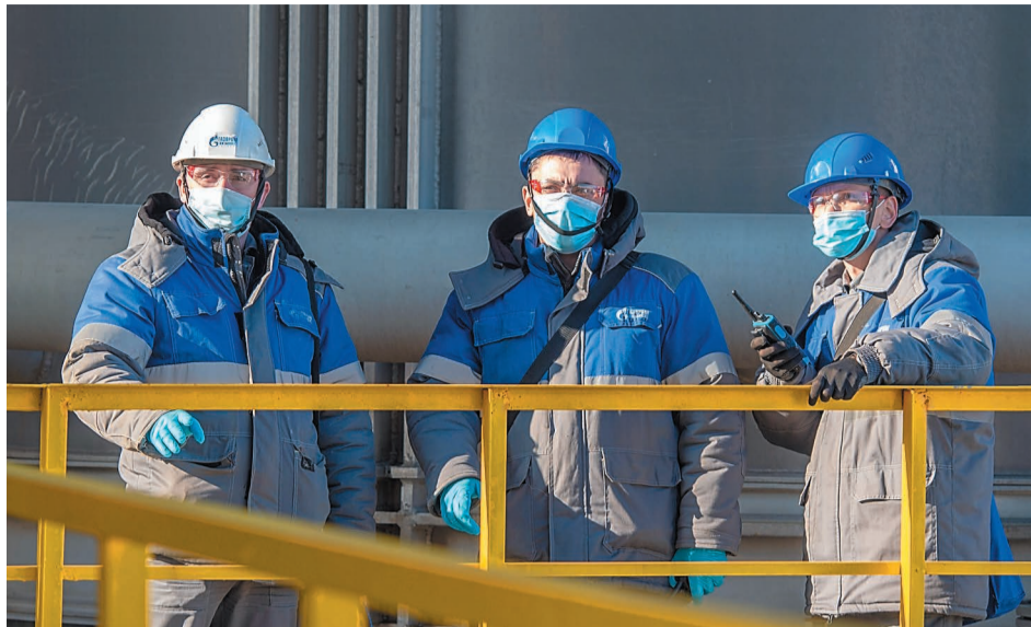
На производстве полиэтилена высокой плотности собрана отличная команда профессионалов

В 2015-2016 годах в цехе № 20 была проведена работа по изменению технологической схемы отвода маточного раствора при задействовании резервуарной емкости. Модернизация позволила увеличить производительность узла дистилляции гексана, повысить эффективность разделения парафина от гексана на узле выделения воска и достичь максимально