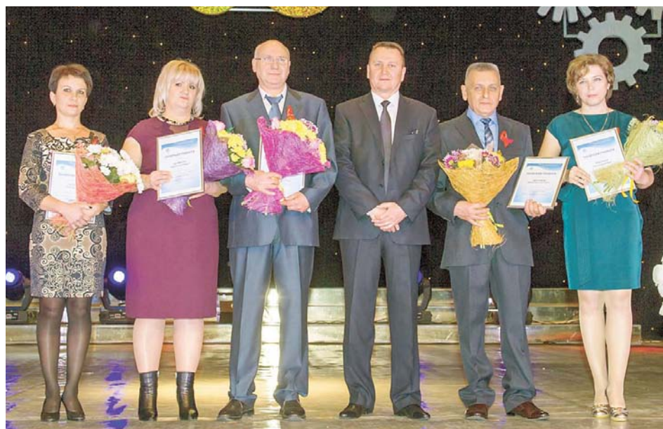
Лучших мастеров ремонтного дела зал встречал бурными аплодисментами

От имени администрации Общества он вручил директору РМЗ адресное письмо, в котором говорилось, что «коллектив завода может по праву гордиться своими достижениями и инновациями. Желаем всем работающим стабильности и процветания, самых смелых начинаний и сохранения сплоченности коллектива».