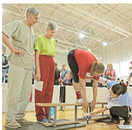
Активное участие в проекте приняли и ветераны компании. Самой старшей участнице было 78 лет

Более 1000 человек получили дисконтные карты, их владельцы в любое время могли прийти и заниматься тем видом спорта, который больше по душе.