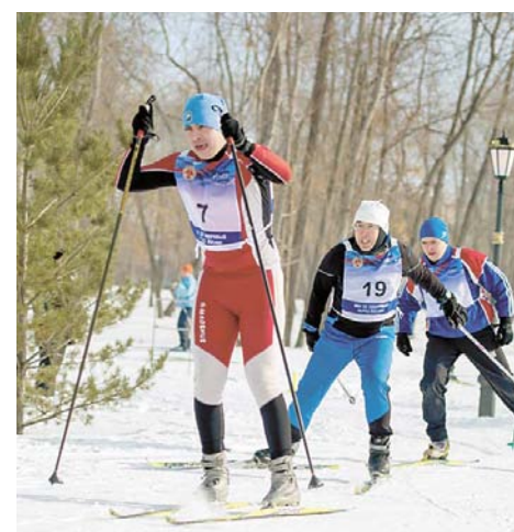
Лыжные гонки в этом году собрали рекордное число участников