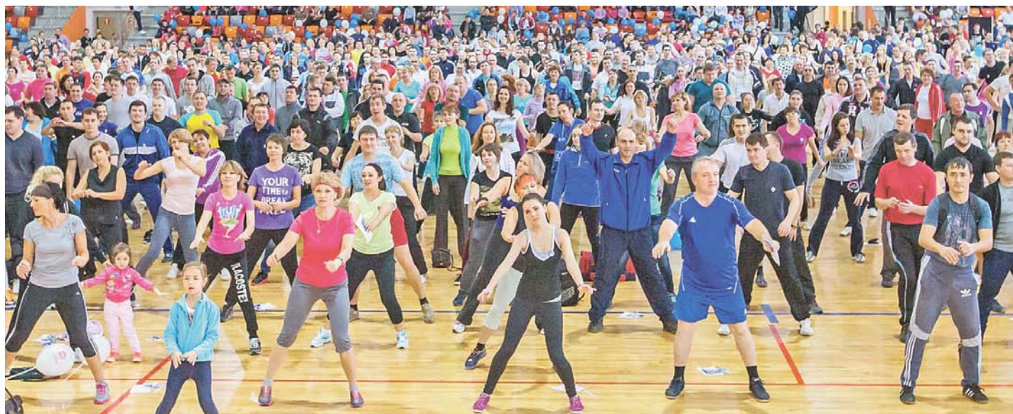
1748 сотрудников компании приняли участие в массовой сдаче ГТО и установили всероссийский рекорд, который был внесен в Книгу рекордов России

Активный старт дал не менее активное продолжение. В течение года сотрудники компании, любители активного образа жизни занимались в залах Дворца спорта, спортивно-концертного комплекса «Салават», бассейне «Золотая рыбка». Администрация компании предоставила всем, кто зарегистрировался и стал участником корпоративного проекта по сдаче норм ГТО, уникальную возможность бесплатно посещать оснащенные современным оборудованием спортивные объекты.