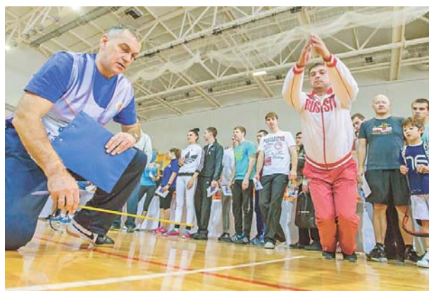
Многие сотрудники компании при сдаче норм ГТО установили личные рекорды