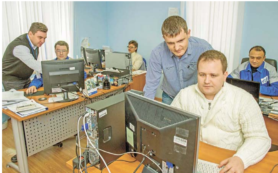
Команда из 10 человек ежедневно следит за защитой информации в компании

В 2006 году при участии сектора по защите информации в компании были впервые утверждены концепция безопасности и политика предприятия в области информационной безопасности (ИБ). Документы на долгое время определили