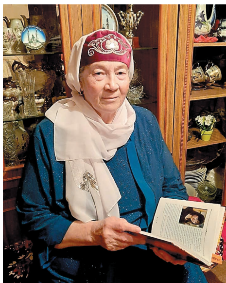
Ветеран размышляет о сохранении культуры языка