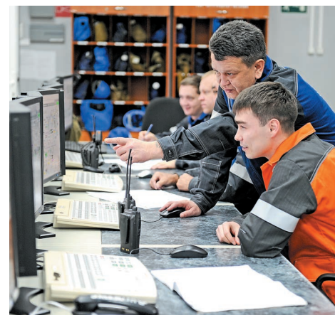
За мониторами – операторы и машинисты