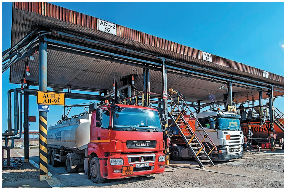
За 10 месяцев 2020 года компанией «Газпром нефтехим Салават» отгружено потребителям 867 тысяч тонн бензина неэтилированного марки АИ-92-К5

– Компания получила письма с поздравлениями, дипломы регионального и федерального конкурсов, благодарственное письмо Министерства промышленности и энергетики РБ за многолетнее участие в конкурсе «Лучшие товары Башкортоста-