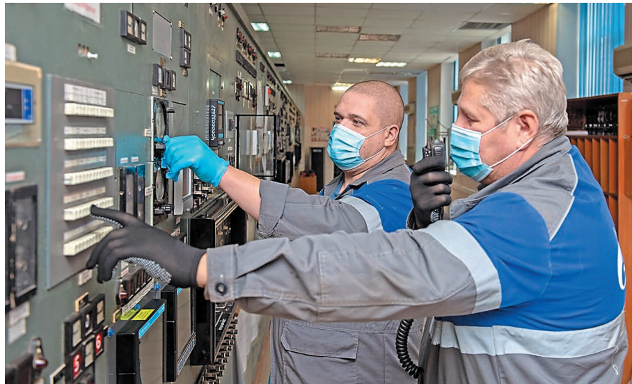
Обслуживающий персонал цеха № 23 принял активное участие в текущем ремонте

На установке грануляции выполнено техническое обслуживание щеточных систем двигателей постоянного тока главных приводов 10 грануляторов и режущих ножей этих грануляторов. Здесь также заменили вышедшие из строя нагревательные элементы обогрева цилиндров грануляторов.