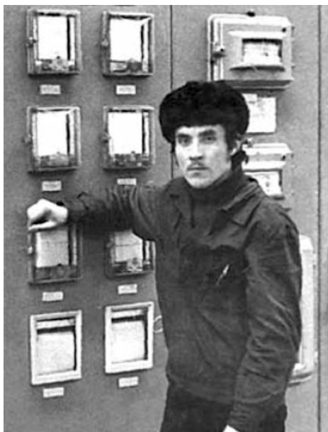
1970-е годы. На установке ГО-2

В те времена часто случались поломки. Если сегодня установка может работать в нормальном режиме продолжительное время, то раньше ремонты проводились очень часто. Специалисты за свои места особенно не держались: то приборы ломаются, то оборудование на ремонте, работали 24 дня