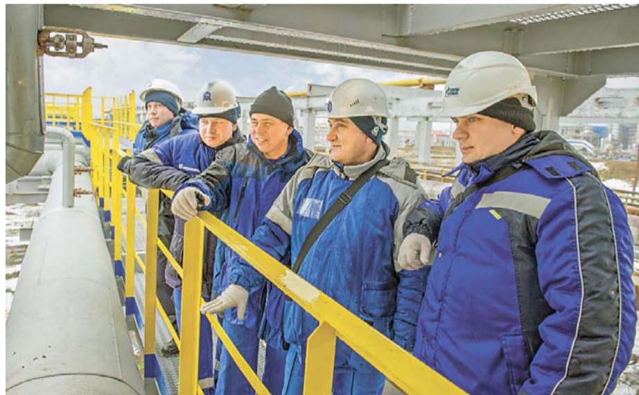
Комиссия проводит комплексное опробование коллектора пара

Проект неоднократно приходилось дорабатывать и вносить корректировки. Инвестором-застройщиком выступил УКС ОАО «Газпром нефтехим Салават», помощь в проработке технических решений оказывало УГЭ компании. Исполнителями работ стали ООО «Проектный институт «Салаватгазонефтехимпроект» и проектный офис «Объекты заводского хозяйства» ОАО «Салаватнефтехимремстрой». Действовать приходилось в стесненных