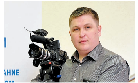
Режиссером видеопроекта «Письма на фронт» стал Сергей Чугунов

Видеоролик Пресс-центра «Письма на фронт», посвященный 75-летию Победы в Великой Отечественной войне, в 2020 году занял третье место в IV Всероссийском конкурсе СМИ, пресслужб компаний ТЭК и региональных администраций «МедиаТЭК-2020».