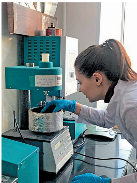
В лаборатории Салаватского филиала УГНТУ

Сегодня студенты работают над очень интересной проблемой – это синтез новых эффективных модифицирующих добавок для битумов на основе отходов и побочных продуктов нефтехимических производств ООО «Газпром нефтехим Салават» и интенсификация процесса окисления за счет активирования сырья битумного производства. Для своих исследований молодые ученые используют отходы производства полиэтилена высокого и низкого давления, кубовый остаток ректификации