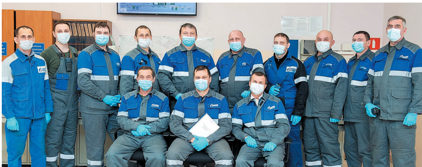
Бригада № 3 отличается своей взаимовыручкой, операторы и машинисты помогают друг другу во всем