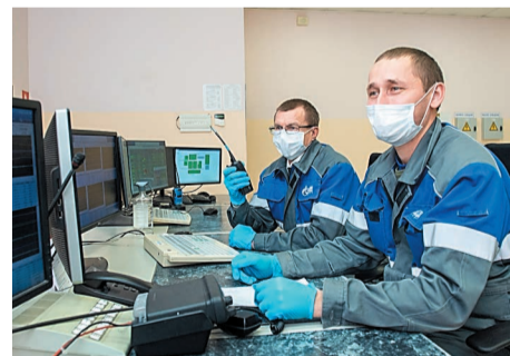
В бригаде немало профессионалов, у которых есть чему поучиться