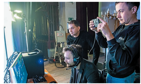
За кулисами. Напряженная работа режиссеров трансляции