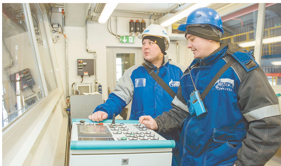
Новая установка работает с минимальным привлечением рабочих рук