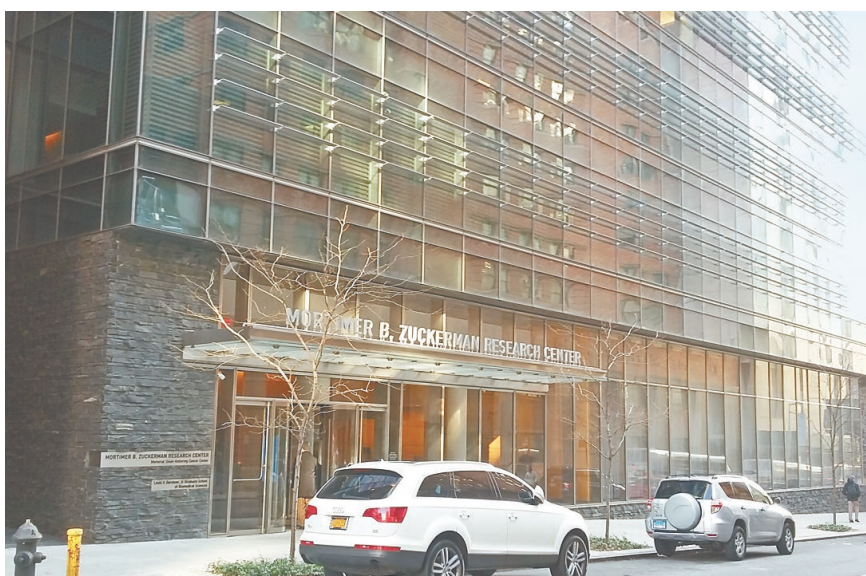
Онкологический центр Мемориал Слоан Кеттеринг (MSKCC) Нью-Йорка США