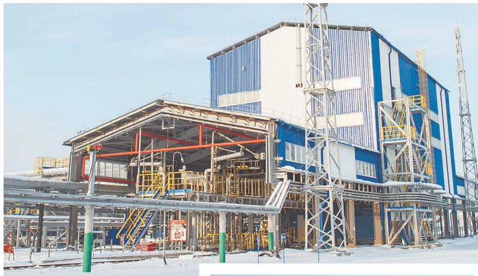
За три года площадка обросла металлоконструкциями

Установка тактового налива темных нефтепродуктов была построена на площадке «Г» товарно-сырьевого цеха не-