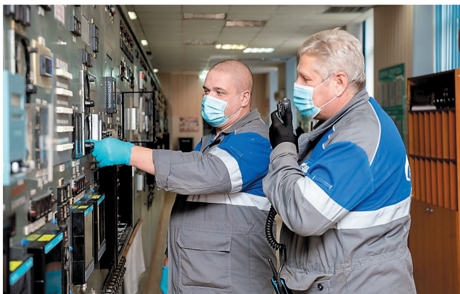
Производство полиэтилена высокого давления вышло с ремонта на нормальный технологический режим

Техническое обслуживание щеточных систем двигателей постоянного тока, только уже грануляторов, проводилось