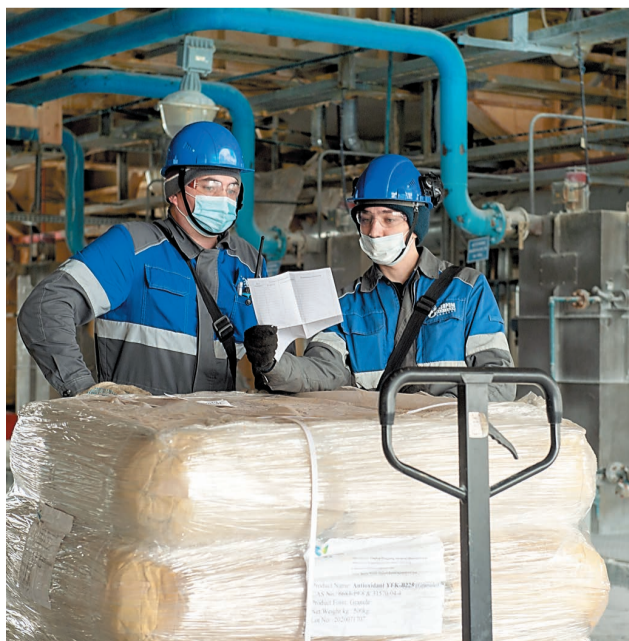
Процессинговая добавка дала положительный результат во время фиксированного пробега в цехе № 20

8 фиксированных пробегов прошло в 2020 году в рамках оптимизации планирования производства и технико-экономических показателей. Два из них наиболее значимы. На производстве ЭП-355 была установлена возможность переработки бензиновой фракции с облегченным составом (температура конца кипения до 174 °С) в объеме 130 т/ч в холодное время года и 121 т/ч в теплое время года с соответствующим сокращением переработки ШФЛУ. Была реализована схема транспортирования Оренбургского стабильного газового конденсата в смеси с нефтью Царичанского месторождения по конденсатопроводу-отводу IV нитки Оренбург – Салават – Уфа в парк ЭЛОУ пл. «А» ТСЦ НПЗ.