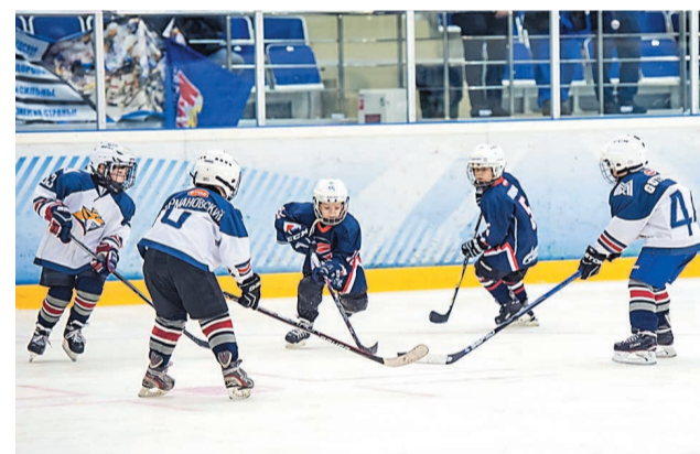
Мальчишки с нетерпением ждут своего выхода на лед