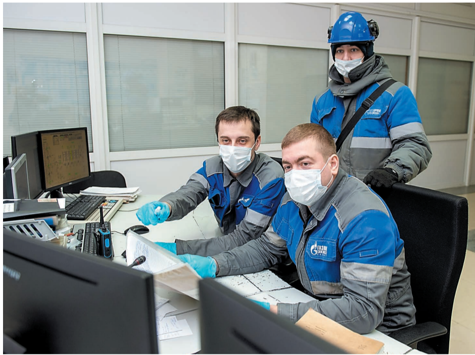
Коллектив цеха № 20 участвует в процессе подбора аналогов