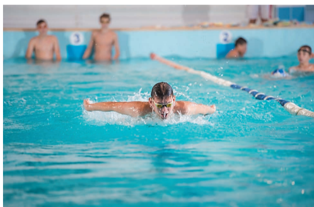
На голубых дорожках «Золотой рыбки»

– Каждые 2 часа будет проводиться проветривание и дезинфекция помещений, особое внимание уделяем, конечно же, раздевалкам. Мы подготовились основательно,