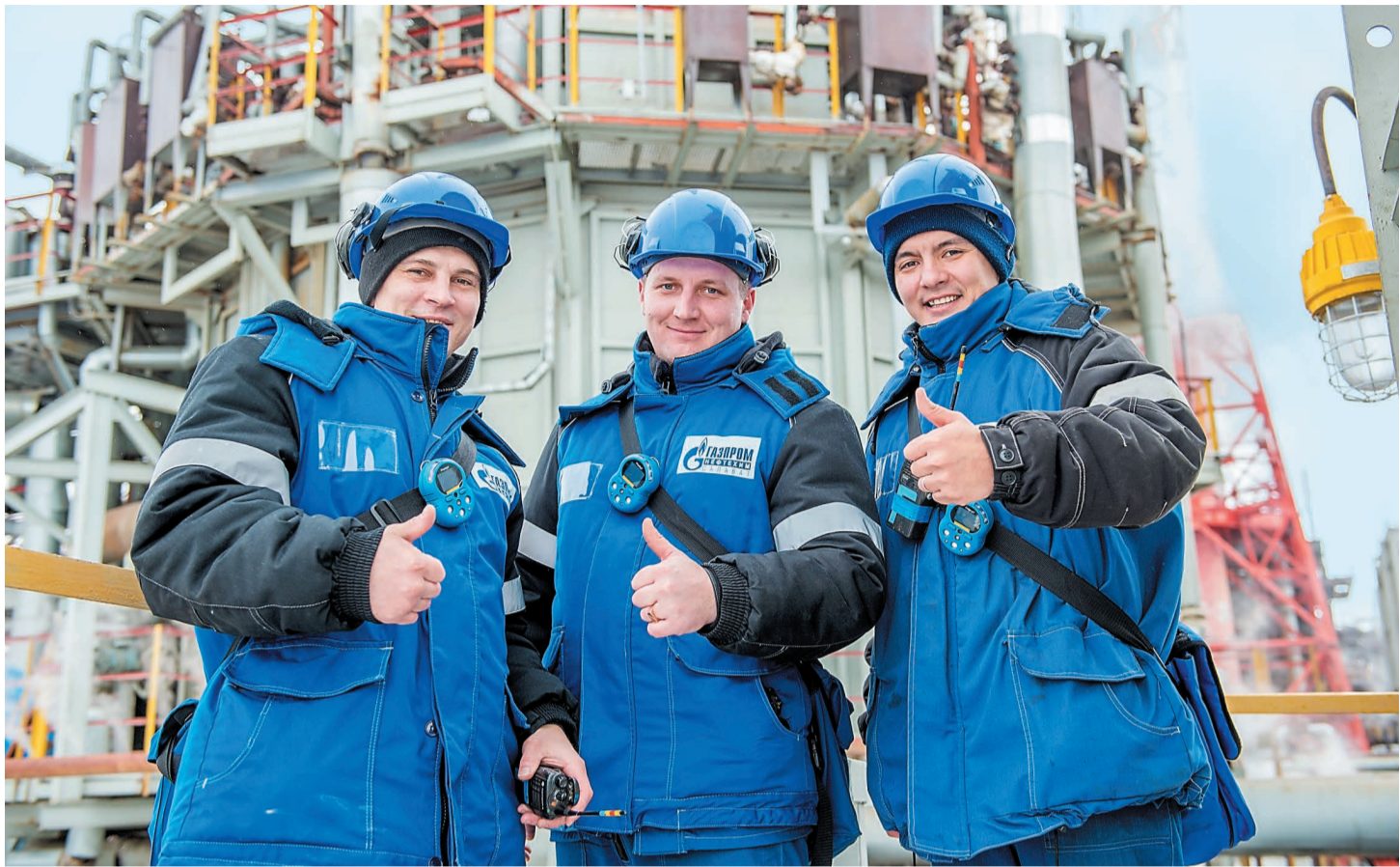
Каждый в компании имеет возможности для своего развития и профессионального роста.

Сейчас, когда за плечами почти 200(!) заседаний кадрового комитета, почти 600 кандидатов и более 270 работников, полу-