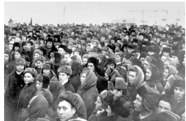
Митинг трудящихся, посвященный пуску Ново-Ишимбайского нефтеперерабатывающего завода