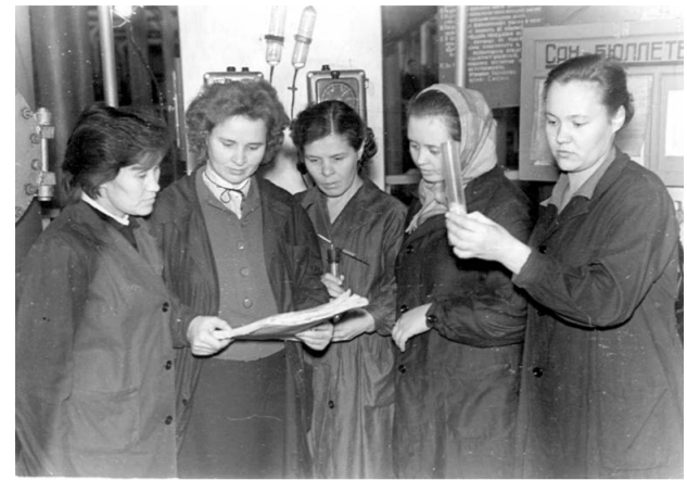
1954 год. На катализаторной фабрике