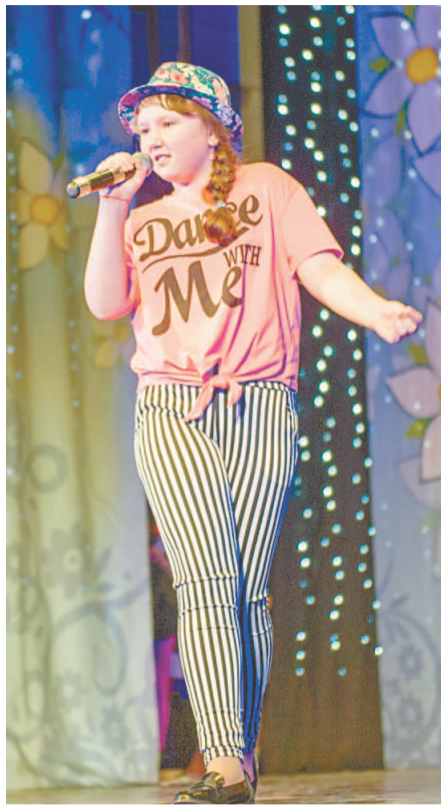
Вокалисты исполнили народные песни и современные хиты, произведения детского и массового репертуара