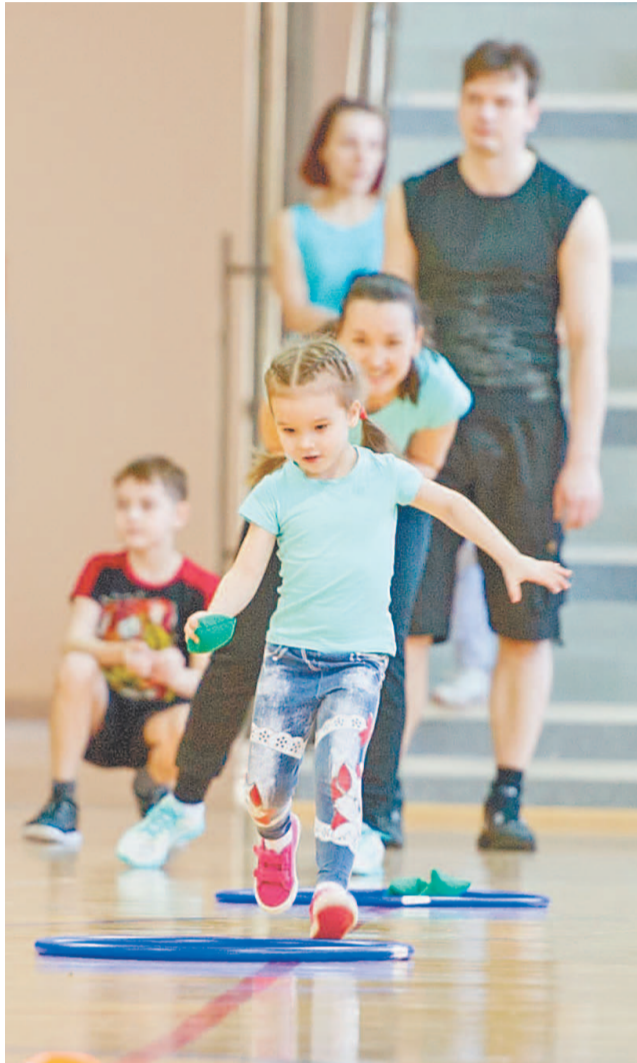
Все семейные команды показали себя дружными, готовыми постоять за честь своей семьи

Бегающие ребятишки, довольные папы, улыбающиеся мамы – всё это краски семейных стартов «Мама, папа и я – спортивная семья», которые состоялись в минувшие выходные во Дворце спорта «Нефтехимик». Соревнования прошли в зачет IX Комплексной спартакиады среди производственных коллективов ОАО «Газпром нефтехим Салават».