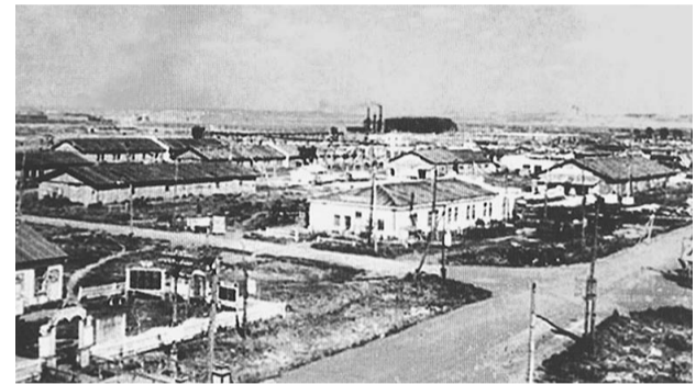
В 1954 году рабочий поселок получил статус города и название Салават