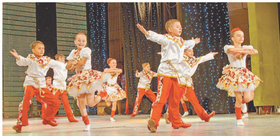
«Родничок» на конкурсе заслужил высшую награду – Гран-при

Конкурс «Весенние капли» под патронажем ОАО «Газпром нефтехим Салават» – единственный в республике конкурс, имеющий столь продолжительную историю. Первоначально он задумывался исключительно для детей работников нефтехимической компании, затем получил республиканский статус.