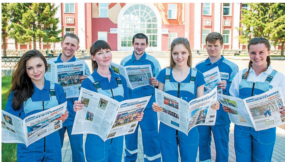
5445 номеров выпущено за 65 лет существования корпоративной газеты

А еще хорошо запомнилось первое впечатление от комбината. Мне тогда с со-