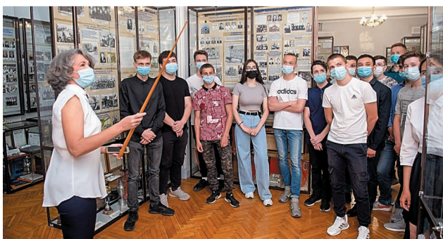
Студенты и школьники являются частыми гостями музея Общества. За 16 лет работы музей принял более 30 тысяч посетителей

Студенты Салаватского индустриального колледжа побывали в музее трудовой славы ООО «Газпром нефтехим Салават». Они с интересом познакомились с историей и современными достижениями этого огромного градообразующего предприятия нефтехимии и нефтепереработки.