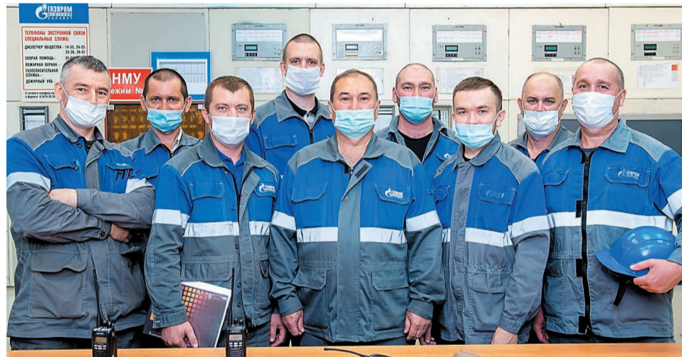
На смене – бригада № 2