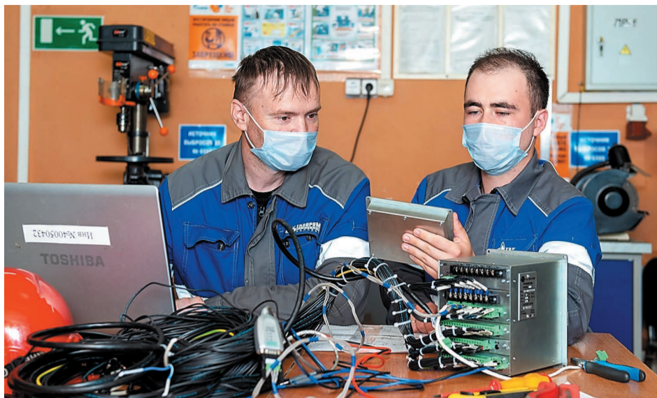
Отладка микропроцессорного терминала на базе мастерской группы релейной защиты и автоматики электротехнической лаборатории

– Проще говоря, один микропроцессорный терминал выполняет функцию защиты, которую раньше мы выполняли при помощи 10 реле. Теперь это одно устройство, в котором содержится процессор. Мы подключаемся к нему при помощи ноутбука и вводим в него все нужные нам параметры и требования. То есть все изменения в схеме происходят в виртуальной