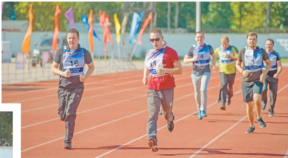
Всего за три часа спортивного фестиваля участники общества пробежали 105 км

Задорно, весело, по-семейному дружно провели вечер накануне первых июльских выходных сотрудники Управления корпоративной безопасности Общества. Представители разных подразделений УКБ с женами, мужьями, детьми вышли на спортивные старты, чтобы помериться силами, показать свою ловкость, выносливость и командное единство.