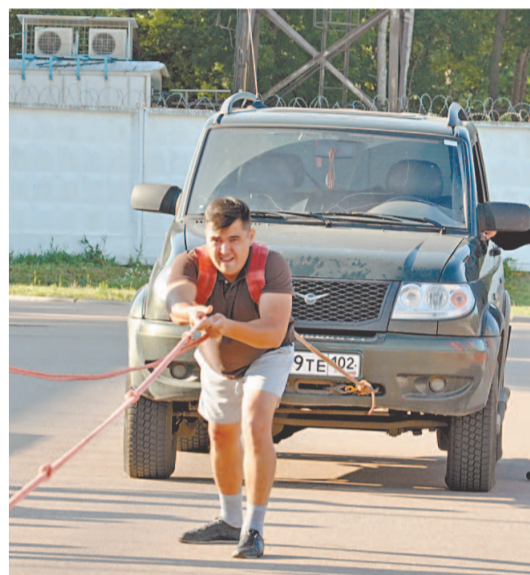
Крепким мужчинам УКБ и 3000 кг под силу