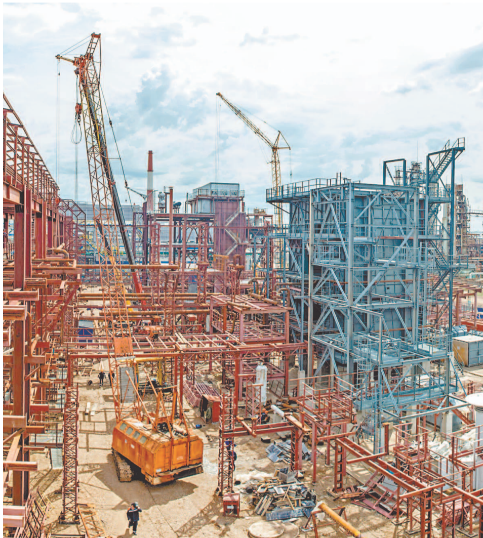
Завершение сборки радиантной секции печи парового риформинга P-101

– В этой печи будет происходить процесс риформинга, – продолжает Кон-