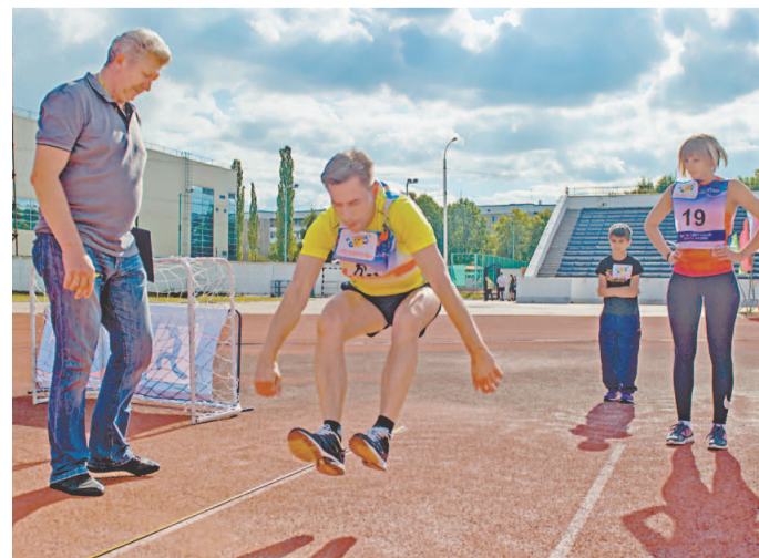
Спортивные родители — хороший пример для подражания

— Спартакиада, на мой взгляд, удалась. Организаторы постарались, и участники не подвели. С удовольствием пробежал короткие дистанции, хотя сейчас в основном практикую дальние: 8, 12, 16, 20 километров. Недавно пробежал полумарафон в Стерлитамаке в честь юбилея города. В сентябре в Уфе планирую участвовать в марафоне.