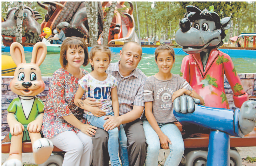
Семье не часто удается куда-то выехать, поэтому любая поездка – большая радость для детей и родителей

Он увидел ее в вахтовом автобусе, следующем из города в промзону. Работали в одной смене, и молодой человек несколько месяцев наблюдал за бойкой симпатичной девушкой с очаровательной улыбкой. Подойти не решался. А она, признается, не чувствовала его взгляда. Однажды, когда был в отпуске, собрался с духом, специально сел в вахтовый автобус и подошел к незнакомке. Разговорившись, проводил до рабочего места. Через полгода молодые люди поженились.