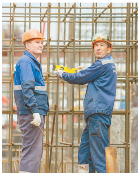
Завершается сборка арматурных каркасов фундаментов компрессорных установок РК-101А/В, РК-102А/В.