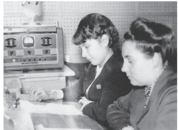
1970 год. Запись очередной радиопередачи