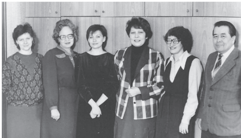
С коллективом редакции газеты «За передовую технику»

“ «Есть люди, встретившись однажды с которыми, понимаешь, что судьба преподнесла тебе эту необычную встречу как подарок. Они имеют ясную жизненную позицию, понимают истинность явлений и событий, глубину души – этим и интересны миру. Рядом с ними испытываешь искренние эмоции. Р.Ф. Зыкина – из таких уникальных личностей.»