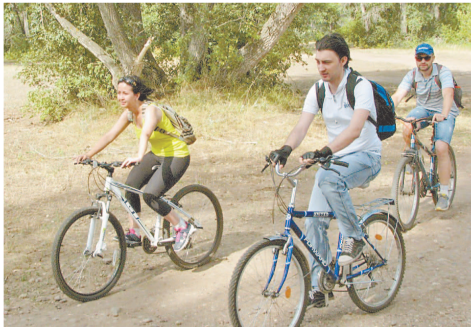
330 км за два часа накрутили сообщца велосипедисты «Салаватнефтехимпроекта»

– Трасса мне показалась легкой, – делится впечатлениями специалист отдела