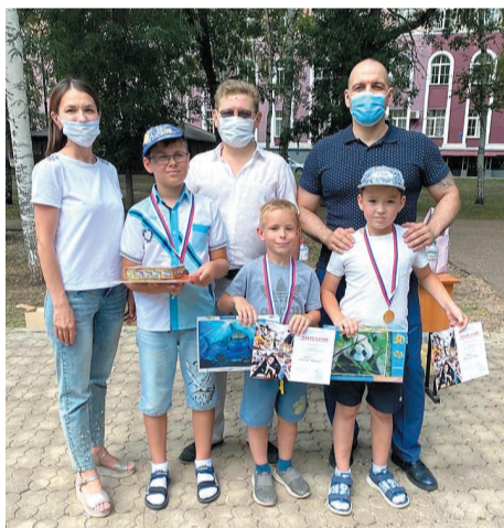
Победители награждены дипломами и подарками

– Этим летом профсоюзная организация сделала акцент на спортивные и культурно-массовые мероприятия среди детей работников. Приятно то, что среди них оказалось так много любителей интеллектуальной игры шахматы. За время шахматных баталий, а самые сильные участники сыграли по 9-11 партий, маленьким шахматистам приходилось анализировать ситуацию на доске, просчитывать возможные ответные ходы соперников. На расстоянии, но очень эмоционально за ребят болели их родители, младшие братья и сестры. Конечно, пришлось проводить соревнования в условиях новой реальности, с соблюдением всех мер профилактики и защиты от COVID-19, но от этого событие не стало менее увлекательным.