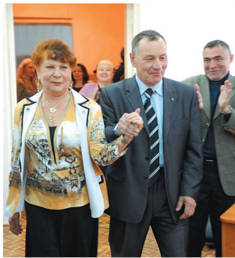
2016 год. Во время презентации новой книги