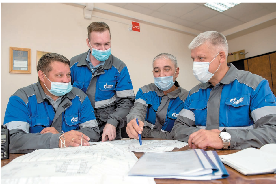
Во время подготовки рацпредложения