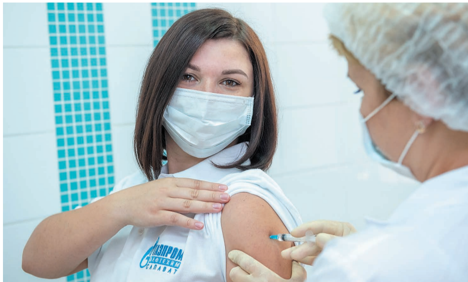
Ежедневно в компании вакцинируется более 200 человек

Между тем в компании продолжают проверку установленных требований (законодательных и корпоративных) по предотвращению распространения НКВИ на объектах предприятия, сотрудники обеспечиваются средствами индивидуальной