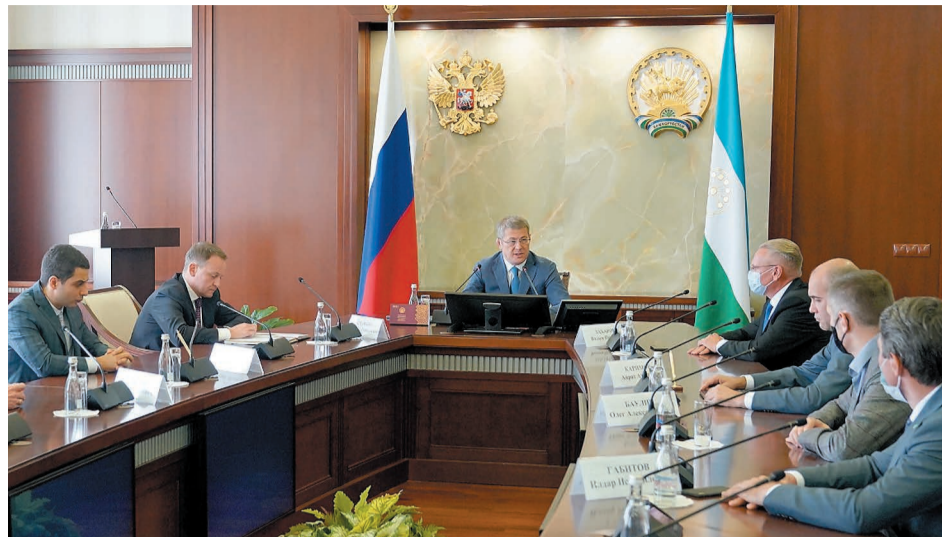
В состав консорциума вошли правительство республики, представители образовательных, научных организаций и предприятий реального сектора экономики

ционирования карбонового полигона в Башкортостане на 2021-2022 годы.