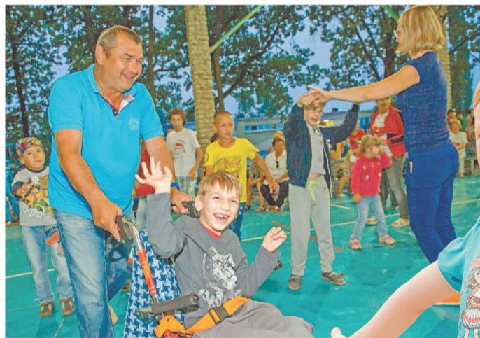
Во время представлений никто из детей не хотел сидеть на месте

Организаторами короткой лагерной смены в «Спутнике» для детей с ограниченными возможностями стали ОАО «Газпром нефтехим Салават», Профсоюз № 1 и Первичная профсоюзная организация Общества.