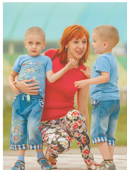
Мамы и папы удивлялись активности своих чад

Учитывая специфику заболеваний ребят, организаторы продумали программу детского заезда до мелочей.