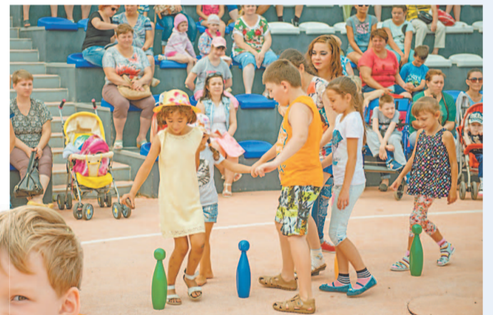
Дети признались, что больше всего они любят играть, соревноваться и выигрывать