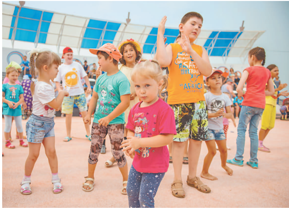
«Веселый уикенд» в «Спутнике» многим помог отвлечься от своих недугов

Самые яркие впечатления, конечно, у малышей и подростков остались после купания в бассейне. Субботний день выдался жарким, и из воды несколько часов доносились довольные голоса, визг и детский смех. Множество впечатлений и эмо-