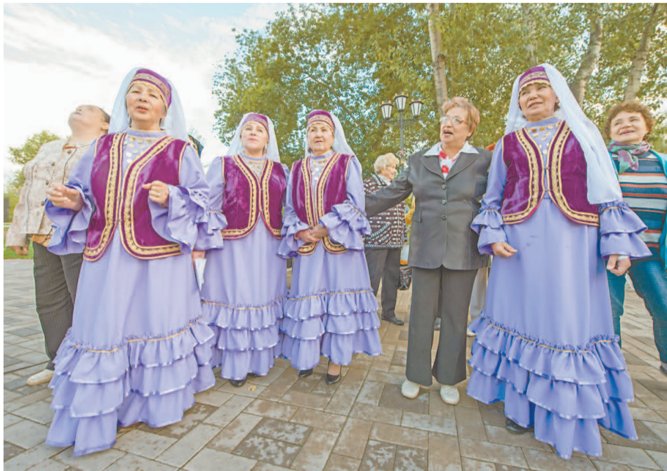
Зрители с удовольствием подпевали любимые песни

В прошлую субботу зажигательные мелодии зазвучали на ретро-площадке задолго до начала мероприятий, привлекая ветеранов и просто гуляющих по парку посетителей. Программа оставалась традиционной: ровно в пять часов начался концерт самодельной группы Совета ветеранов. Для отдыхающих вдохновенно пели на русском и татарском языках ансамбли «Ветераночка» и «Хайят». Несмотря на неустойчивую погоду – несколько раз за вечер принимался дождь, – на площадке у озера собралось немало детей и