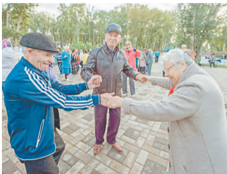
Мероприятия на площадке длились более трех часов

Веселое настроение, праздничная атмосфера привлекает на ретро-площадку не только горожан старшего поколения, сюда подтягиваются любопытные ребятишки с родителями, послушать самодельных артистов останавливаются и молодожены. Дети, кто посмелее, тянутся к микрофону и уходят с призами, а недавно образовавшиеся молодые семьи получают поздравления и музыкальный подарок.