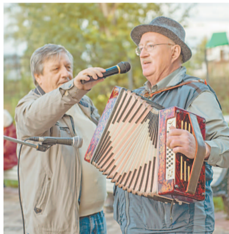
Многие горожане не пропустили ни одного музыкального вечера в парке