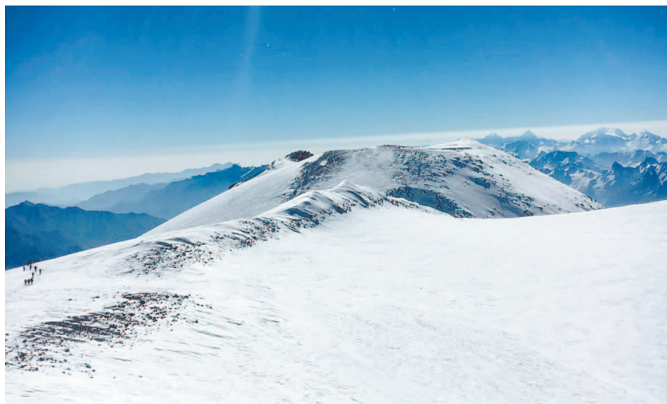
Эльбрус — высочайшая гора Европы, которая представляет собой потухший вулкан и состоит из двух вершин. Западная вершина имеет высоту 5642 м, Восточная — 5621 м. Расстояние между ними приблизительно 3 км. Гора расположена в северной части Большого Кавказского хребта, на границе Карачаево-Черкесии и Кабардино-Балкарии.

На третий день группа поднялась на высоту 4200 м. Здесь запомнилось завораживающее зрелище: гроза, сверкающая молния, все это было видно сквозь облака, над которыми находились туристы.