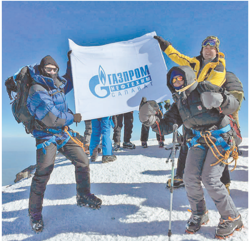
Участники восхождения надеются вернуться на Эльбрус

Отсюда, переночевав, отправились в очередной акклиматизационный поход на высоту 5000 м, на этой высоте стала резко ощущаться низкая концентрация кислорода в воздухе, каждый шаг давался очень тяжело. Осознание того, что впереди ждет большая высота и достижение заветной вершины, укрепляло дух и давало силы двигаться дальше; к вечеру вернулись в штурмовой лагерь на высоте 4200 м.