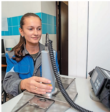
Дозиметристы ведут контроль снимаемого загрязнения с поверхностей блоков РИП...