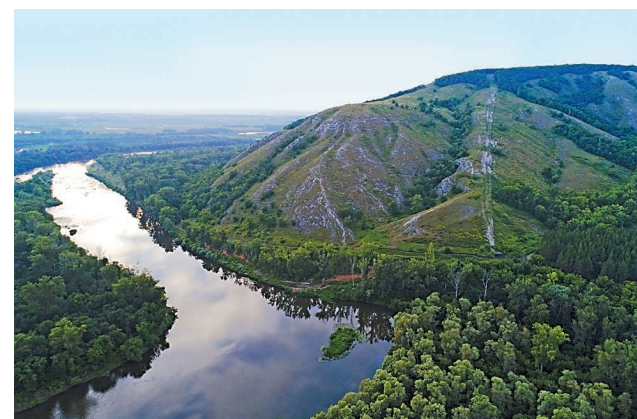
Гора Куштау в Стерлитамакском районе.

Важно! Своим участием в конкурсе автор подтверждает безвозмездную передачу фотоработы для публикации в корпоративном календаре ООО «Газпром нефтехим Салават», газете «Салаватский нефтехимик» и официальных аккаунтах ООО «Газпром нефтехим Салават» в социальных сетях, разрешение на фотокоррекцию и кадрирование изображения без искажения смысла фотографии, публикацию персональных данных автора: фамилии, имени и места работы, личного аккаунта в социальной сети Instagram.