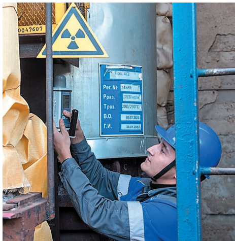
...и радиационный контроль блоков РИП