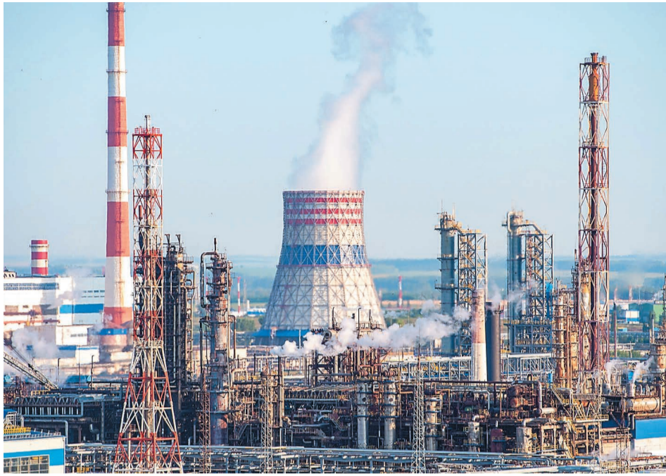
Carbon в переводе с английского – углерод. А диоксид углерода – это один из парниковых газов и на сегодняшний день одна из самых больших проблем человечества.