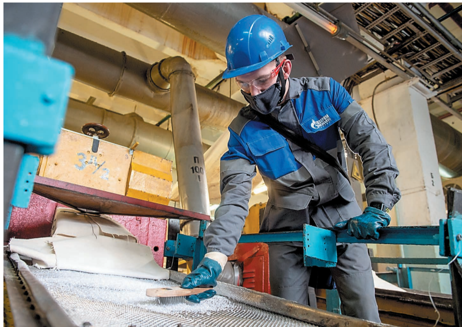
На производстве полистирола в цехе № 47

В ООО «Газпром нефтехим Салават» завершена работа по подготовке к проведению инспекционного контроля за сертифицированной продукцией, предназначенной для самых маленьких наших потребителей, – горшками детскими туалетными из полистирола.