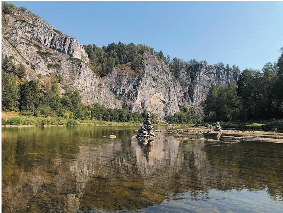
Река Белая, Бурзянский район. Одна из первых прислала фотографии на конкурс инженер-технолог Управления главного технолога Общества Татьяна Фокина

Отдельно в приложении автору фотографий необходимо указать свою фамилию, имя, отчество, должность, название