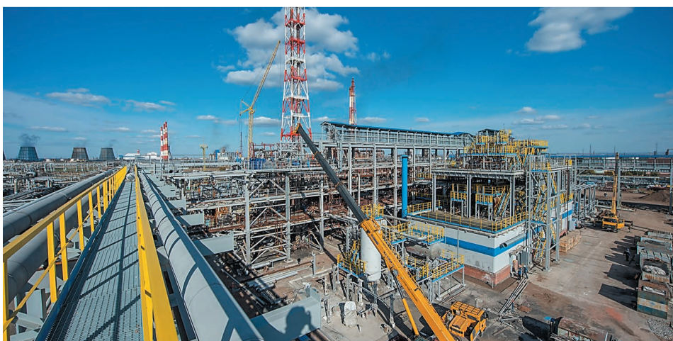
Строительство новой установки ПЭС

Создание карбонового полигона – приоритетный для республики стратегический и научно-образовательный проект с бюджетом в 702 миллиона рублей. Проект по созданию в России сети карбоновых полигонов реализуется по поручению Президента Владимира Путина.