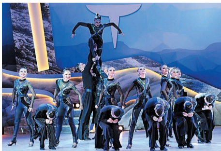
Ансамбль бального танца «Весна»