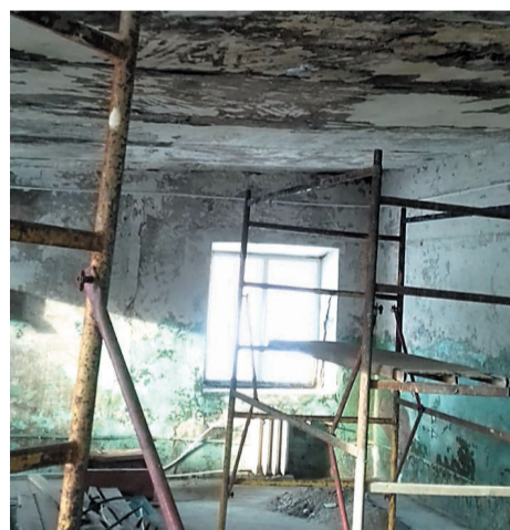
В Зилаирской школе-интернате. Было...

Кроме помощи детям Зилаирской школы-интерната в этом году завершён ремонт мастерской в Петровском детском доме, который был начат в прошлом году. Благодаря участию компании АО «НХРС» выполнена внутренняя отделка помещения, заменены окна, ООО «Альянс-Сервис» изготовило мебель, а на собранные средства нефтехимиков были закуплены специализированные станки по дереву и металлу. Сейчас мастерская функционирует, директор детского дома прислал фото поделок, которые ребята сделали своими руками. Также в рамках акции для Дома малютки (г. Стерлитамак, ул. Щербакова, 9) были закуплены памперсы и детское питание. Для ГБУ Детский дом (г. Салават) был приобретен спортивный инвентарь. Чтобы все было прозрачно, и все знали, на что тратятся средства, по итогам проделанной работы каждый год по электронной почте направляется отчет в виде презентации с фотографиями и приложенными кассовыми чеками.