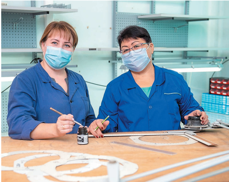
Профессия фотолаборанта – очень редкая на комбинате

Обычно во время капитальных ремонтов на установках вторичные приборы снимают, доставляют в цех ремонта КИП и А и разбирают для ремонта. Затем шкалы от приборов поступают в малярное отделение, где их полностью очищают, а