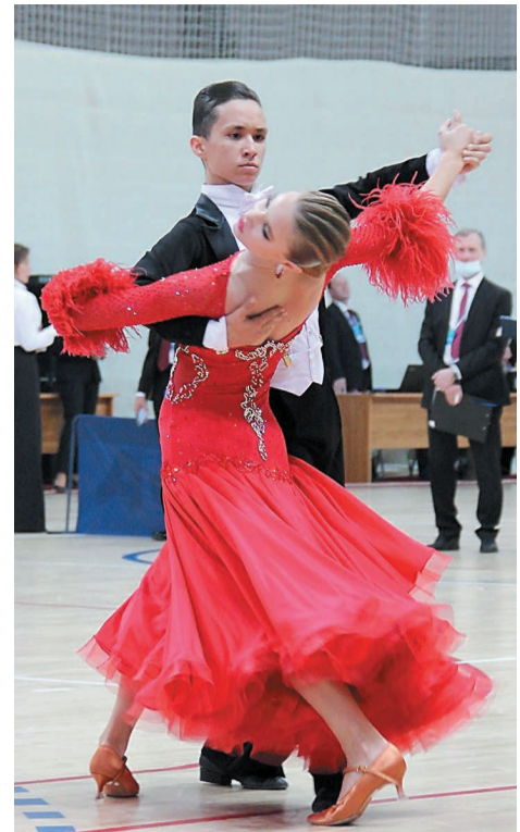
Большинство пар за время карантина соскучились по паркету

– От этих соревнований останутся хорошие впечатления, несмотря на то, что мы ожидали немного большего – наилучшего результата. Поэтому есть к чему стремиться