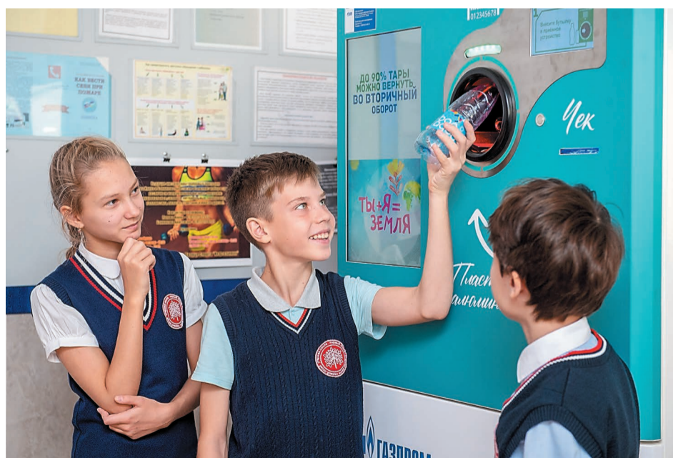
Дети активно присоединяются к движению по раздельному сбору мусора

– 15 декабря организационная группа, в которую войдут и представители ООО «Газпром нефтехим Салават», подсчитает талоны и определит команду-по-