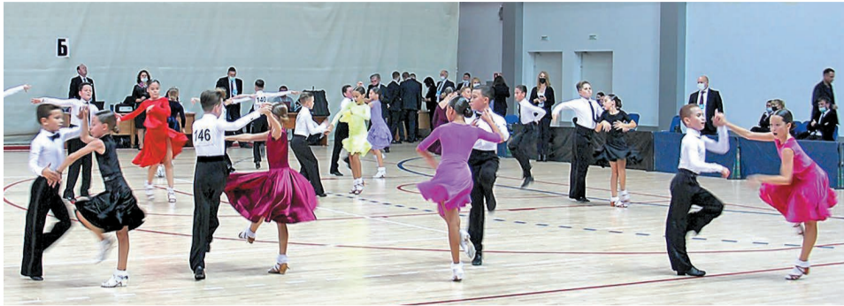
Более 500 танцевальных пар приняли участие в соревнованиях

В САЛАВАТЕ ПРОШЛО ОТКРЫТОЕ ПЕРВЕНСТВО КУБКА ООО «ГАЗПРОМ НЕФТЕХИМ САЛАВАТ»