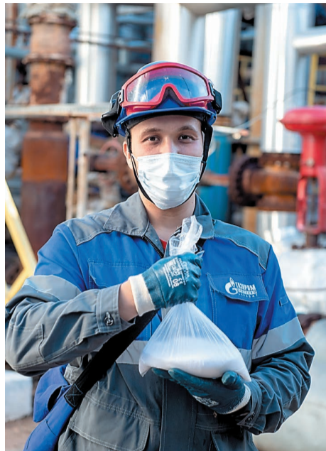
По окончании пробега будет оценена эффективность флокулянта

В цехе № 54 газохимического завода начались испытания нового флокулянта очистки воды для технологического процесса производства аммиака.