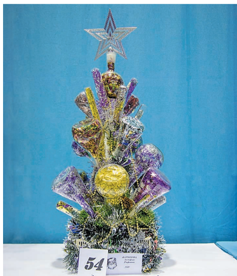
Елка, занявшая III место

Корпоративный конкурс «Новогодняя елка – 2022» подошел к концу. Жюри огласили результаты. Победила елочка коллектива лаборатории полимеров цеха № 47 отдела технического контроля Лабораторно-аналитического управления (ОТК ЛАУ).