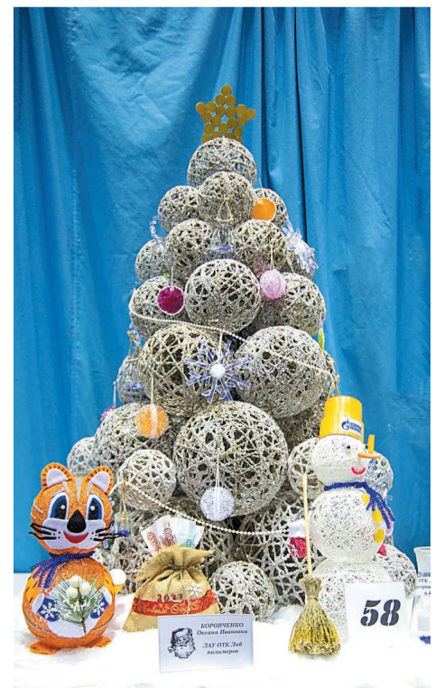
Елка, занявшая I место