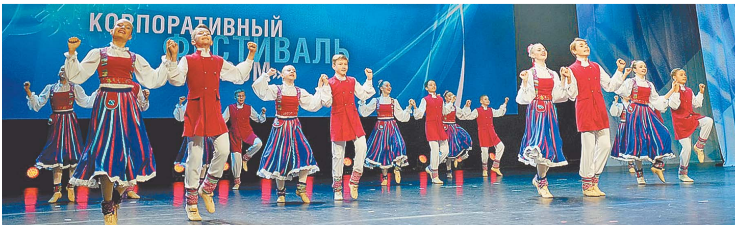
Ансамбль «Родничок» впервые принимал участие в финале «Факела»

Успех на «Факеле» – это результат большой работы. Вдвойне сложно было детскому ансамблю «Родничок», которому пришлось сражаться с очень сильными и многочисленными коллективами, поэтому их второе место дорогого стоит. Было очень приятно слышать восторженные отзывы после выступления наших ребят.