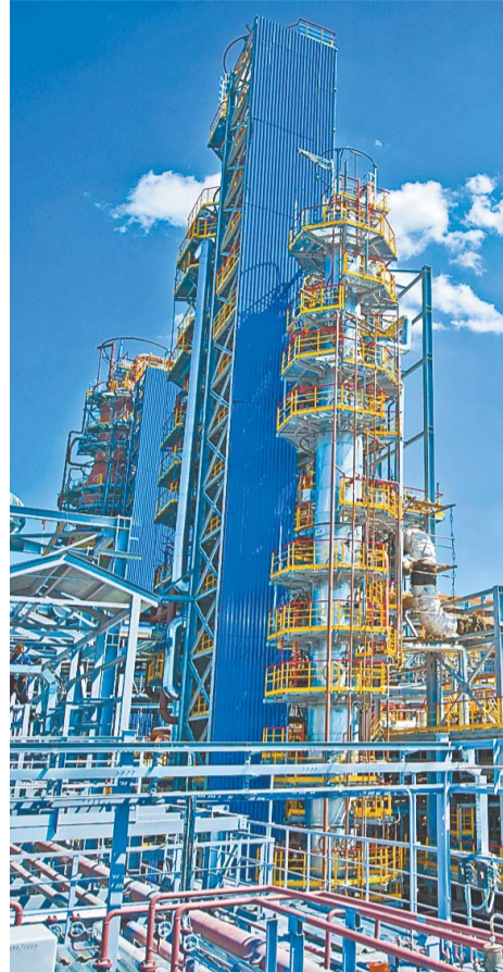
За все время работы на ЭЛОУ АВТ-6 переработано более 17 млн тонн сырья

Как отмечают сами производственники, начиная с 2015 года на установке началась новая веха в развитии. С этого времени сделали акцент на переработку газового конденсата. К такому решению пришли согласно стратегии компании по постепенному увеличению переработки газового конденсата в общем объеме переработки углеводородного сырья. С целью экономии затрат был останов-