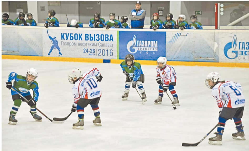
Жаркие баталии юных хоккеистов

5-7 мая на ледовой арене спортивно-концертного комплекса «Салават» состоялся традиционный хоккейный турнир, посвященный Дню Победы в Великой Отечественной войне – Кубок Победы. В этом году в Салават в гости к воспитанникам компании «Агидель-Спутник» – двум командам «Юрматы-СКА» – приехали хоккеисты «Орлана» из Стерлитамака, «Тороса» из Нефтекамска, «Красной Звезды» из Краснокамска и «Сарматов» из Оренбурга.