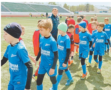
Юные «зенитовцы» сыграют в финале

13-14 мая на стадионе им. 50-летия Октября в Салавате состоялся предварительный этап Первенства Республики Башкортостан по футболу, зоны «Юг».