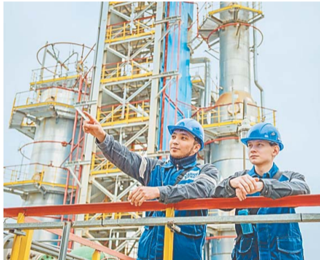
Свой первый юбилей коллектив встречает с рабочим настроем двигаться дальше

прямогонный бензин, фракции керосина, дизельного топлива, газойля вакуумного, газойля вакуумного тяжелого, полугудрона. Нефтепродукты, полученные на данной установке, являются сырьем для множества объектов вторичной переработки и получения товарных продуктов.