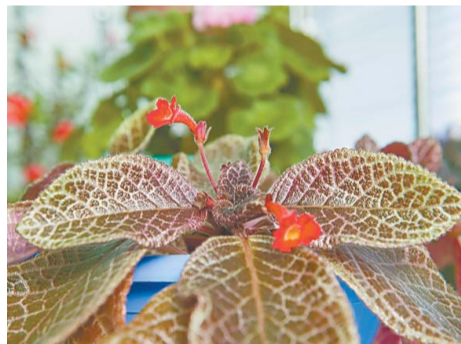
Эписция – цветок удивительный

Напоминаем, что корпоративный конкурс «Цветик-кабинетик» продолжается. Он проводится в рамках экологического проекта «Ты+Я=Земля». Ждем ваших рассказов о своих зеленых любимцах: как появились, чем нравится растение и как за ним нужно ухаживать. А может у вас есть своя удивительная, запоминающаяся или смешная история, связанная с цветами? Присылайте рассказы по адресу 02sas@sno.ru