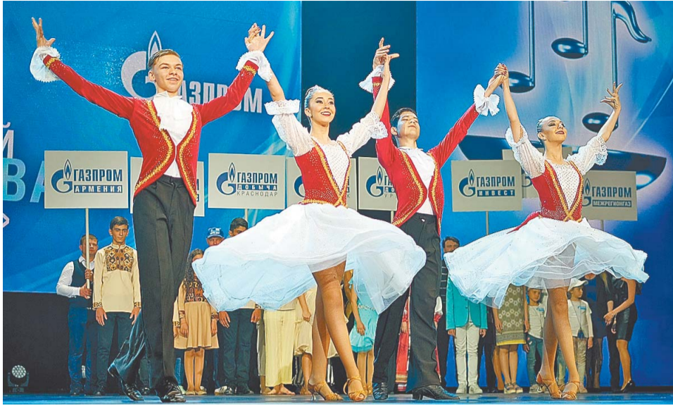
Ансамбль «Улыбка» показал на сочинской сцене композицию «Волиевный бал»