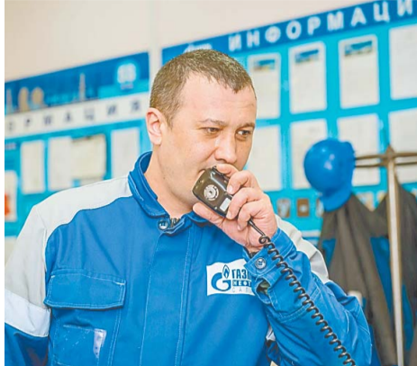
Сегодня в круглосуточном режиме установку обслуживает коллектив из 57 человек

Новая установка дает много плюсов – от ее оснащения автоматизированной системой управления до увеличения отбора сырья. Без преувеличения одна из самых важных установок завода успешно функционирует свою пятилетку. ЭЛОУ АВТ-6 предназначена для обессоливания и перегонки 6 000 000 тонн/год Западно-Сибирской нефти по топливной схеме. Здесь получают важную продукцию в системе нефтеперерабатывающего завода: