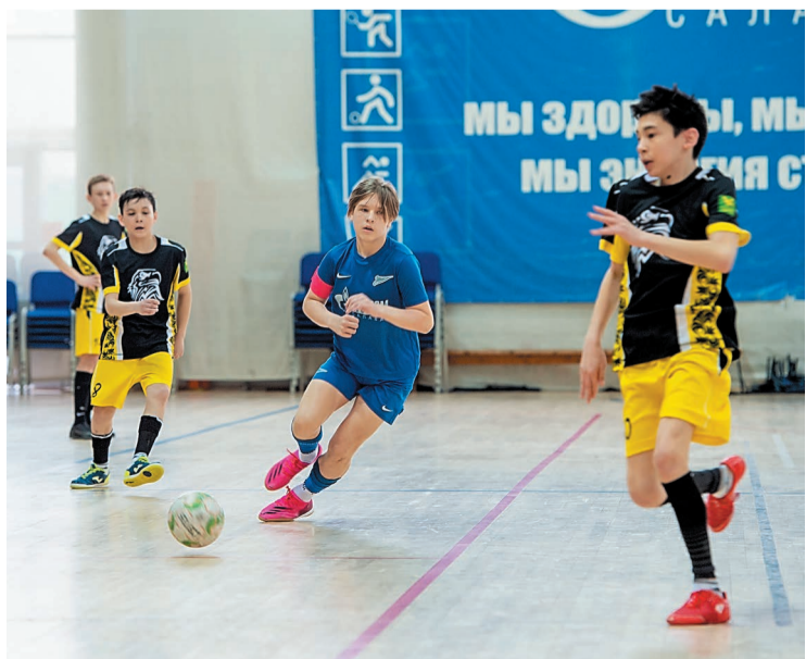
Футболисты «Зенита-2008» играют наравне со старшими ребятами

Игры первенства республики начались еще зимой, всего в турнире принимали участие более 30 команд со всей республики. 10 лучших собрались в Салавате для того, чтобы сыграть в финальном этапе. С 30 марта по 2 апреля во Дворце спорта «Нефтехимик» за звание победителей боролись футболисты из Уфы, Стерлитамака, Кумертау и Салавата. Команда «Зенит-2007» провела турнир без поражения и по праву уверенно заняла 1 место.