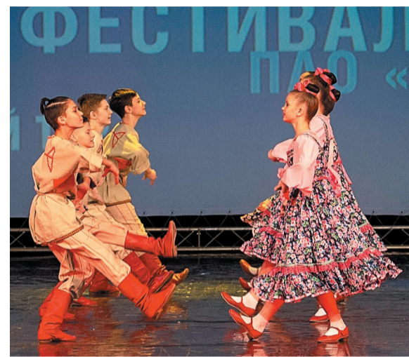
Коллективы Дворца культуры подготовили свои лучшие номера

Зональный тур корпоративного фестиваля «Факел» в этом году пройдет в Уфе, а компания «Газпром нефтехим Салават» получила право стать его главным организатором. В ноябре в ГКЗ «Башкортостан» выступят лучшие коллективы и исполнители из 20 дочерних обществ и организаций ПАО «Газпром».