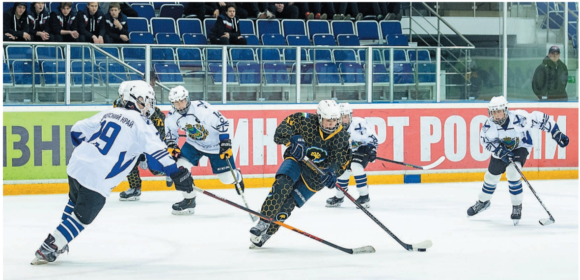
Игрок сборной Башкортостана против хоккеистов из Приморского края

Двое выходцев из салаватской хоккейной школы,