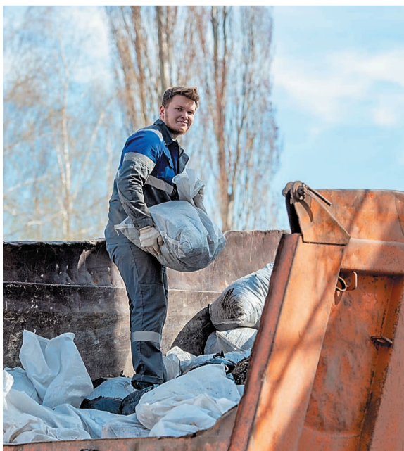
С городских улиц вывезли 8 грузовых КамАЗов мусора

За наведение чистоты и порядка взялись активно и с воодушевлением. Через несколько часов прикрепленные участки были убраны от мусора и прошлогодней листвы, очищены асфальтовые дороги. Участникам выдавался необходимый инвентарь, была задействована крупная техника: 4 грузовых КамАЗа, 2 поливочные машины, 2 трактора с щетками, погрузчик.