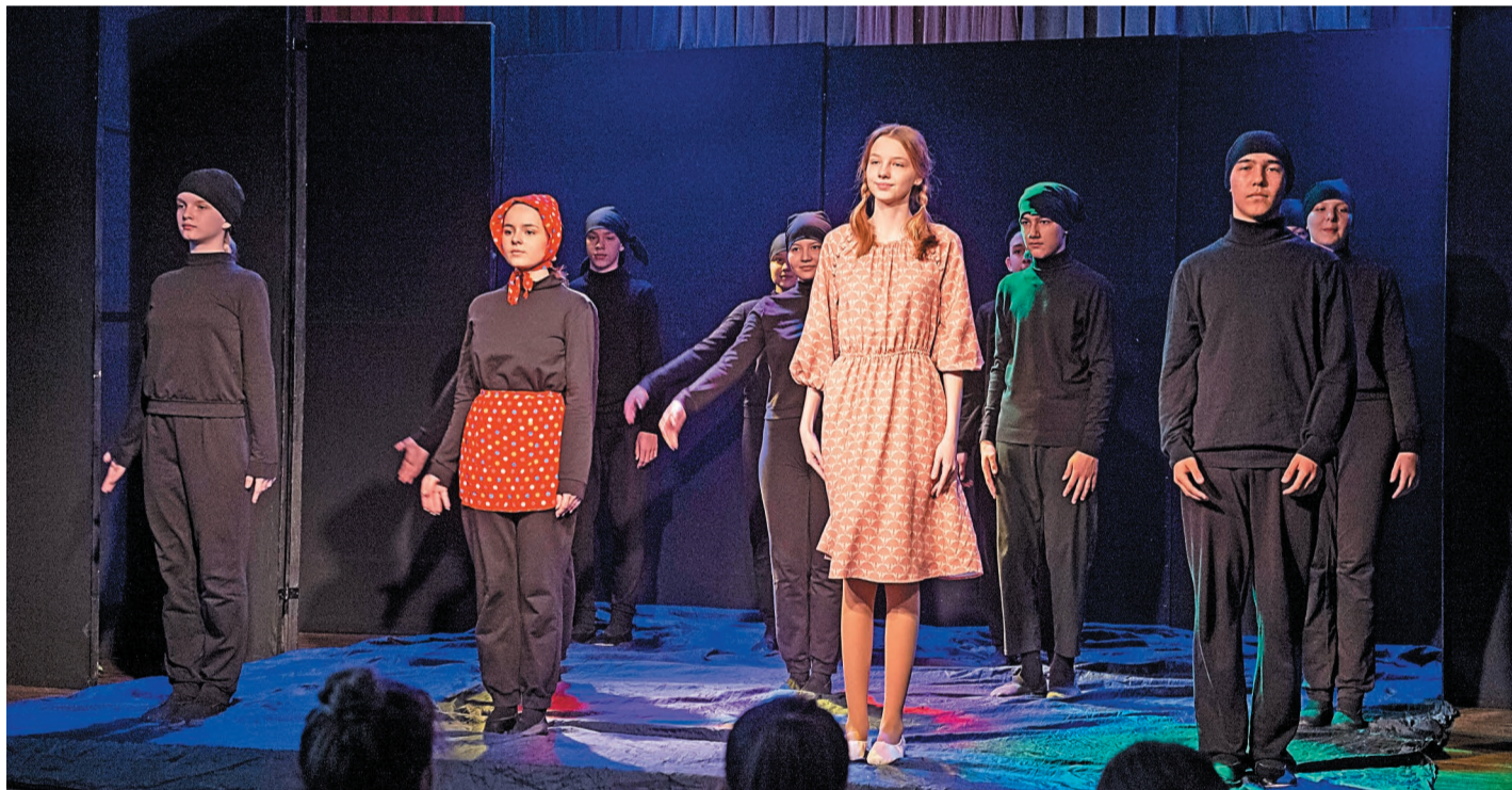
Учащиеся Лицея № 1 чувствуют себя на сцене уверенно

Затаив дыхание, учащиеся Лицея № 1 смотрели на игру своих сверстников – юных актеров студии театрального мастерства, которые приняли участие в театральной постановке «Алые паруса».