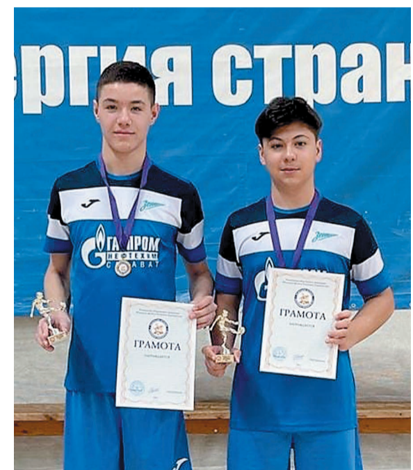
Награжденные: лучший бомбардир и лучший игрок турнира из команды «Зенит-2007»

— Мы играем с ребятами на год старше, и для нас это большой опыт — играть с теми, кто физически