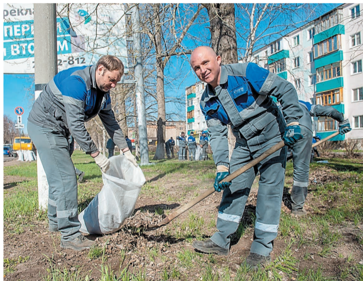
В солнечный день и работать веселее!

Для участников субботника было организовано питание. Общая работа по уборке и благоустройству родного города подарила положительные эмоции.