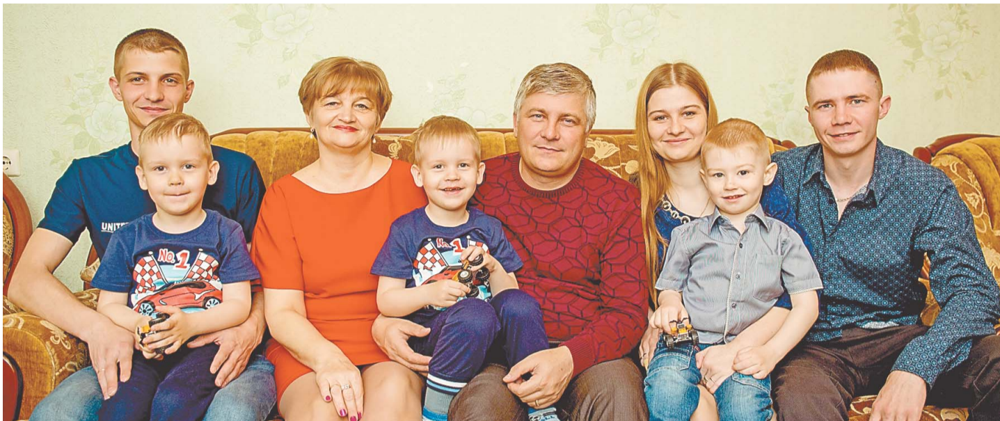
Большая семья в сборе