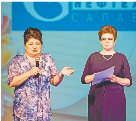
Слово – любимым классным руководителям