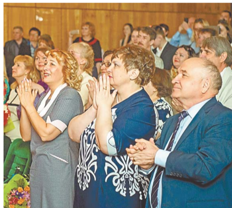
Даже педагоги были растроганы