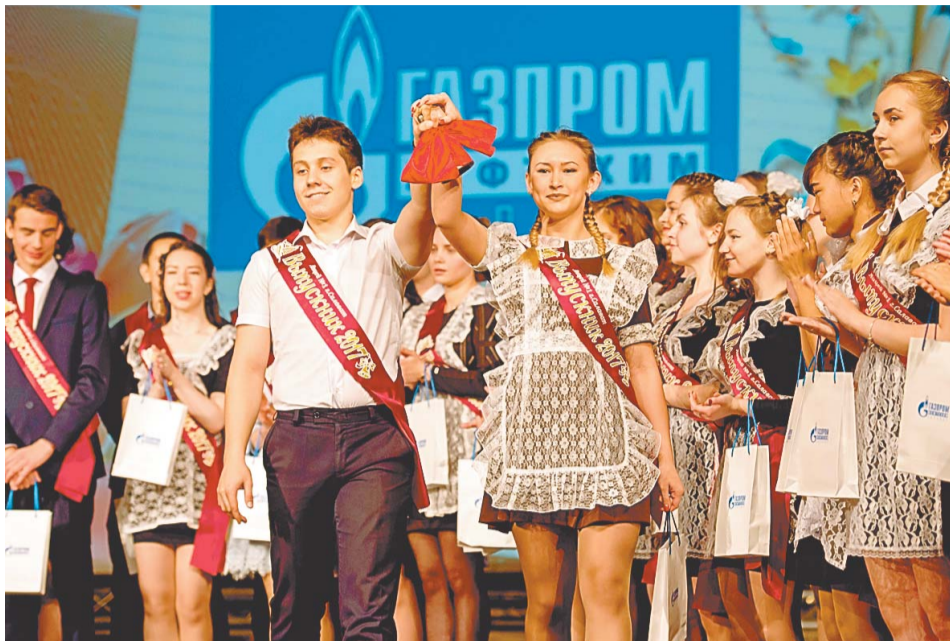
Для лицеистов звенит последний звонок

числе призеров республиканской олимпиады на Кубок имени Ю.А. Гагарина. И по праву Первый лицей входит в топ-500 лучших школ России.