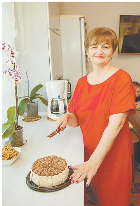
Главное в семье – уют и забота