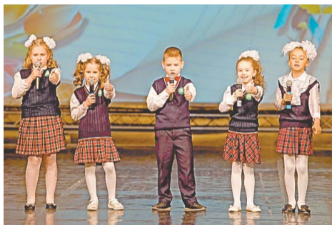
Выпускников поздравили первоклассники

Позади – годы учебы, впереди – экзамены и такой ответственный выбор жизненного пути, а последний звонок, как небольшая передышка, когда можно расслабиться, дать волю чувствам и сказать спасибо учителям.