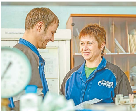
Хорошее настроение – залог успешной работы