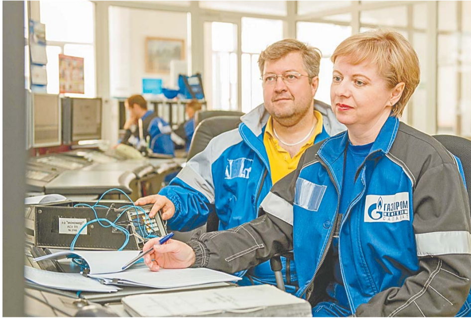
В тесной взаимосвязи с производством

– Парк приборов, действительно, очень огромный. В республике на сегодняшний день наше предприятие по количеству приборов стоит на втором месте после компании «Башнефть». Работаем мы строго по установленным графикам, поэтому все и успеваем. Помимо подразделений предприятия, мы также обслуживаем и все дочерние организации.