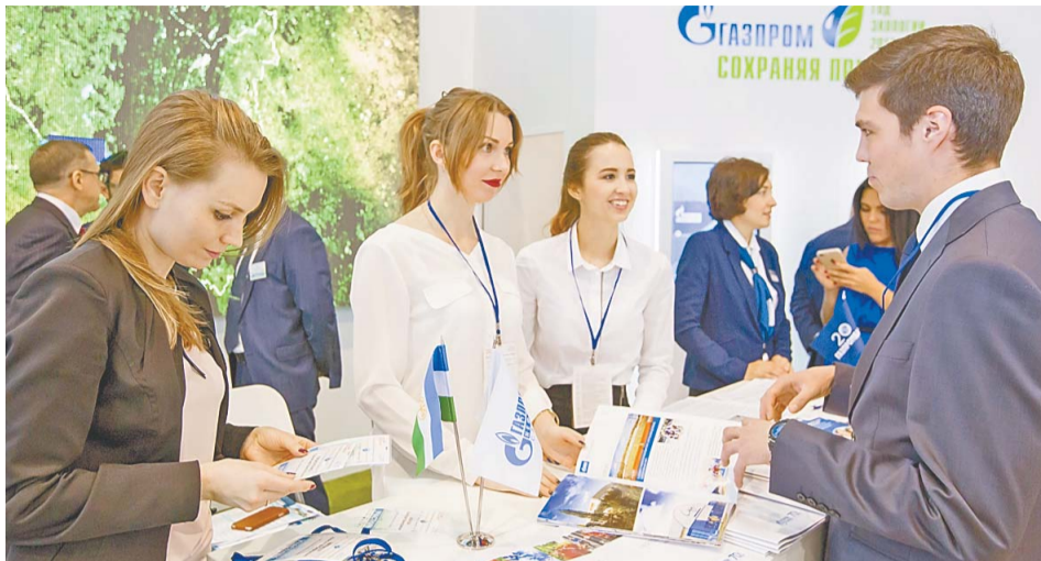
Экспозиция ООО «Газпром нефтехим Салават» вызвала интерес участников выставки

Наглядно на выставке ООО «Газпром нефтехим Салават» представило свой экологический эксперимент – тропическое растение эйхорнию. С прошлого года на очистных сооружениях проводится адаптация эйхорнии, которую планируется применять для доочистки сточных вод, поступающих с производственных объектов компании.