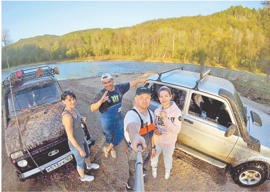
Семьями – на поиски приключений

– Это ни с чем не сравнимое ощущение – пробираться по очень труднодоступным местам на машине, наблюдать всю красоту нашей дикой природы, доказывать себе, что ты можешь достигнуть заветной цели любой поездки, – делится впечатле-