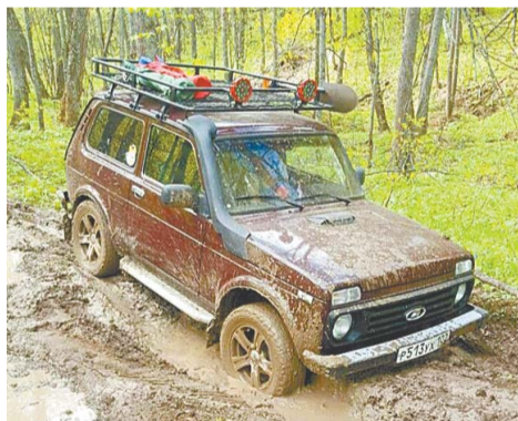
Автомобили экстремалов специально подготовлены к бездорожью