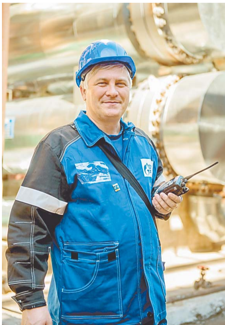
Комбинат стал вторым домом