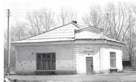
Продмаг № 19 по ул. Северная

Это было захолустное, с ветхими постройками и тяжелым ручным трудом советское хозяйство. Соседство оказалось обоюдно выгодным, то есть не только для строителей, но и для работников совхоза. Механизировали трудоемкие процессы