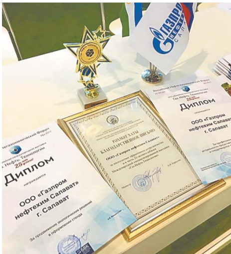
Одна из наград компании – диплом за продвижение экологических решений в оформлении стенда