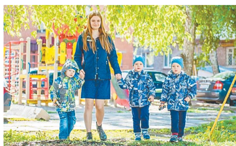
Надежда на будущее