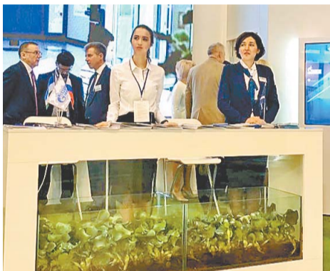
Эйхорния стала украшением стенда ООО «Газпром нефтехим Салават»