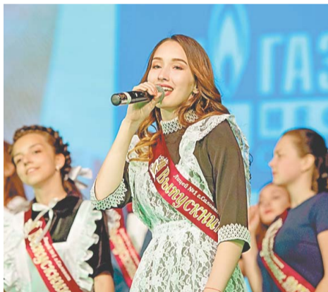
Песни посвящали учителям и родителям