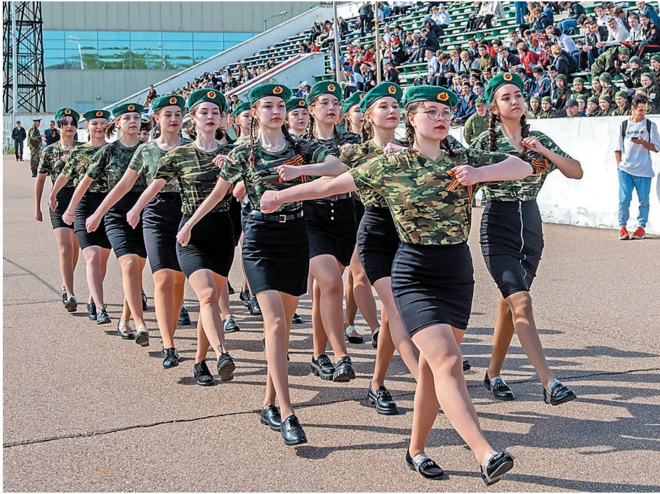
В этом году в тройку победителей вошли две женские команды

В 2009 году компания «Газпром нефтехим Салават» инициировала проведение смотра строя и песни. С тех пор военно-патриотическое мероприятие проводится регулярно на стадионе им. 50-летия Октября.