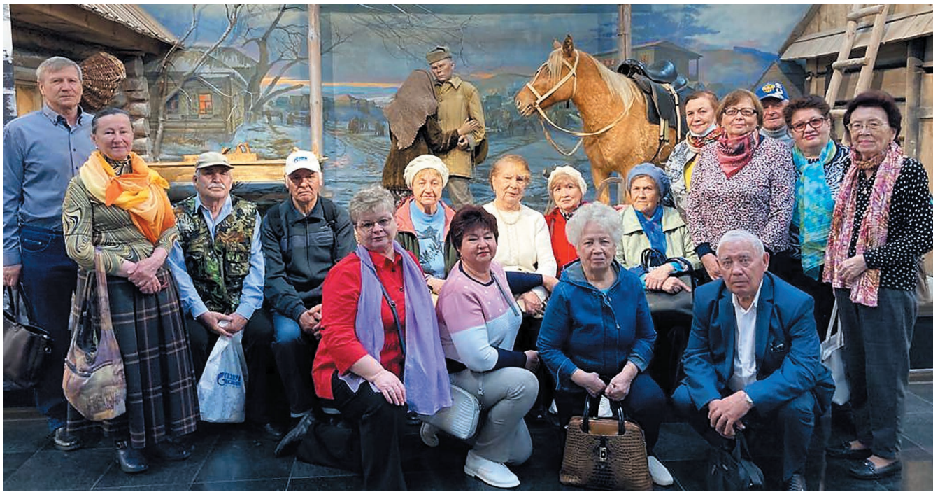
Во время экскурсии ветеранов-нефтехимиков в Уфу