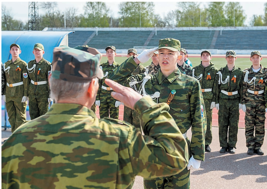
Каждый элемент смотра строго оценивался экспертами

— В этом году команды выступили очень достойно. Видна усиленная работа преподавателей-организаторов ОБЖ, которые на протяжении учебного года готовили ребят. Качество выполнения показательных выступлений растет с каждым разом. Мы отметили, что многие школы закупили единую форму, очень приятно смотреть на команды. Здорово, что своих учеников на трибунах поддерживали директора школ. Мероприятие удалось, мы получили массу положительных впечатлений. Ребята порадовали своей дисциплинированностью и чувством патриотизма. Спасибо компании «Газпром нефтехим Салават» за инициативу и содействие в проведении такого важного военно-патриотического праздника.