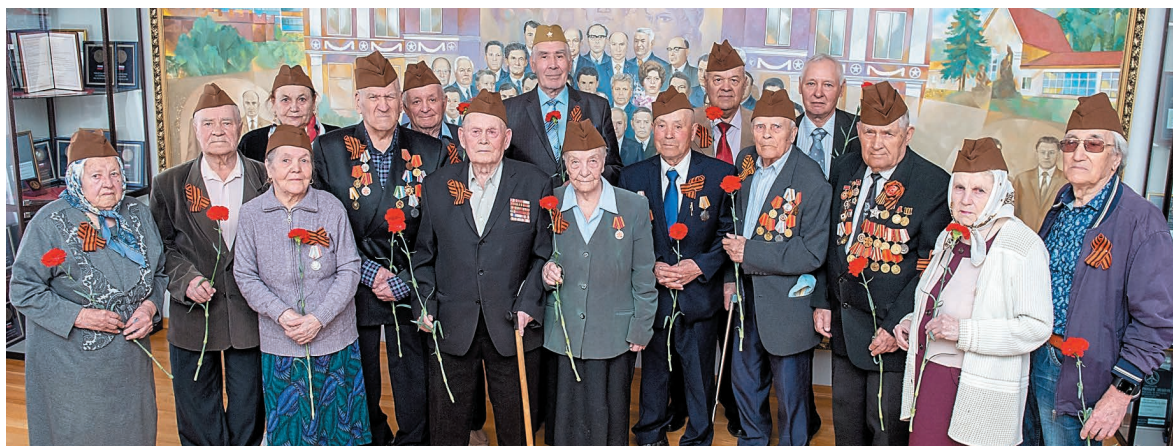
Среди приглашенных на встрече были участники ВОВ, труженики тыла и ветераны, приравненные к категории «дети войны»