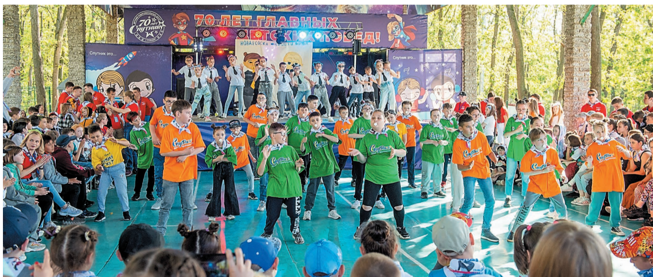
В первую смену в детском оздоровительном центре «Спутник» отдохнут 495 ребят

В детском оздоровительном центре шумно и весело открыли первую в 2022 году летнюю смену.