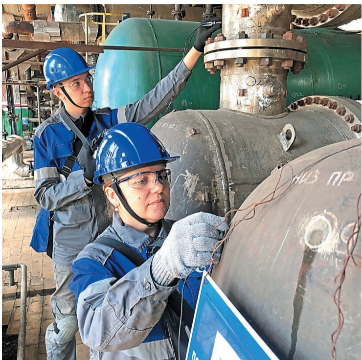
Чтобы все успеть, дефектоскописты начинают замеры задолго до начала ремонта

В рамках капремонта на производстве проведена работа по чистке, ревизии трубопроводов и аппаратов, ремонту действующего оборудования. Наряду с заводчанами и работниками подрядных организаций на площадке трудились сотрудники центра производственной диагностики и неразрушающего контроля Управления главного механика. Они проделали большую работу по контролю за насосно-компрессорным оборудованием, трубопроводами, аппаратами, выполнили радиографический, цветной, магнитный, ультразвуковой контроль – всего провели более 100 тысяч замеров.