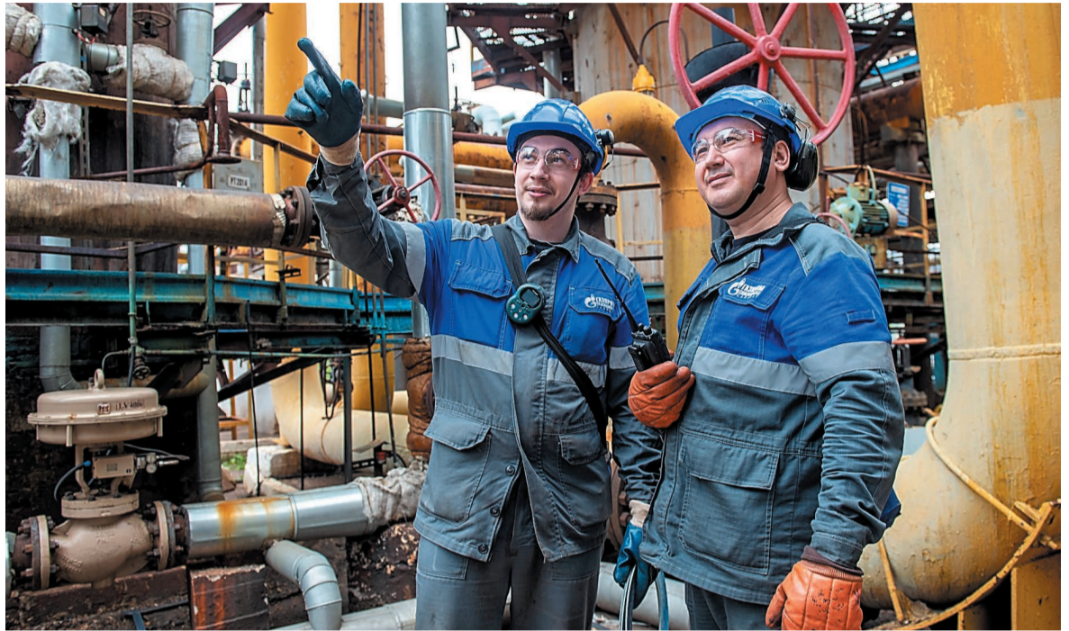
Установка риформинга – одна из самых сложных на производстве

– Молодые специалисты у нас есть, они стремятся, учатся, стараются. Здесь много всяких тонкостей,