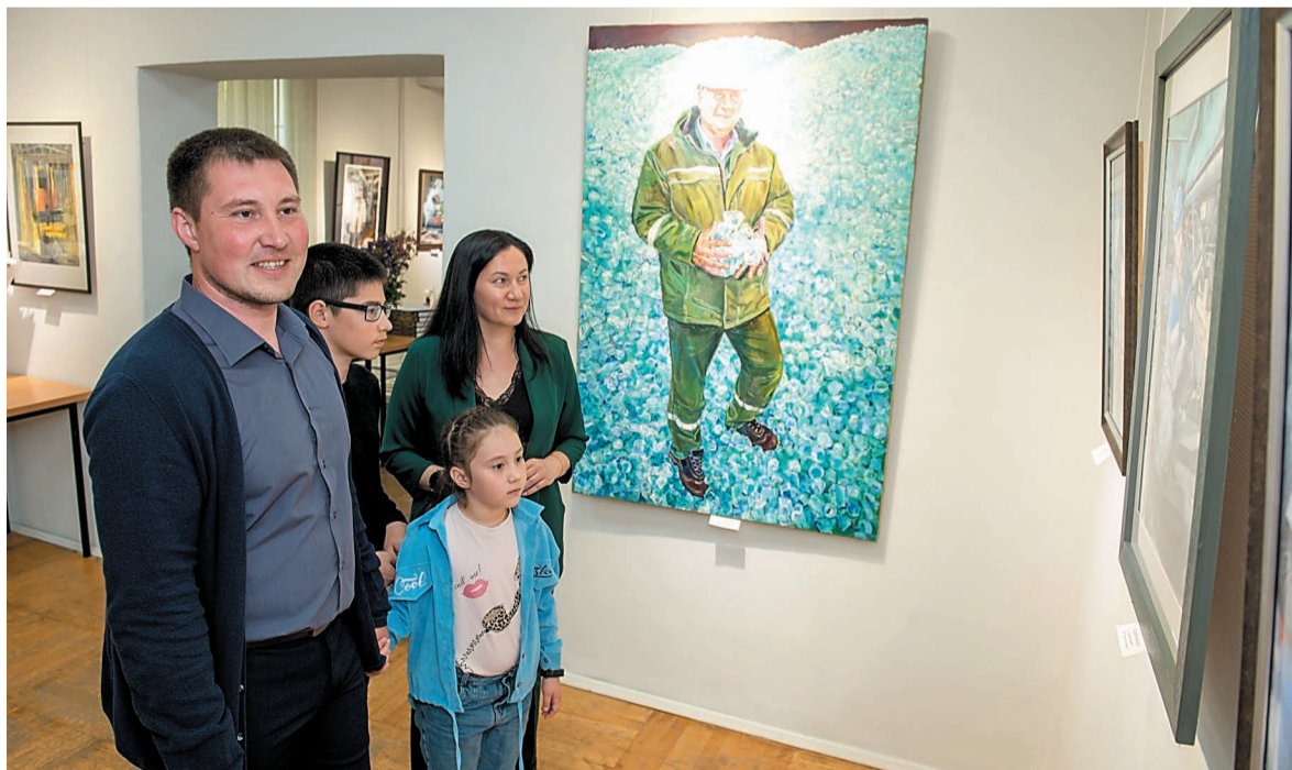
Познакомиться с работами художников можно до 30 июля

Организаторы выставки хотели заострить внимание на важности труда обычных людей, поднять