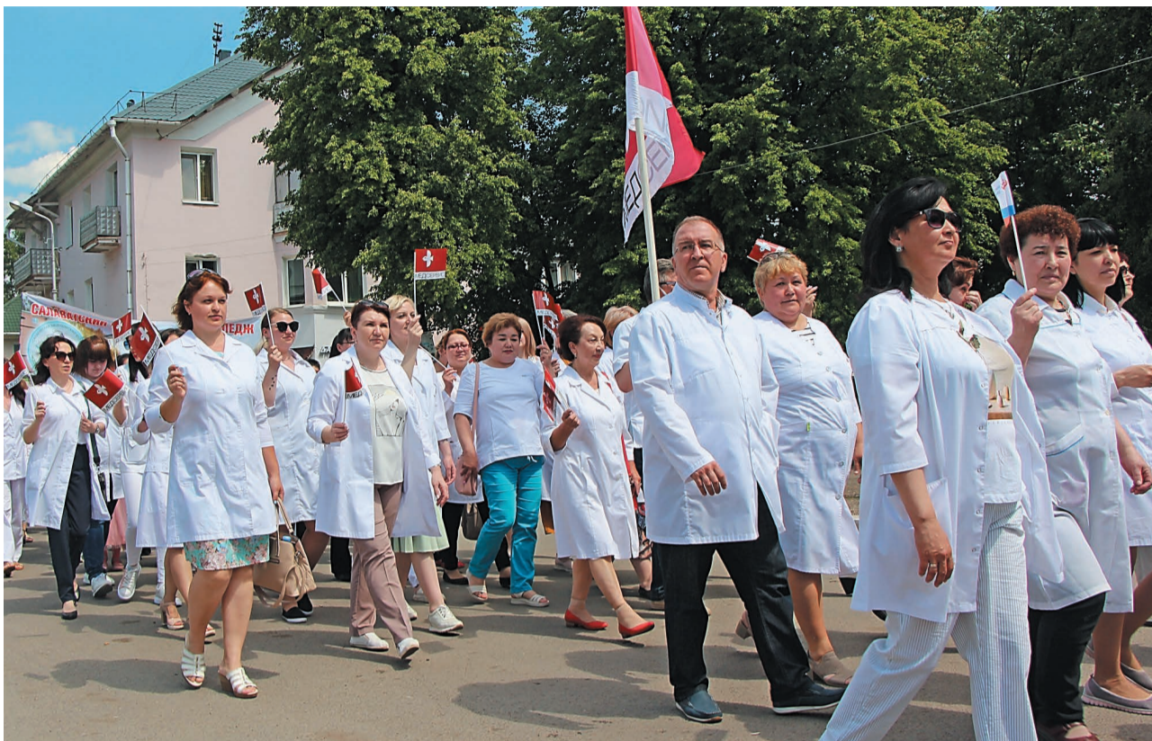
В параде медработников приняли участие более 400 человек

В ИЮНЕ РОССИЙСКОЕ ЗДРАВООХРАНЕНИЕ ПО МНОГОЛЕТНЕЙ ТРАДИЦИИ ОТМЕЧАЕТ ДЕНЬ МЕДИЦИНСКОГО РАБОТНИКА