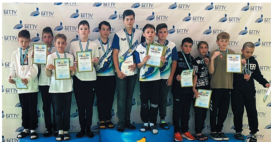
У салаватских пловцов первенство в Уфе было первым крупным соревнованием