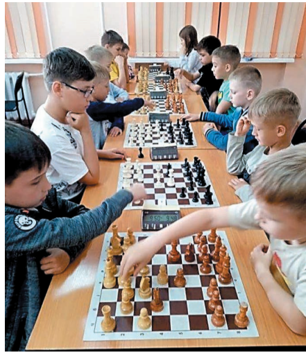
Три часа продолжались шахматные баталии