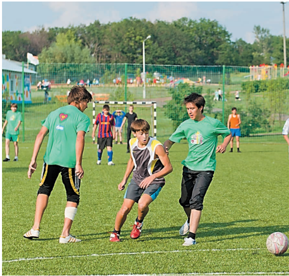
Настоящий футбол стал возможен благодаря профессиональному игровому полю