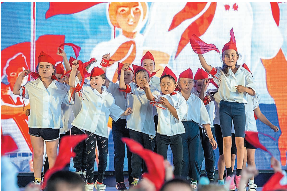
Яркое открытие третьей, юбилейной смены