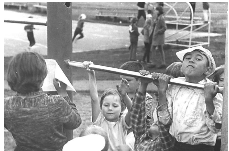
Сдача спортивных нормативов. 1980 год

За все время существования в «Спутнике» отдохнуло около 180 тысяч детей