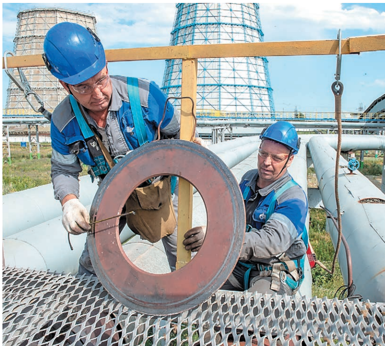
Теплоэнергетики ведут ремонт трубопроводов отопительной воды

Подготовку к очередному осенне-зимнему периоду сотрудники Управления главного энергетика Общества начинают сразу по окончании отопительного сезона. После анализа состояния объектов приступают к профилактическим и ремонтным работам. Основной их объем приходится на летний период.