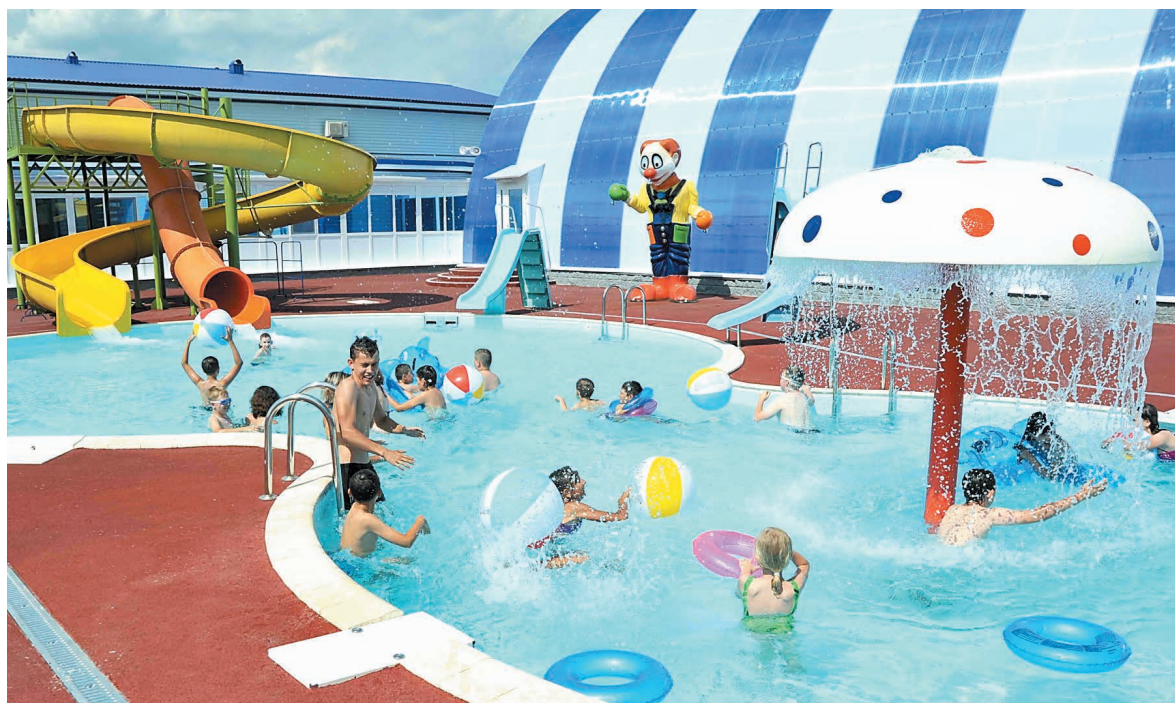
Бассейн с частицей аквапарка – самое любимое место всех спутниковцев

Более 2000 детей побывают этим летом в «Спутнике»