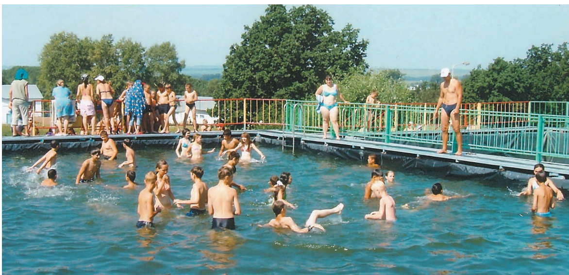
Плавательный бассейн. 2007 год

За все время существования в «Спутнике» отдохнуло около 180 тысяч детей