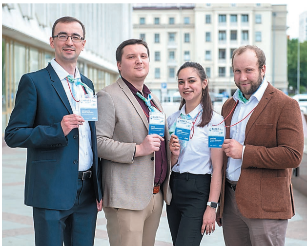
Более 60 сотрудников Общества пожелали стать кураторами на фестивале «Факел»

В начале ноября в Уфе пройдет зональный тур (северная зона) IX корпоративного фестиваля «Факел». В столицу Башкортостана съедутся представители 17 дочерних обществ и организаций. Принимать участников фестиваля впервые будет ООО «Газпром нефтехим Салават». В компании ведется активная подготовка.