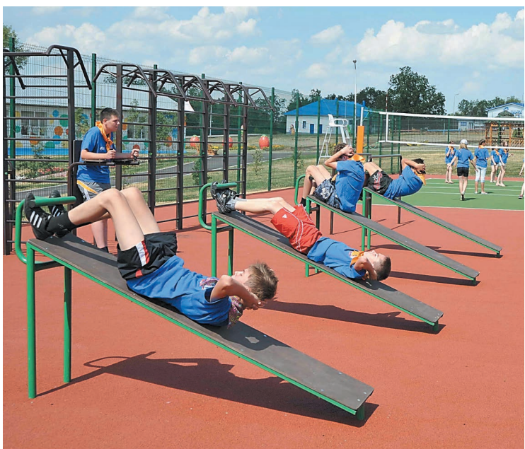
Современные тренажеры притягательны для занятий спортом