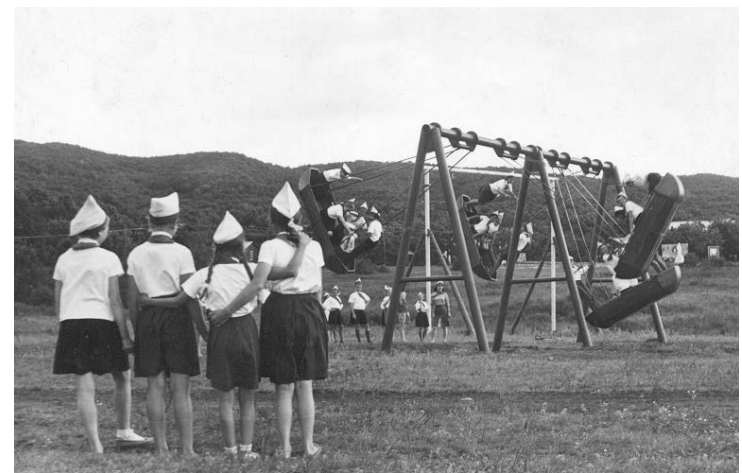
Знаменитые качели «Лодочки»