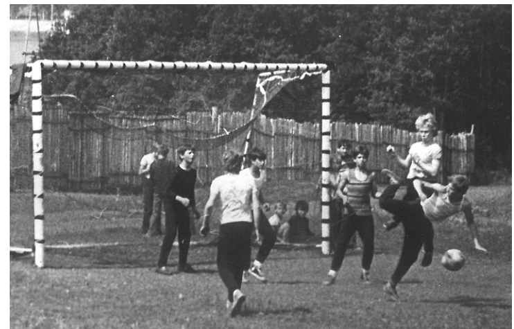
Футбольное поле в 1980 году

– Я отдыхала в «Спутнике» впервые в 2009 году, еще до его обновления. Жили по десять человек в одной комнате, было весело. Мы очень сдружились, следующие годы старались приезжать тем же составом. Смена пролетала на одном дыхании. Помнится, ходили строем на экскурсию в заброшенный лагерь им. Гагарина по соседству. С вожатыми и воспитателем выходили за территорию, чтобы искупаться в речке. И конечно, самым любимым развлечением на территории лагеря были легендарные лодочки. Эти качели помнят все, кто отдыхал здесь.