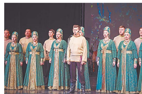
Артисты Уральского хора выходили на бис трижды