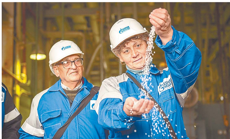
Ветераны оценивают качество продукции

– Я с 1972 года на комбинате, начинал в цехе № 47 по выпуску полистирола, а потом 18 лет отработал в цехе № 42. На пенсию уходить было грустно. Помню, в последний рабочий день спускался по лестнице – даже слезы на глаза навернулись. Не ожидал такого от себя. А сегодня я очень рад! Хочу пожелать работникам, чтоб они глубже изучали технологический процесс, умели его контролировать, в совершенстве знали работу и устройство оборудования и, конечно, трудовых успехов и безаварийной работы!