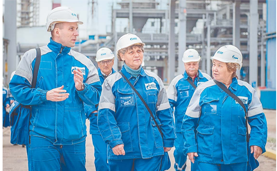
Экскурсия по производству полиэтилена высокой плотности