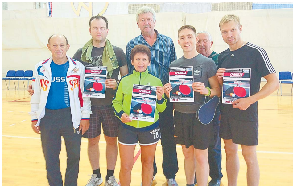
Спартакиада объединяет людей, для которых физкультура и спорт – неотъемлемая часть жизни

Во Дворце спорта «Нефтехимик» в рамках X Комплексной спартакиады – 2017 состоялся турнир по настольному теннису. Никто не ожидал, что лидирующая в прошедших состязаниях команда «Управление» по итогам турнира растеряет свое преимущество и позволит команде завода «Мономер» опередить себя.