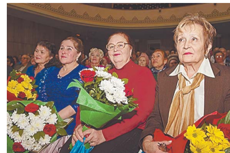
В честь Дня пожилых людей наградили 40 ветеранов