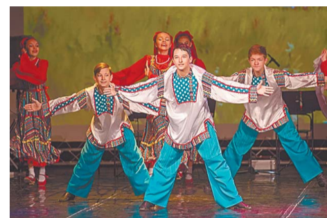
«Деревенский переполох» от детского хореографического ансамбля «Родничок»