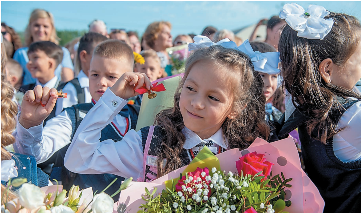
Первоклассники получили памятные сувениры

В Первом лицее в этом году школьный звонок впервые прозвенел для 150 первоклассников.