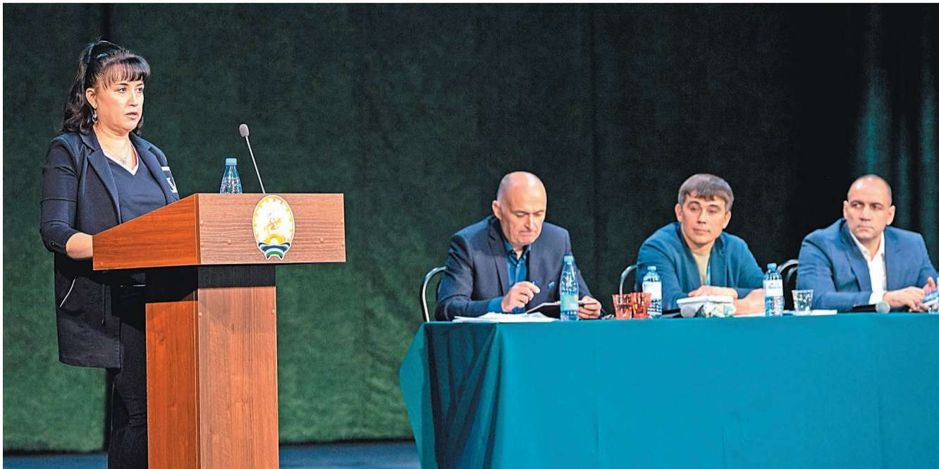
Новый состав профсоюзного актива определен на ближайшие пять лет