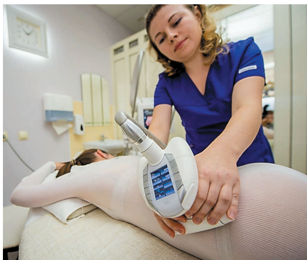
LPG-массаж эффективно борется с лишними жировыми отложениями

Стоит отметить важность для застрахованных лиц своевременного обновления личных данных, в том числе контактных (телефона и электронной почты), представленных страховой медицинской организации при оформлении полиса.