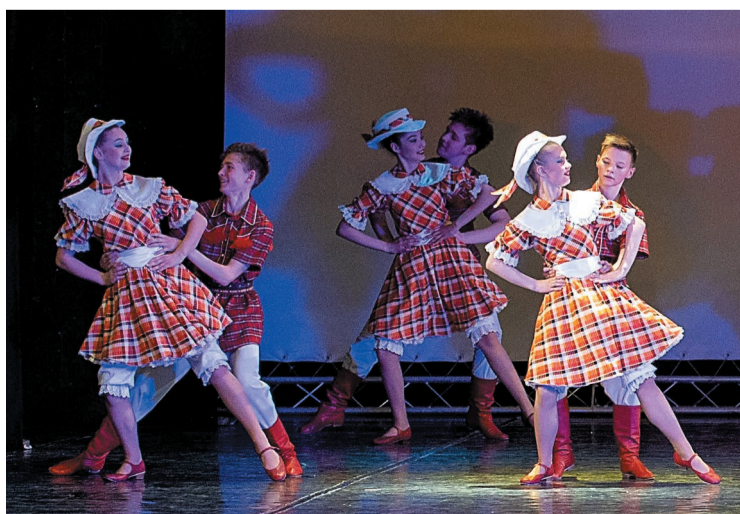
За 60 лет через «Родничок» прошло почти 12 тысяч салаватских детей

кто привержен к сохранению народного танца. Если не мы, кто сохранит культуру народностей?