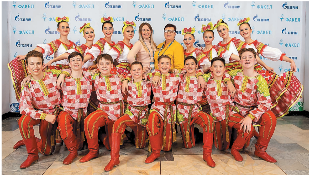
В 1989 году ансамбль «Родничок» получил звание «образцовый». С того времени он подтверждает это звание