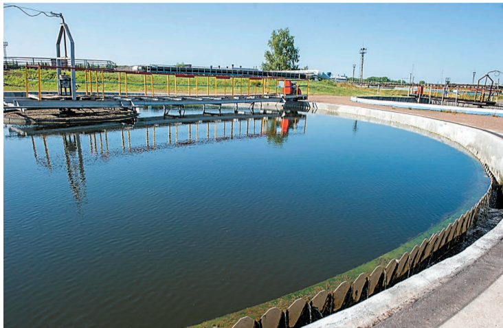
В настоящий момент на очистных сооружениях ведется реконструкция с целью приведения в соответствие современным требованиям

Для успешного прохождения процедуры в ООО «ПромВодоКанал» была проведена большая работа, начавшаяся еще в пандемийные времена – в конце 2020 года. В частности, в план на 2021 год была включена инвентаризация выбросов и сбросов.