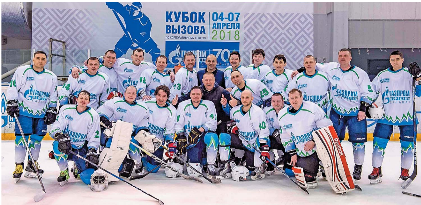
Команда «Газпром нефтехим Салават» заняла III место

По итогам игр команда ООО «Газпром нефтехим Салават», двукратный победитель Кубка вызова, заняла третье место. В матче против ООО «Газпромнефть-Оренбург» команда наконец-то нашла свою игру, у салаватцев получалось все: и комбинационная игра, и грамотная игра