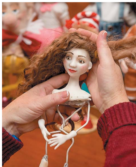
В умелых руках мастерицы заготовки на глазах превращаются в куклу

ляется в магазин за пластиком нужного оттенка, приобретает также волосы для своей будущей модели, кусочки ткани для наряда и толстую проволоку. Лепит из пластика голову, шею и плечи, особо тщательно занимается чертами лица, руками и ногами. Насаживает приготовленные части на спицы и устанавливает их на поддон в духовку на 15-20 минут при температуре 160 градусов. Остужает, раскрашивает лицо, приклеивает волосы и крепит части куклы на каркас-скелет из толстой проволоки. Затем