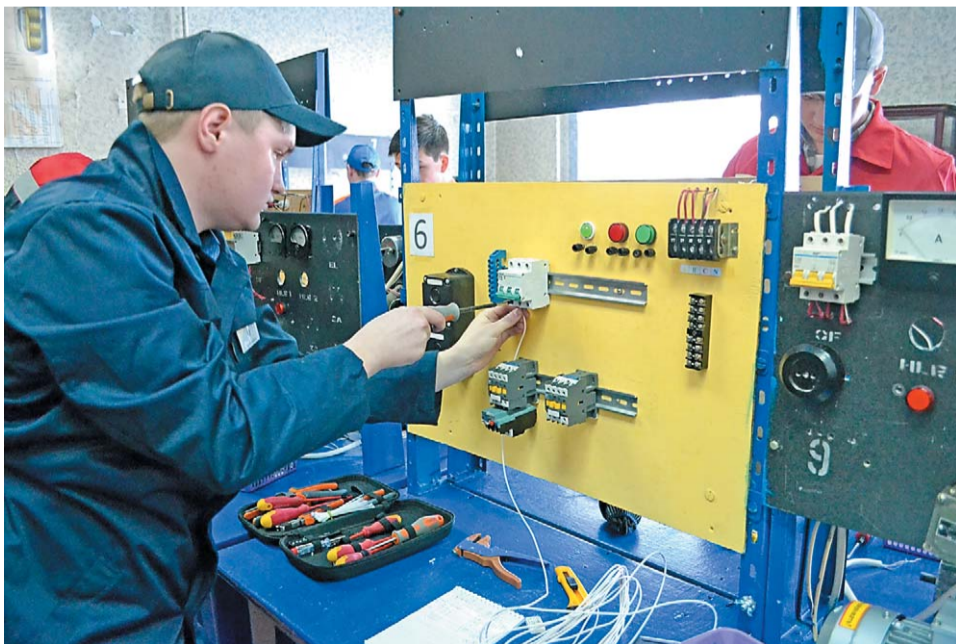
Конкурсное задание по разбору и сбору электрической схемы пуска реверсивного электродвигателя

На базе Салаватского индустриального колледжа состоялся региональный этап Всероссийской олимпиады профессионального мастерства по укрупненной группе специальностей электро- и теплоэнергетиков. На мероприятие съехались представители 13 учебных заведений РБ.