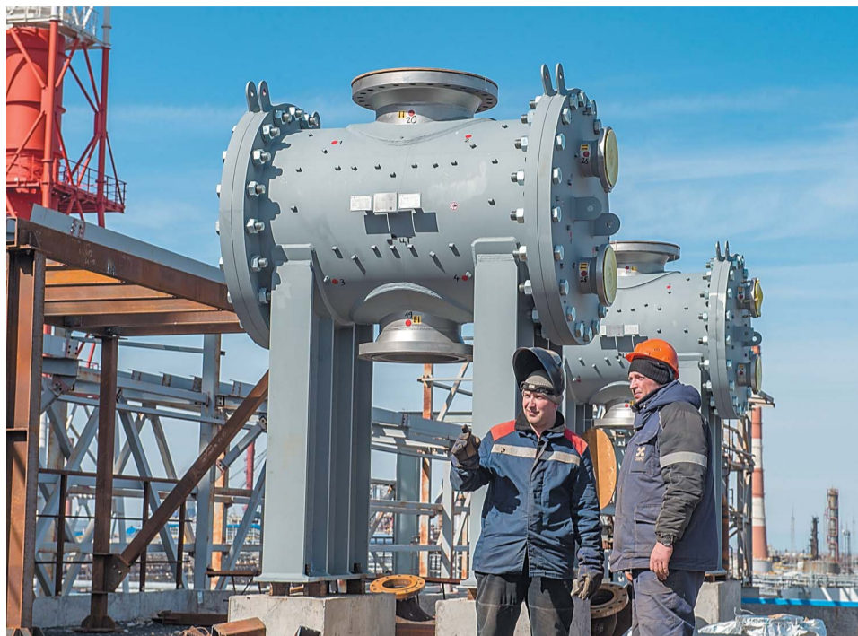
На линии верхнего продукта главной фракционирующей колонны К-1201 смонтированы водяные холодильники-конденсаторы. Оборудование предназначено для охлаждения и конденсации легкого углеводородного газа, паров бензиновой фракции и воды

На установке селективной гидроочистки бензинов (СГБ) в бойлерной произведен монтаж станции перекачки конденсата СПК-2031, расширителя конденсата