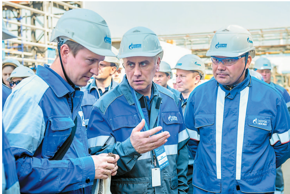
На площадке строящегося комплекса каталитического крекинга

2-4 июля на площадке ООО «Газпром нефтехим Салават» прошли мероприятия по обмену опытом между ПАО «Газпром» и ПАО «Газпром нефть» по повышению эффективности переработки углеводородного сырья.