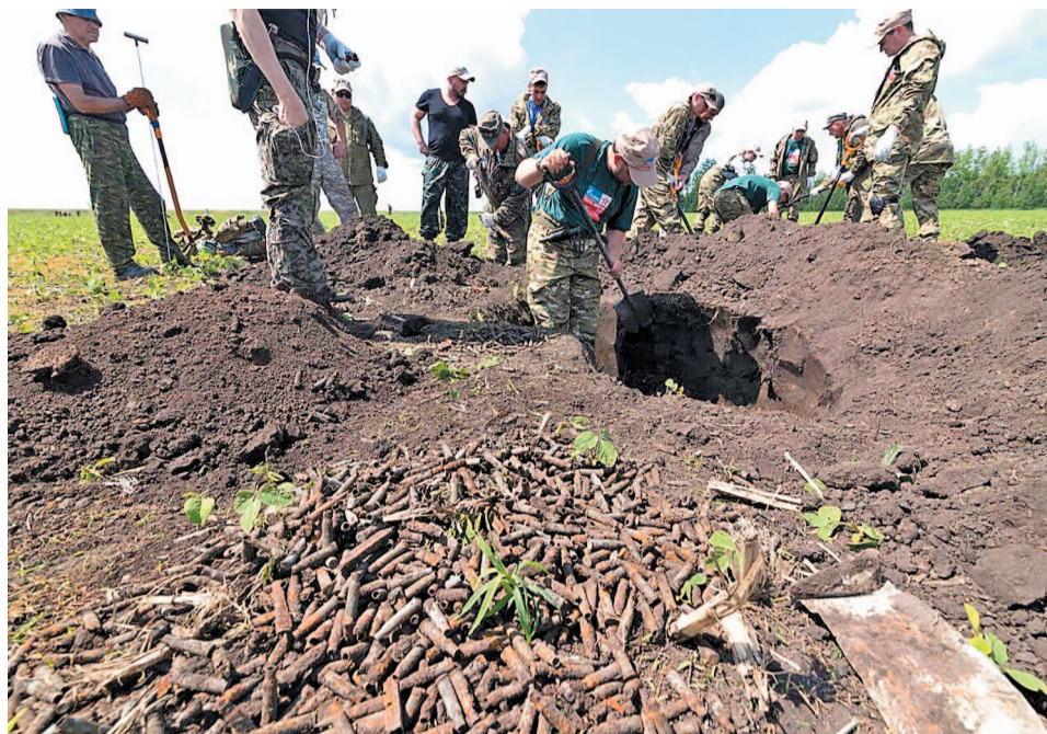
На раскопках объединили усилия 100 молодых сотрудников из нескольких стран

Центральное событие акции – официальная церемония перезахоронения