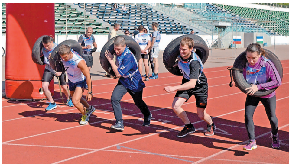
Организаторы подготовили для команд серьезные испытания – бег с колесом...

– С удовольствием принимаю участие в проекте «Герои нашей компании» уже не первый год. Этот проект, да и увлечение спортом в целом, – отличный способ вы-