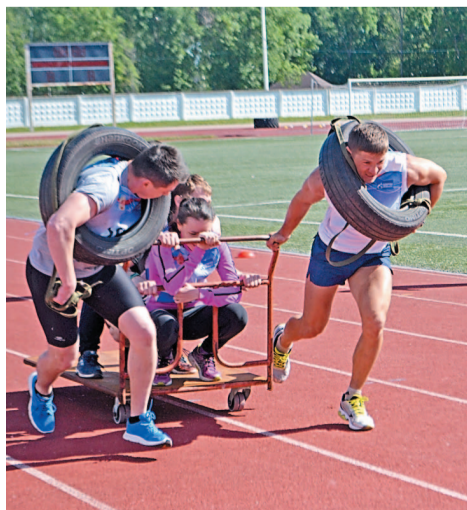
...соревнование с тележкой