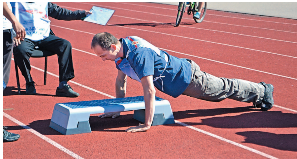
...и отжимания на время