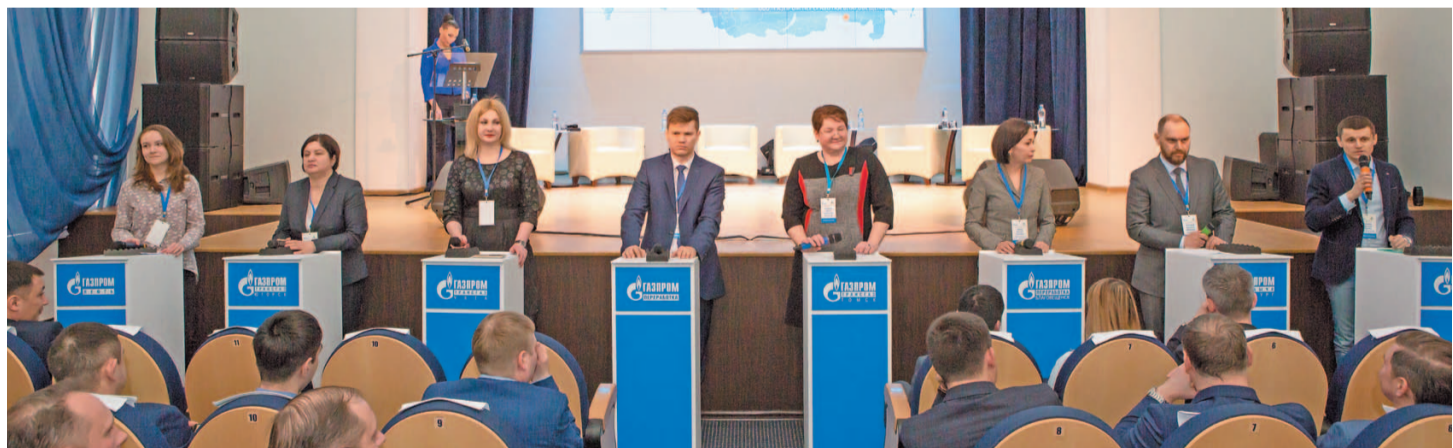
Специалисты кадровых служб компаний группы ПАО «Газпром» ответили на все вопросы студентов и выпускников вузов

В этом году компания «Газпром нефтехим Салават» участвовала в «Днях ПАО «Газпром» в Уфимском государственном нефтяном техническом университете, Российском государственном университете нефти и газа (НИУ) имени И.М. Губкина, Санкт-Петербургском Горном университете, Санкт-Петербургском государственном электротехническом университете им. В.И. Ульянова (Ленина) «ЛЭТИ», Национальном исследовательском Томском политехническом университете, Казанском