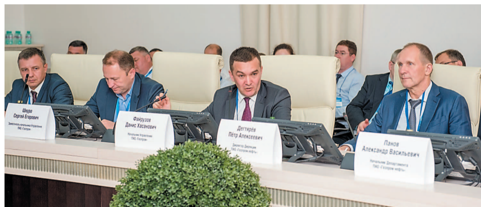
Вопросы текущей деятельности компаний и перспективные направления стали центральными темами совещаний