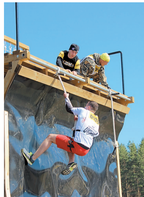
Рампа – последнее и самое сложное испытание