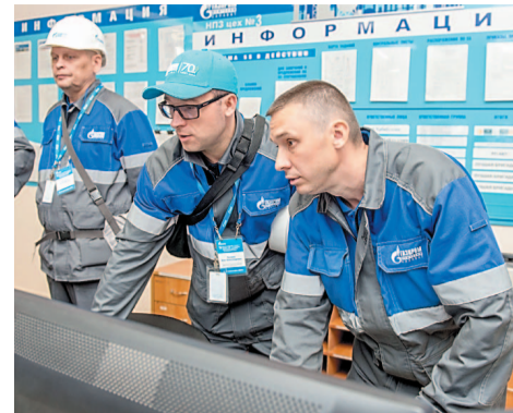
В операторной установок ЭЛОУ АВТ-6-визбрекинга

Одновременно в течение последних трех лет были реализованы мероприятия по повышению доходности. Из основных – оптимизация технологического процесса установки ЭЛОУ АВТ-6 за счет вовлечения в переработку атмосферного мазута с ЭЛОУ АВТ-4, изменение расходных норм потоков печей, оптимизация номенклатуры продукции. Плюс к доходной части дали налоговые вычеты по акцизам при переработке прямогонного бензина, направленного для производства продукции нефтехимии. Замена сырья – западносибирской нефти на нефть Царичанского месторождения сыграла свою положительную роль в увеличении выработки маржинальных продуктов. Благодаря грамотной работе