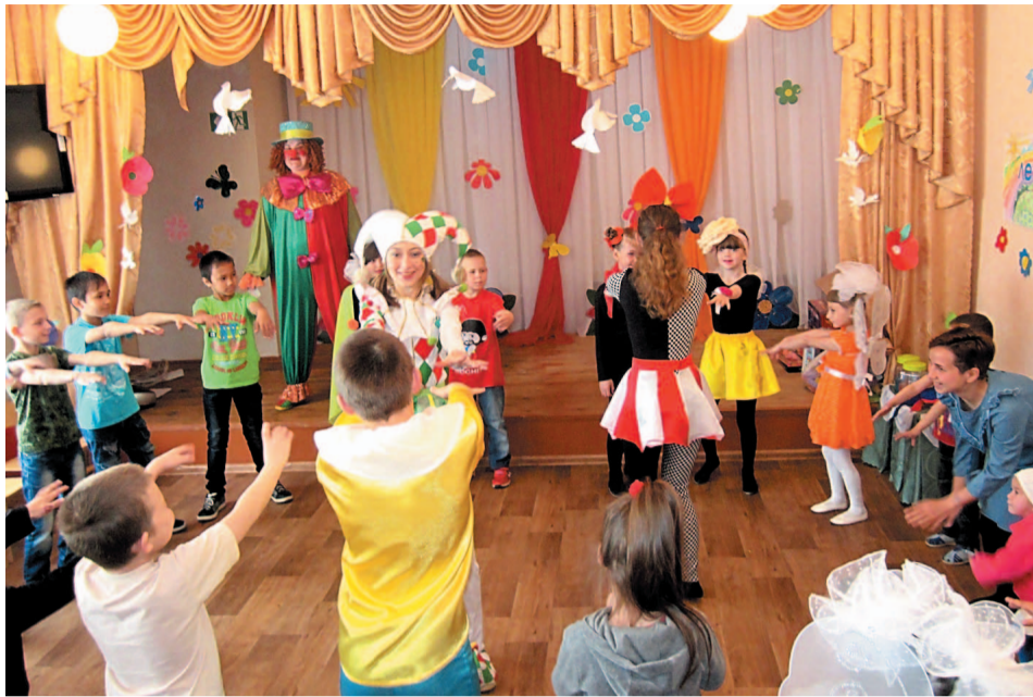
Театрализованное представление «Пигмалиона» от души развеселило ребят

– Многие люди не доверяют банковским перечислениям: неизвестно куда пойдут, на что будут потрачены, – делится Лиляна. – Поэтому мы покупаем именно то, что нужно детям, и участники акции видят, как были использованы их деньги.