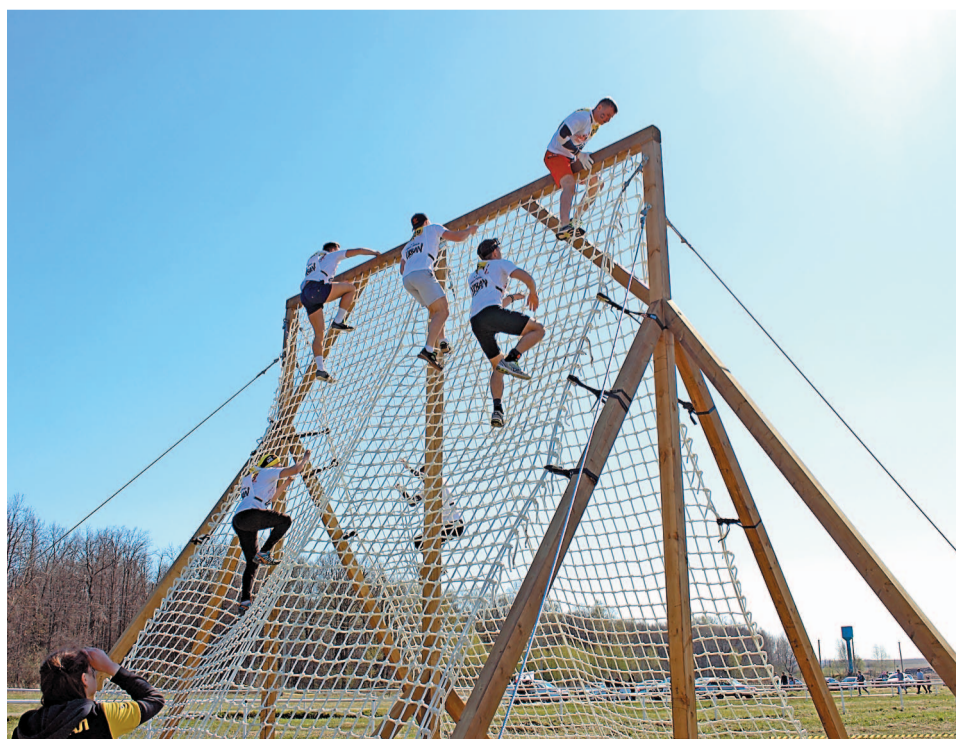
Переход по сетке – первое и самое легкое испытание