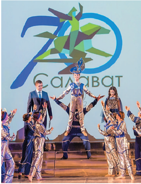
«Агидель», как всегда, зажигала всех своим оптимизмом