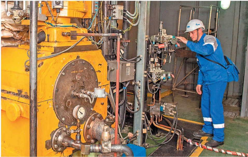
Эксплуатация высокотехнологичного оборудования на производстве ЭП-340 требует от его сотрудников глубокого знания процессов