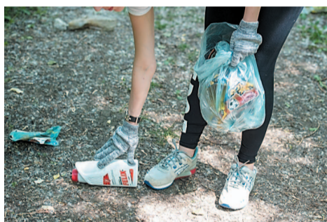
Бег со скоростью 3 мешка в час

Чтобы испытать новое движение на себе, достаточно взять на пробежку крепкий мусорный пакет и складывать в него найденный по дороге мусор. Так мы и поступили. Площадкой для эксперимента выбрали тропинку у «Магнита» в сторону