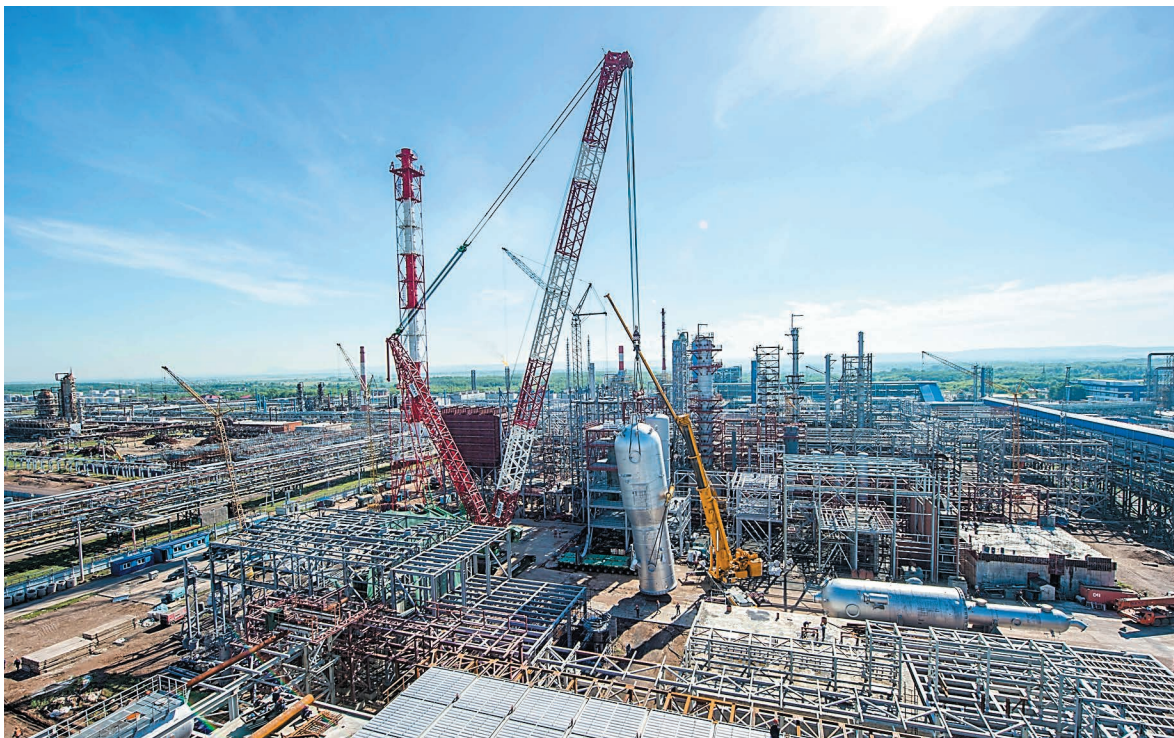
2016 год. Монтаж крупнотоннажного оборудования на комплексе каталитического крекинга — самой крупной стройке за последние 30 лет. Вес аппаратов реакторно-регенераторного блока составил более 600 тонн, а высота блока около 50 метров

Во второе воскресенье августа в нашей стране отмечается День строителя. Любопытно, что Указ Президиума Верховного Совета СССР «Об установлении ежегодного праздника Дня строителя» вышел 6 сентября 1955 года. И в том же году, в марте, впервые на нашем комбинате было создано управление капитального строительства (УКС). Это стало важным событием в организации службы капитального строительства. С тех пор строители обеспечивают рост фондов основных производственных мощностей, а значит, непосредственно способствуют развитию производства. Вся 75-летняя история побед и достижений компании «Газпром нефтехим Салават» — это история строителей и вводов в эксплуатацию важных промышленных объектов, объектов социально-бытовой сферы на территории комбината, а также в городе Салавате.