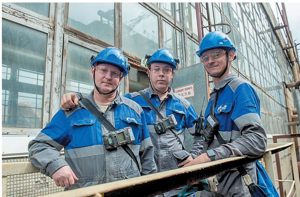
Работа коллектива цеха № 54 базируется на таких принципах, как профессионализм, четкость, новаторство. Это и формирует чувство локтя и взаимную поддержку