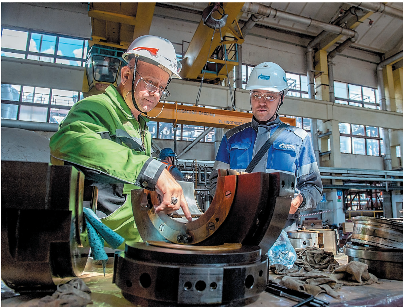
В цехе № 56 ведется техническое обслуживание компрессоров

В конце июля производства пиролиза и полимеров завода «Мономер» остановлены для проведения планового капитального ремонта. За этот период предстоит выполнить большой объем работ. Кроме обслуживающего персонала, на промплощадке ежедневно задействовано более 500 сотрудников подрядных организаций.