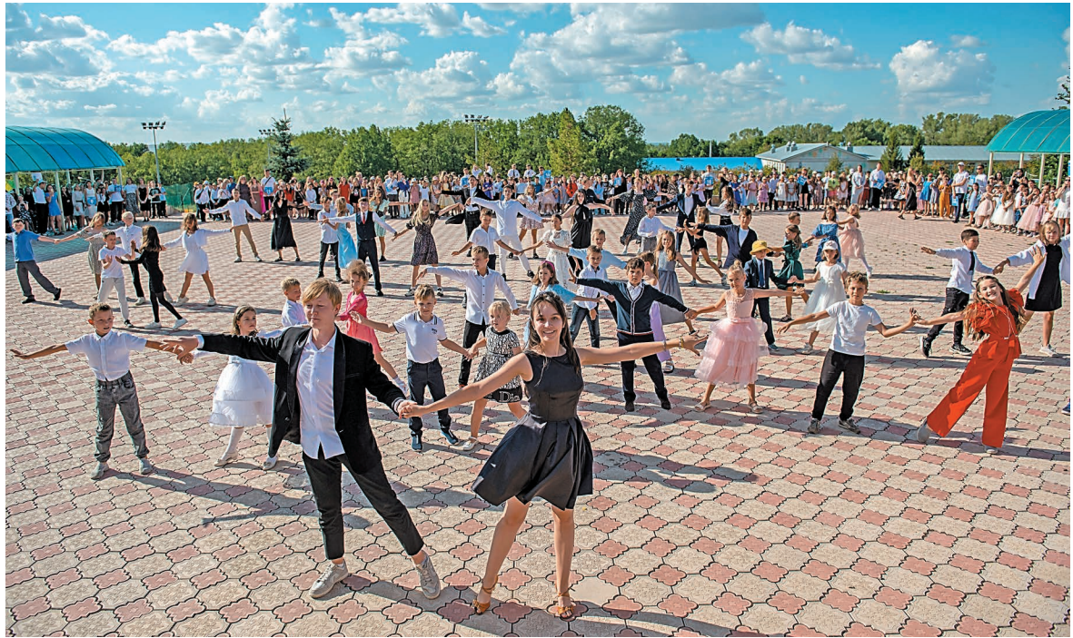
На празднике закрытия смены ребята исполнили элегантный танец

Закончилась смена ярко и феерично в стиле все-