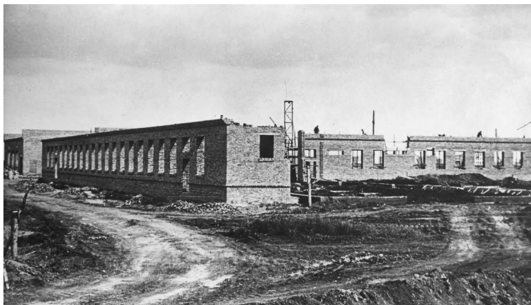
1958 год. Строительство объектов нефтехимии

На объектах мы ежедневно встречались с бригадами штукатуров. Удивлялась, как хрупкие девушки выполняли свою тяжелую работу. Своими худенькими руками они не только удерживали огромные, тяжелые шланги, по которым под большим давлением подавался раствор, но и очень ловко, умело штукатурили стены.