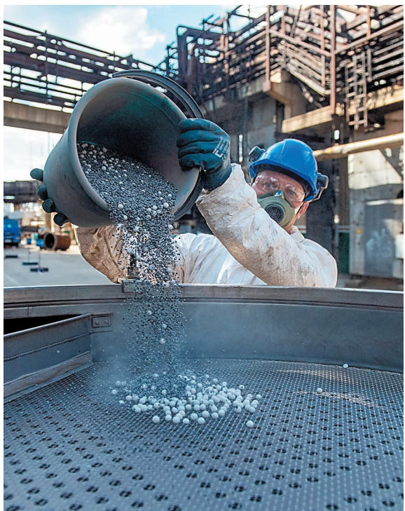
Перегрузка реакторов на производстве бензола