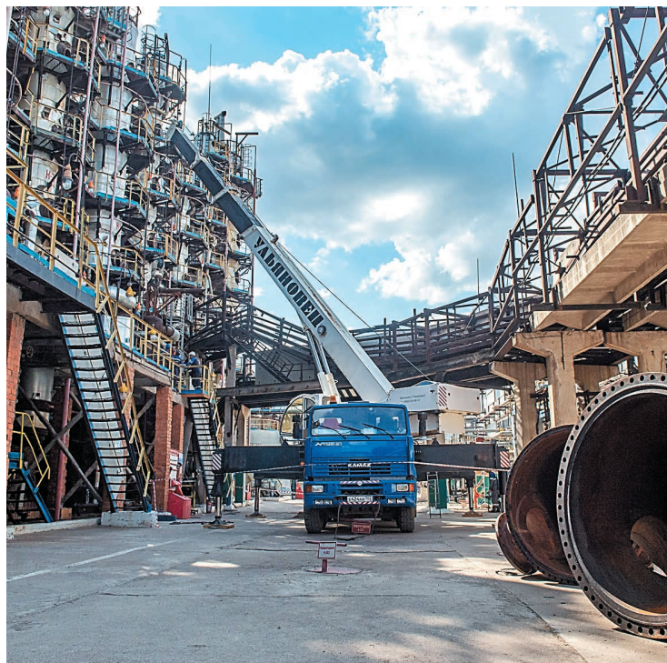
Ревизия оборудования в цехе № 58