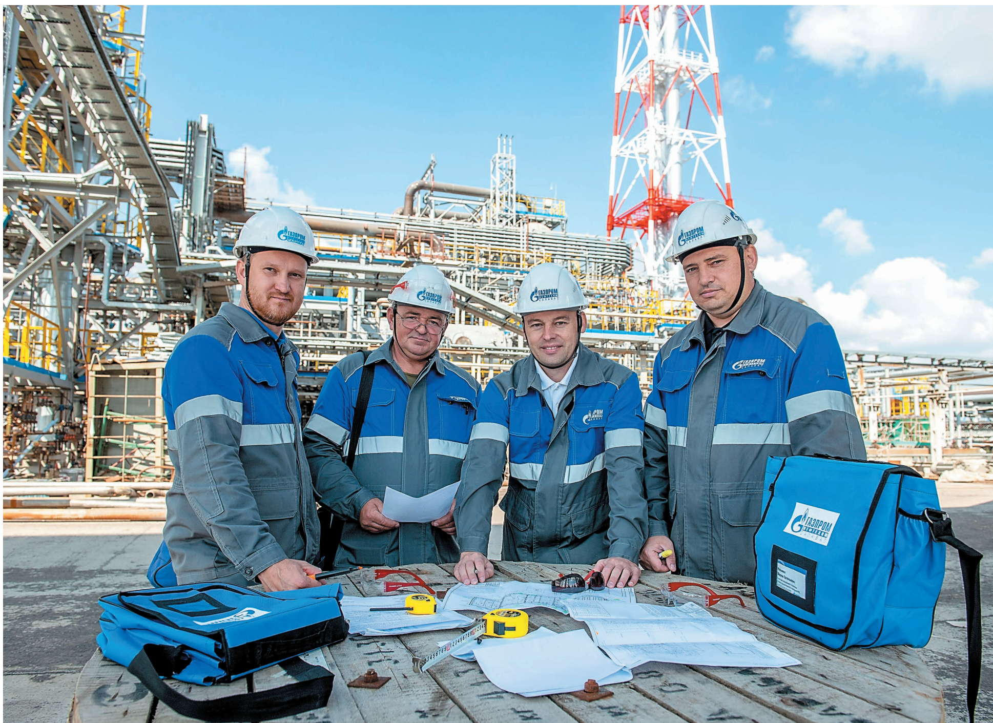
Специалисты Управления капитального строительства на площадке строительства производства технической серы

НАКАНУНЕ ДНЯ СТРОИТЕЛЯ РАССКАЗЫВАЕМ ОБ АКТУАЛЬНЫХ ВЫЗОВАХ, СТОЯЩИХ ПЕРЕД СПЕЦИАЛИСТАМИ КОМПАНИИ «ГАЗПРОМ НЕФТЕХИМ САЛАВАТ» ПРИ РЕАЛИЗАЦИИ ИНВЕСТИЦИОННЫХ ПРОЕКТОВ