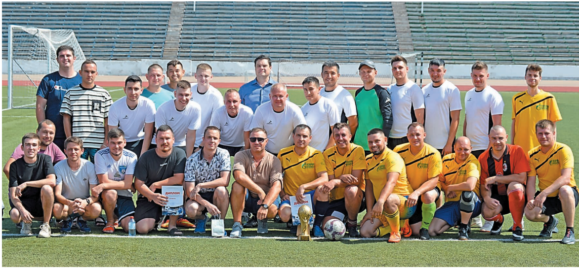
Корпоративный футбол объединяет сотрудников завода уже несколько лет

В компании прошло первенство по футболу среди цехов нефтеперерабатывающего завода. Соревнования организованы при поддержке ППО Газпром нефтехим Салават.