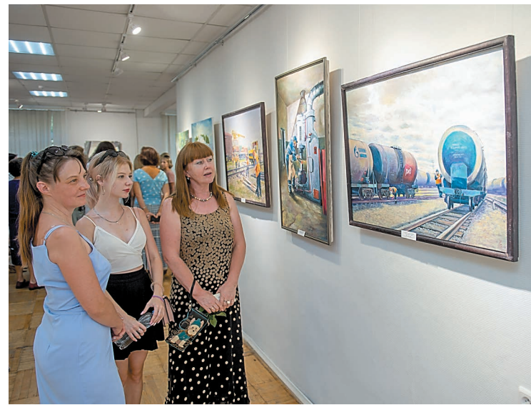
Одна из работ Радика Ишмухаметова «Маневровый район» ранее выставлялась в Третьяковской галерее

В Салаватской картинной галерее открылась выставка «Лики Салавата», приуроченная к юбилею города и градообразующего предприятия. На ней представлено более 150 работ, часть принадлежит авторству сотрудников нашей компании.