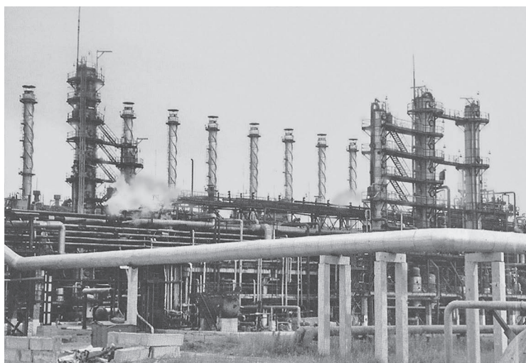
1978 год. Производство этилена и пропилена