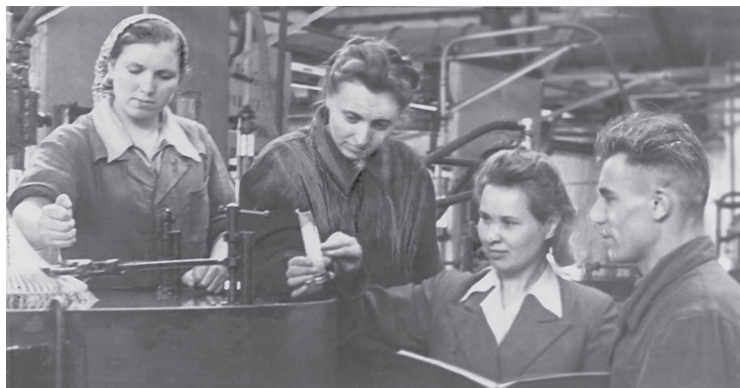
1955 год. Момент контроля режима узла формовки производства катализаторов