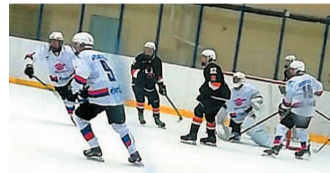
Игра «Юрматы-СКА» в Перми прошла на хорошем уровне

В Перми в рамках Юниорской хоккейной лиги России салаватские «Юрматы-СКА» провели две встречи с хозяевами площадки – командой «Молот». Для воспитанников компании «Агидель-Спутник» этот сезон дебютный, а потому любая игра – это еще один урок для хоккеистов.