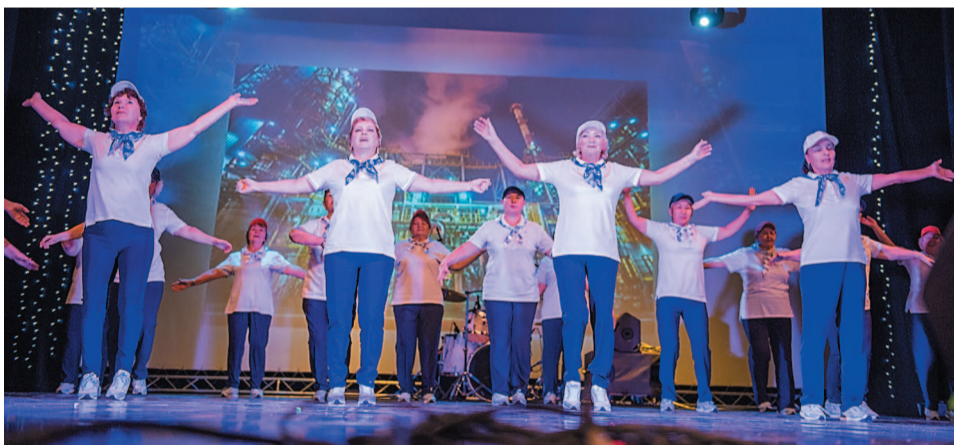
Танцевальный коллектив Совета ветеранов «Зажигалочки»