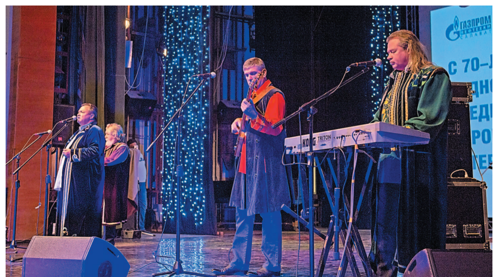
Ансамбль «Песняры» зажег на сцене Дворца