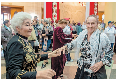
Танец дарит молодость