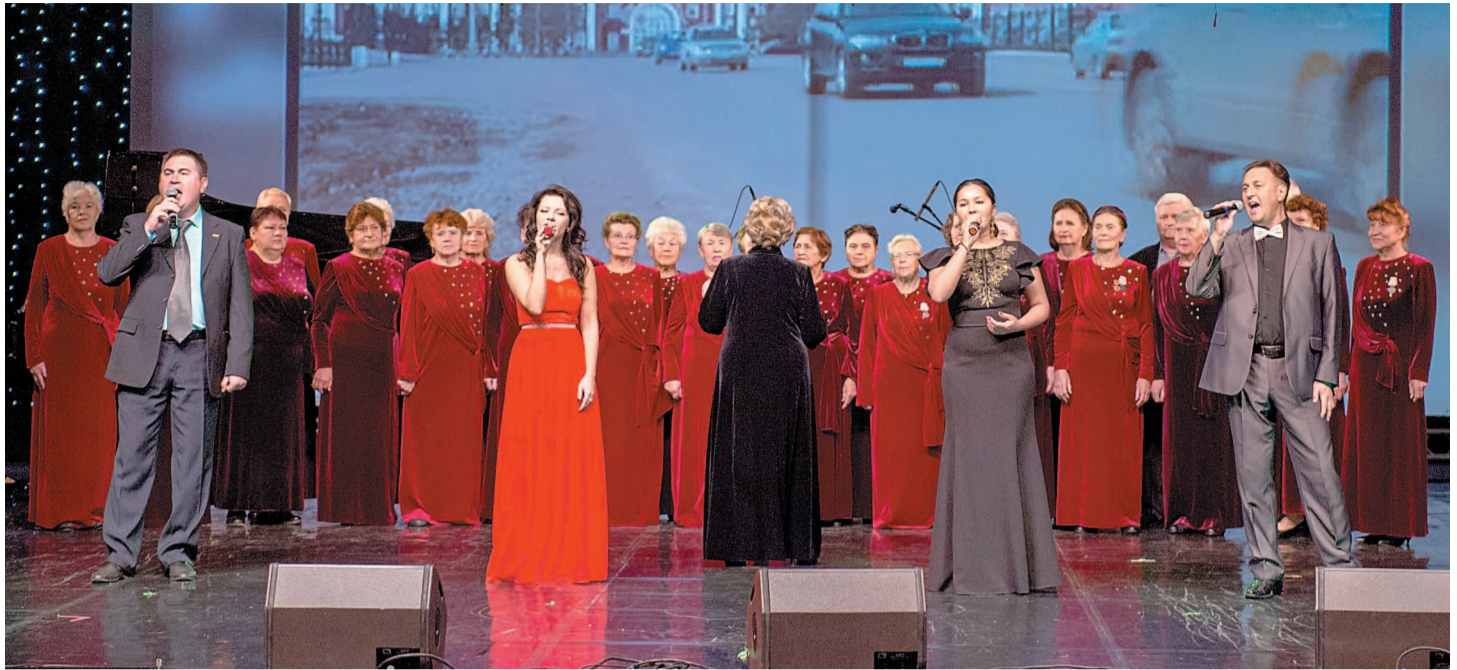
«Мари энтузиастов» в исполнении хора «Красная звезда» и молодых талантов компании

– Впечатлил фильм о сегодняшнем дне предприятия, порадовали молодые лица, новые производства. Было приятно получить памятный значок. В целом понравился весь концерт, но особое впечатление, конечно же, осталось от выступления «Песняров». Аплодировала от души!