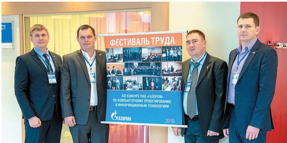
Специалисты УИТиС представили на конкурс ПАО «Газпром» три проекта

В рамках Фестиваля труда ПАО «Газпром» в Санкт-Петербурге прошел XIX ежегодный конкурс ПАО «Газпром» по компьютерному проектированию и информационным технологиям.