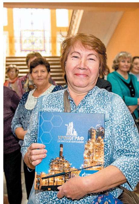
Книгу – победителю викторины

Девиз нашей группы: «Мы все сможем!», и мы уже доказали, что это так. В ближайшее время начнем готовиться к съемке видеоклипа.