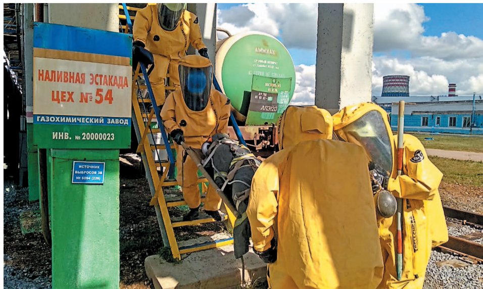
Отработка различных вариантов чрезвычайных ситуаций - залог недопущения их в будущем

Приказом по Обществу утверждена программа месячника. Будет проведен мониторинг органов управления, сил и средств гражданской обороны и территориальной подсистемы по предупреждению и ликвидации чрезвычайных ситуаций и поддер-