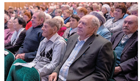
Сияют лица, блестят глаза