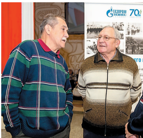
Разговор по душам