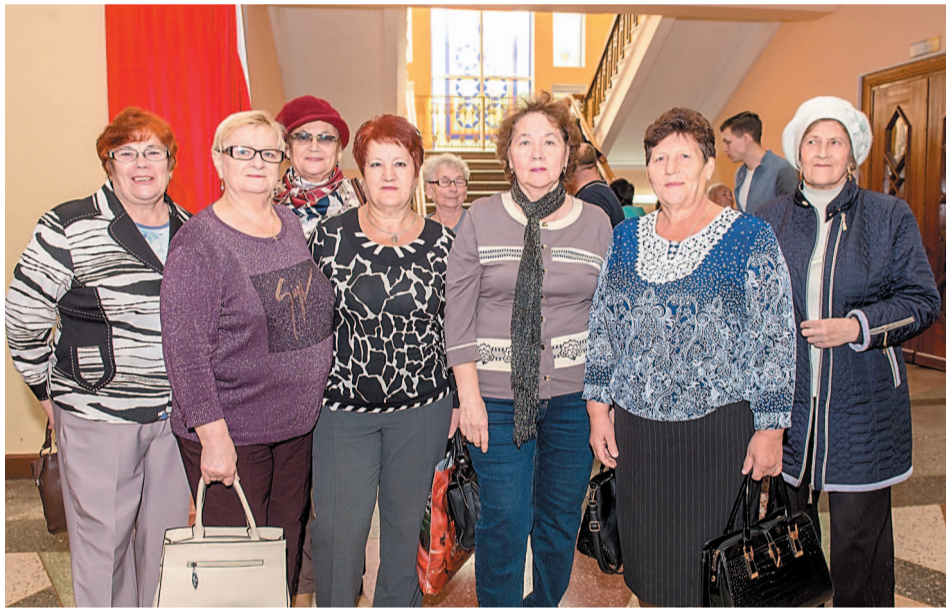
Позитив – это самое главное!