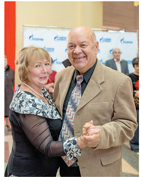
В ритме вальса