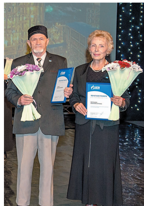
Почетные грамоты и букеты цветов получили 35 ветеранов