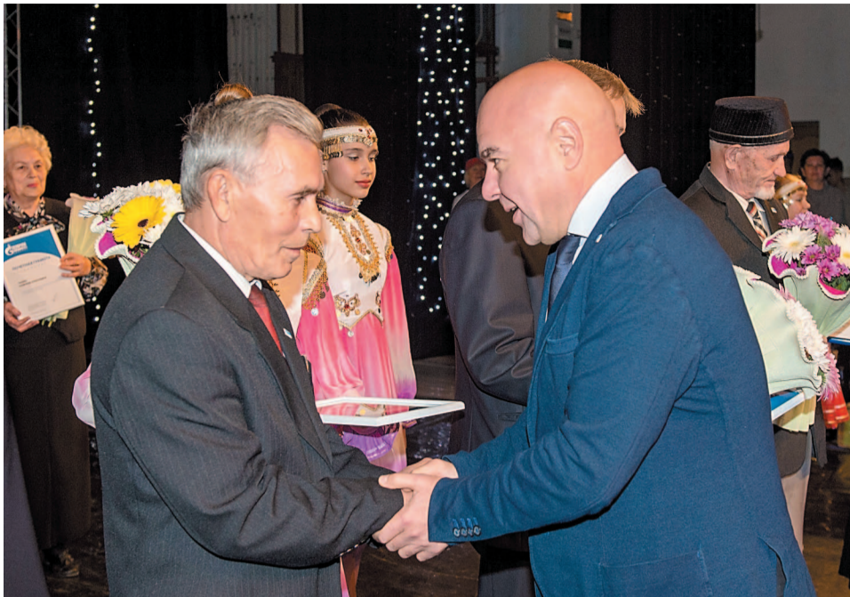
Торжественная церемония награждения заслуженных ветеранов

В компании «Газпром нефтехим Салават» отметили Международный день пожилых людей. В этом году традиционный праздник прошел в рамках празднования года 70-летнего юбилея предприятия.