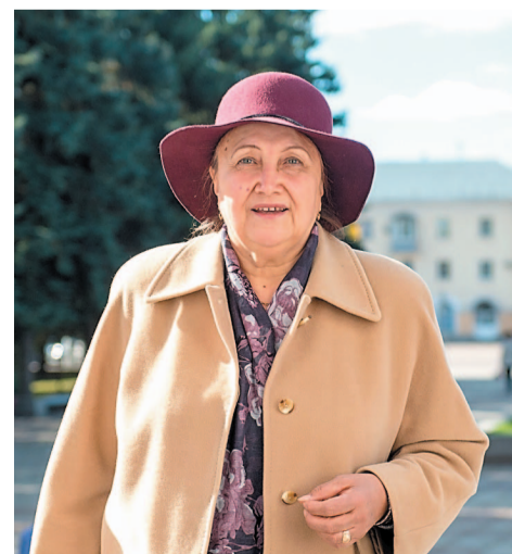
На праздник – с хорошим настроением!