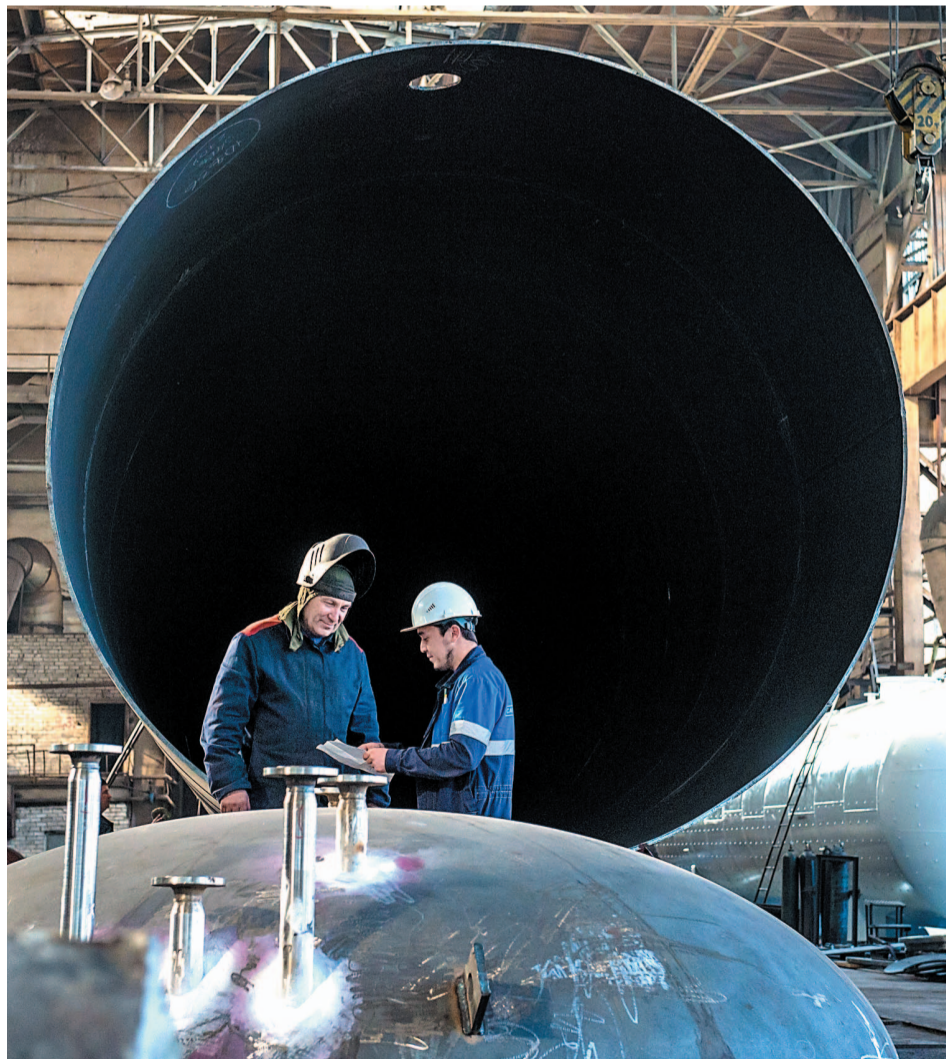
В ОАО «Салаватнефтемаш» гордятся своими мастерами-профессионалами

Успешно справившись с теоретической частью конкурса, котельщики приступили к изготовлению деталей для машиностроительных конструкций. Машинисты кранов, а это были все женщины, показали свою оперативность и точность в доставке груза в указанное место. Сварщики демонстрировали профессиональные навыки и умения в сварочной лаборатории.