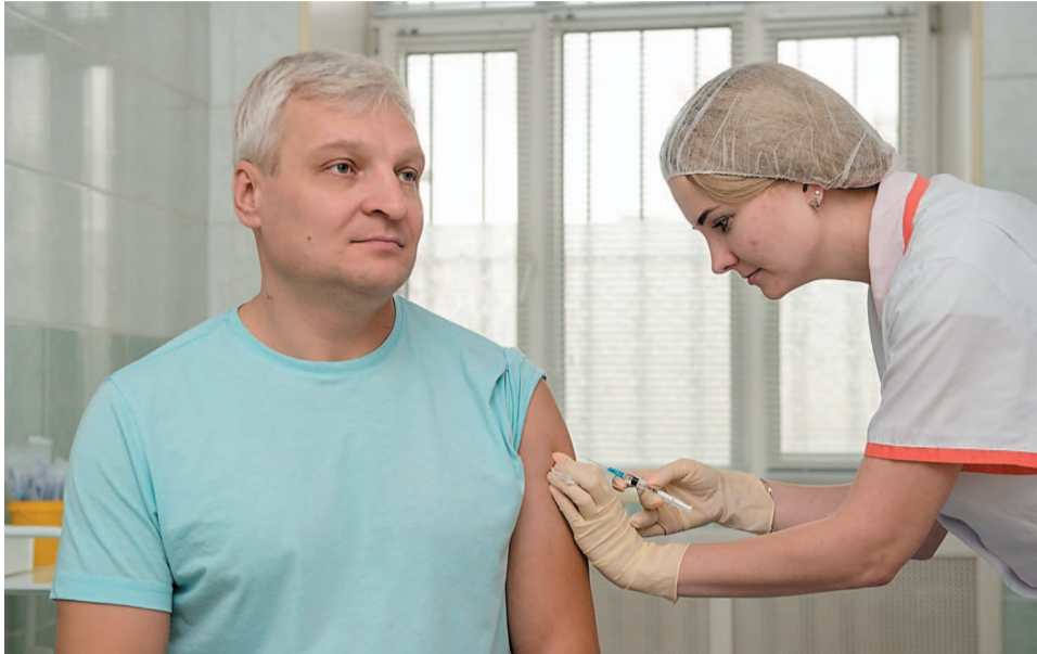
Как утверждают врачи, прививка – это реальная защита от эпидемий гриппа и ОРВИ

Каждый взрослый хоть раз в жизни сталкивается с гриппом. Для одних эта встреча заканчивается победой, для других осложнениями, а для некоторых поражением и смертью. К сожалению, стопроцентной гарантии защиты от вируса у медицины нет. Предотвратить эпидемию может только вакцинация.