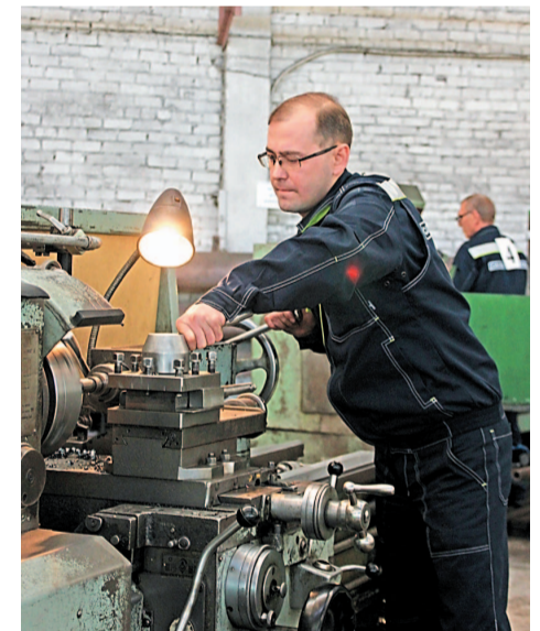
За победу в конкурсе боролись как мастера со стажем, так и молодые работники