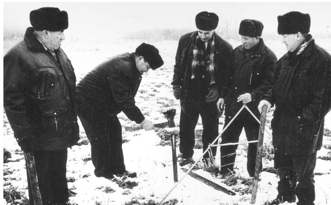
2000 год. При выборе площадки мемориального комплекса «Земля Юрматы»