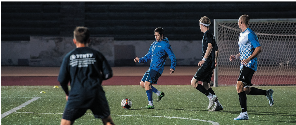
Товарищеские встречи команд предприятия и института стали доброй традицией и проводятся на постоянной основе

Футбольная сборная компании «Газпром нефтехим Салават» сыграла со студенческой командой Института нефтепереработки и нефтехимии Уфимского государственного нефтяного технического университета в Салавате.