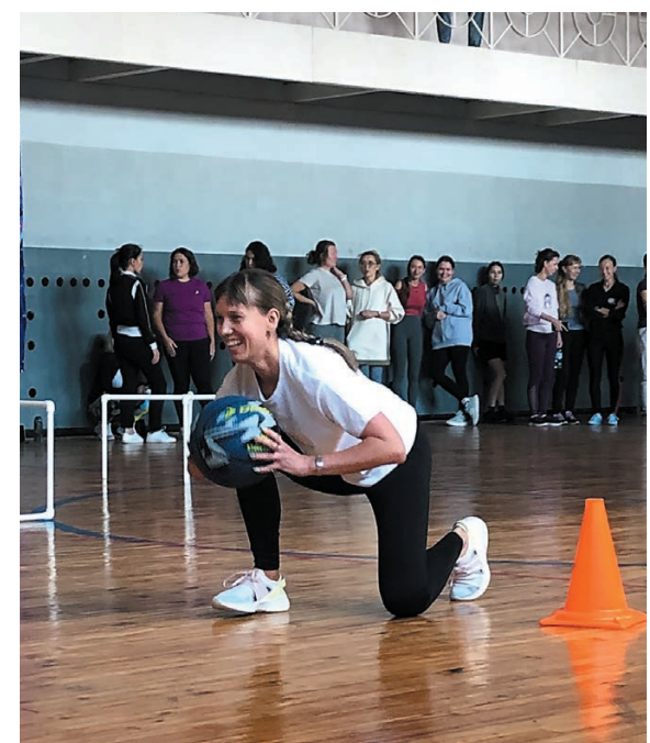
Участницы очень ловко владеют спортивным инвентарем