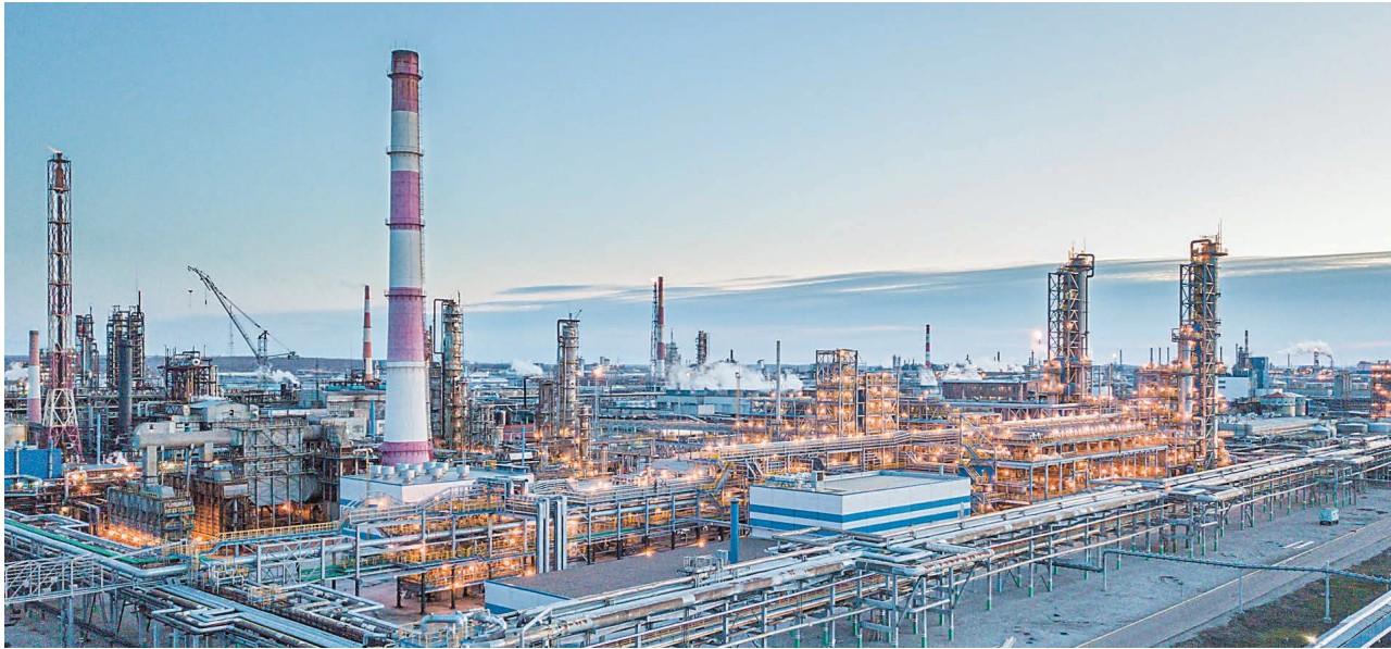
Все необходимые работы по подготовке к осенне-зимнему периоду сотрудниками ЦОКОП были завершены до сентября

В компании «Газпром нефтехим Салават» завершают подготовку производственных объектов к зиме. Большую работу провели сотрудники цеха по обслуживанию коммуникаций основных производств, в ведении которых километры трубопроводов и эстакад.