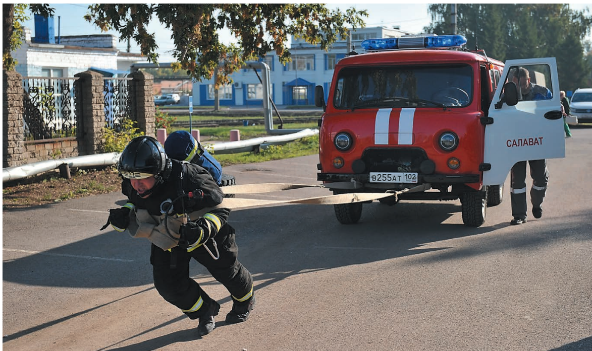
Самый зрелищный этап соревнований – перемещение автомобиля

Давленов. – Соревнования проходят в рамках ежегодной спартакиады Пожарно-спасательной части, куда также входят плавание, настольный теннис, боевое развертывание, соревнования по ликвидации последствий ДТП и т.д. – всего 12 дисциплин.