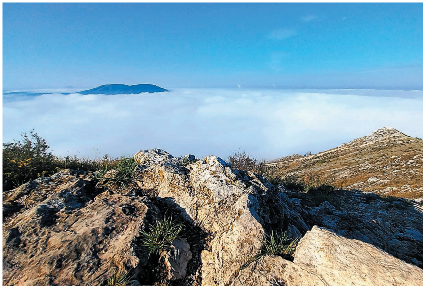
Вид на шихан Куштау с вершины Юрактау.