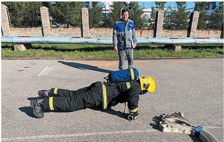
Вес снаряжения, в котором пожарные выполняют силовые упражнения, составляет более 20 кг

– Участникам соревнований необходимо преодолеть 6 этапов: переноска сэндбэга (мешка с песком), бег с пожарными рукавами, смотка рукавов «восьмеркой», подъем 24-килограммовых гирь, отжимания, кантование покрышки, перемещение на 20 метров спецавтомобиля (УАЗа-«буханки» весом не менее 1700 кг), переноска пострадавшего, подъем по лестнице в окно третьего этажа, – рассказывает судья соревнований оперативный дежурный Олег