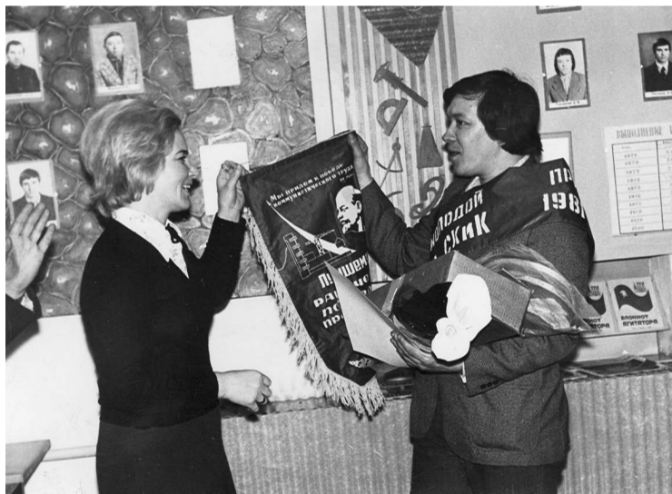
Молодежь комбината активно участвовала в соревнованиях и конкурсах профмастерства

29 октября 1918 года на первом Всероссийском съезде Союза рабочей и крестьянской молодежи было принято решение о создании Российского коммунистического союза молодежи (РКСМ), впоследствии ВЛКСМ. Согласно Уставу ВЛКСМ в комсомол принимали юношей и девушек в возрасте от 14 до 18 лет. Во время Великой Отечественной войны три с половиной тысячи членов ВЛКСМ получили звание Героя Советского Союза. Трудовой подвиг салаватского комсомола высоко оценен Отечеством. Подтверждением тому является орден Трудового Красного Знамени. Однако 27 сентября 1991 года XXII чрезвычайный съезд ВЛКСМ объявил историческую роль комсомола исчерпанной и заявил о самороспуске организации.