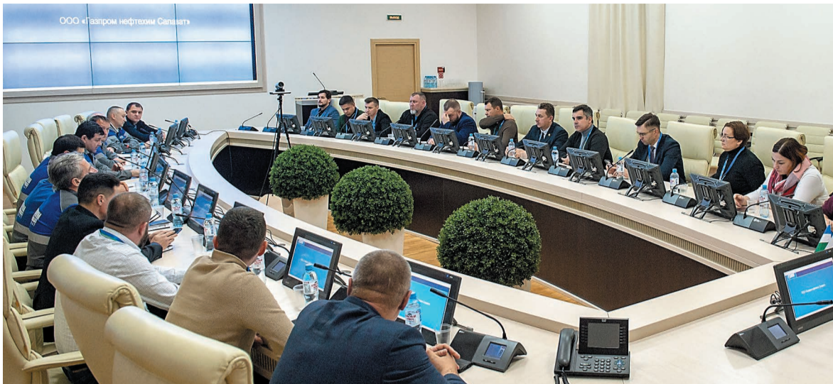
На совещании были обсуждены возможные варианты сотрудничества

ООО «Газпром нефтехим Салават» посетили выпускники Президентской программы подготовки управленческих кадров.