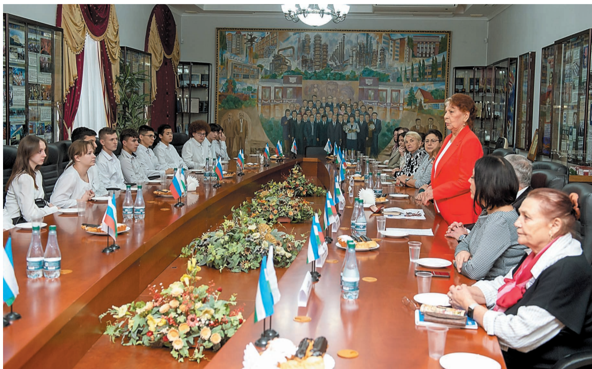
Накануне юбилейной даты в музее трудовой славы прошла встреча ветеранов компании со студентами Салаватского индустриального колледжа