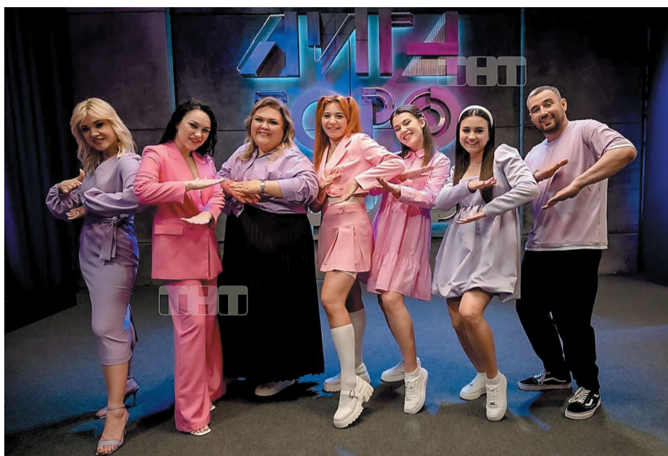
«Город красивых девушек» во время съемок проекта.

В первом отборочном туре приняли участие 62 команды из 73 городов России, Беларуси и Казахстана. Во второй тур прошла только половина команд. Далее состоится этап баттлов, в котором между собой будут соревноваться коман-