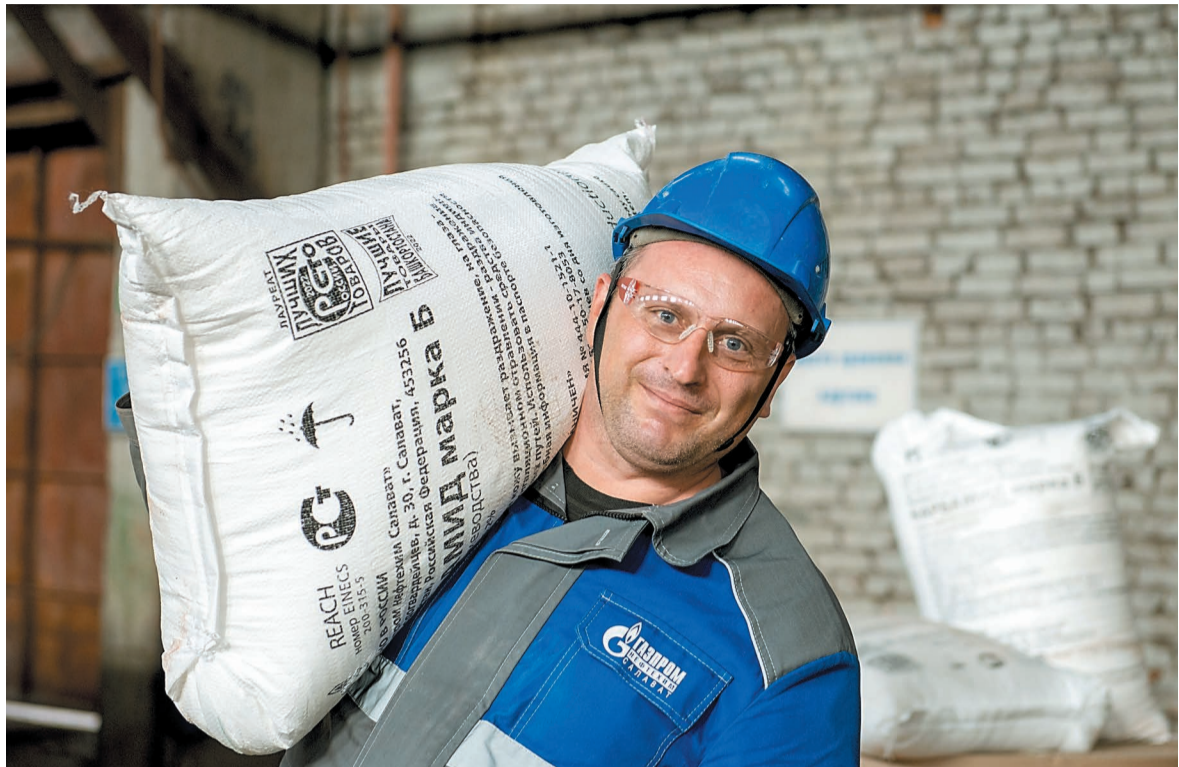
Карбамид производится на газохимическом заводе

В связи с переработкой нефти появились попутные и побочные продукты от переработки нефти – газы. Они нерационально сжигались на факелах, загрязняя атмосферу. Возникла необходимость их утилизации и применения в народном хозяйстве. В конце 50-х принимается решение о строительстве на комбинате установок конверсии и газоразделения ЭП-40 и цехов