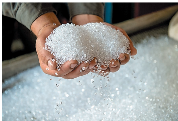
Полистирол производства ООО «Газпром нефтехим Салават»

Бутиловые спирты методом оксосинтеза на комбинате № 18 получили впервые в стране. Первый товарный продукт, отвечающий требованиям государственного стандарта, получен в апреле 1966 года. О важности этого события свидетельствует тот факт, что о нем говорило Центральное информационное агентство страны – ТАСС. В частности, оно сообщило, что «...Нефтехимический комбинат непрерывно растет, расширяется ассортимент выпускаемой продукции. Недавно здесь вошел в строй комплекс производства бутиловых спиртов, являющихся ценнейшим продуктом для целлюлозно-бумажной промышленности. Бутиловые спирты получены здесь не из зерна, а из