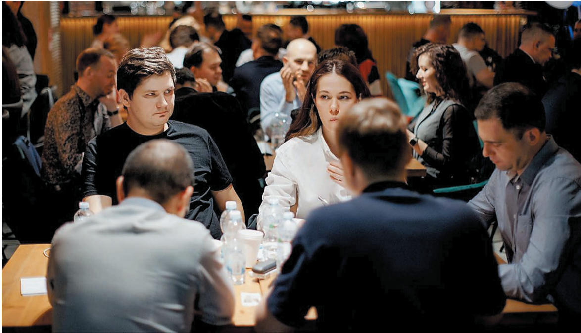
Команда Honey Barrel во время игры.

2 декабря в Санкт-Петербурге собрались 32 команды-участницы со всей страны, представляющие подразделения ООО «Газпром переработка», компаний Группы «Газпром» и партнеров. Путевку в финал чемпионата получила и команда ООО «Газпром нефтехим Салават» под названием Honey Barrel – ранее она стала лидером по итогам отборочных туров в Оренбурге. Салаватские нефтехимики уже имеют опыт игры в финале – в 2019, 2020 и 2022 годах, – но тогда им не удавалось занять призовые места.