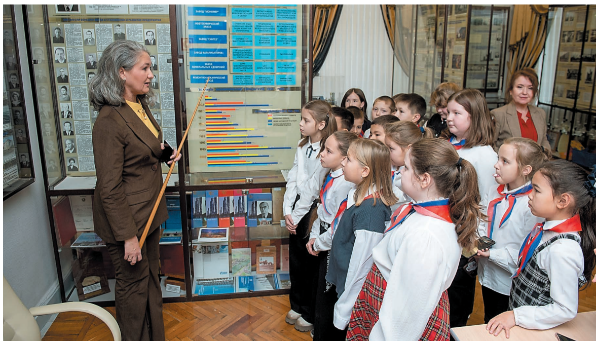
Дети и взрослые остались под впечатлением от увиденного

Третьеклассники из села Наумовка Стерлитамакского района побывали на экскурсии в компании «Газпром нефтехим Салават».