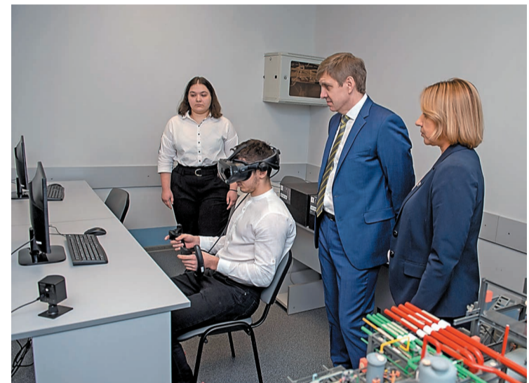
В лаборатории информационных технологий