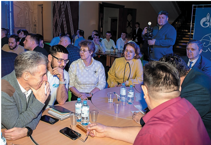
Команда руководителей с интересом обсуждала вопросы квиза