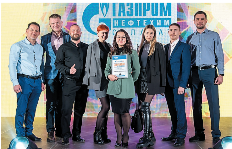
Сборная подразделений, подчиняющихся главному инженеру