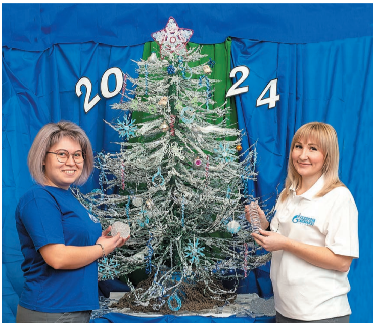
Победители в номинации «Лучшая новогодняя елка» – креативный проект лаборатории полимеров ОТК ЛАУ цеха № 47 «Новогодние елки-палки»

Преображая к Новому году производственные цеха, офисы, лаборатории и операторные, нефтехимики удивляют своей фантазией и креативным подходом.