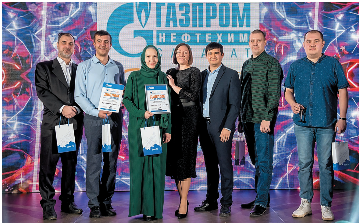
Команда нефтеперерабатывающего завода