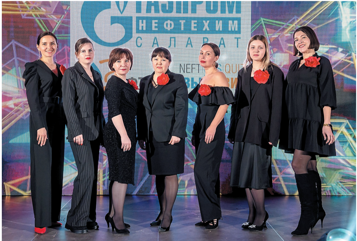
«Люди в черном» – команда Лабораторно-аналитического управления