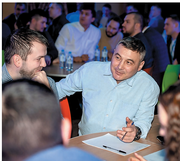
Игра подарила азарт и приятные эмоции