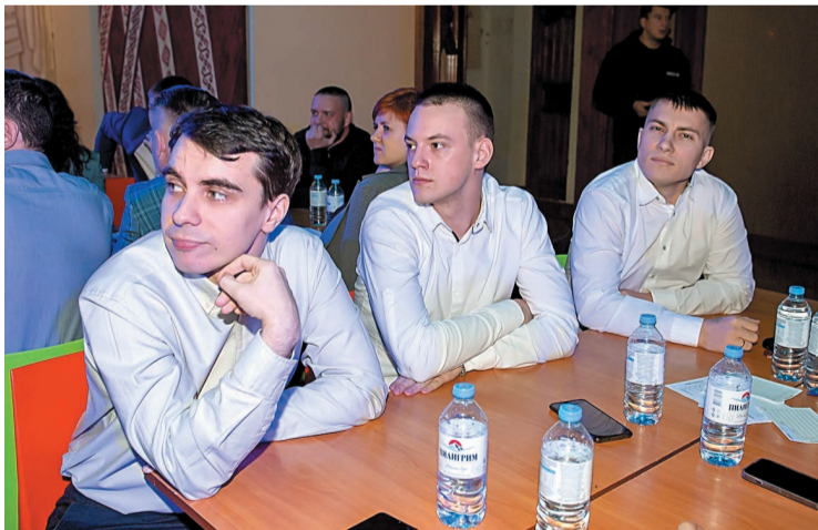
Участники квиза, представляющие газохимический завод