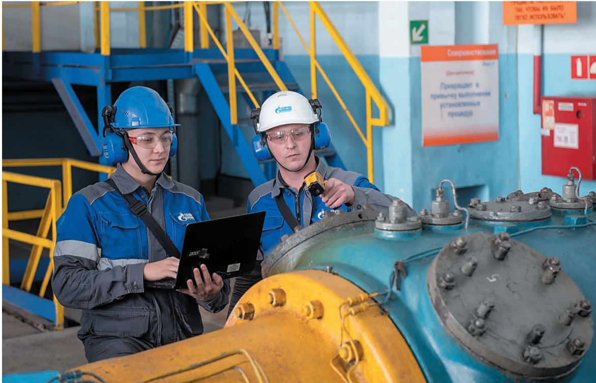
Производится замер температуры нового клапана на установке компрессии цеха № 24

Сотрудники Управления главного механика проработали возможности импортозамещения, в результате в ряде цехов запасные части насосно-компрессорного оборудования были заменены на российские аналоги.