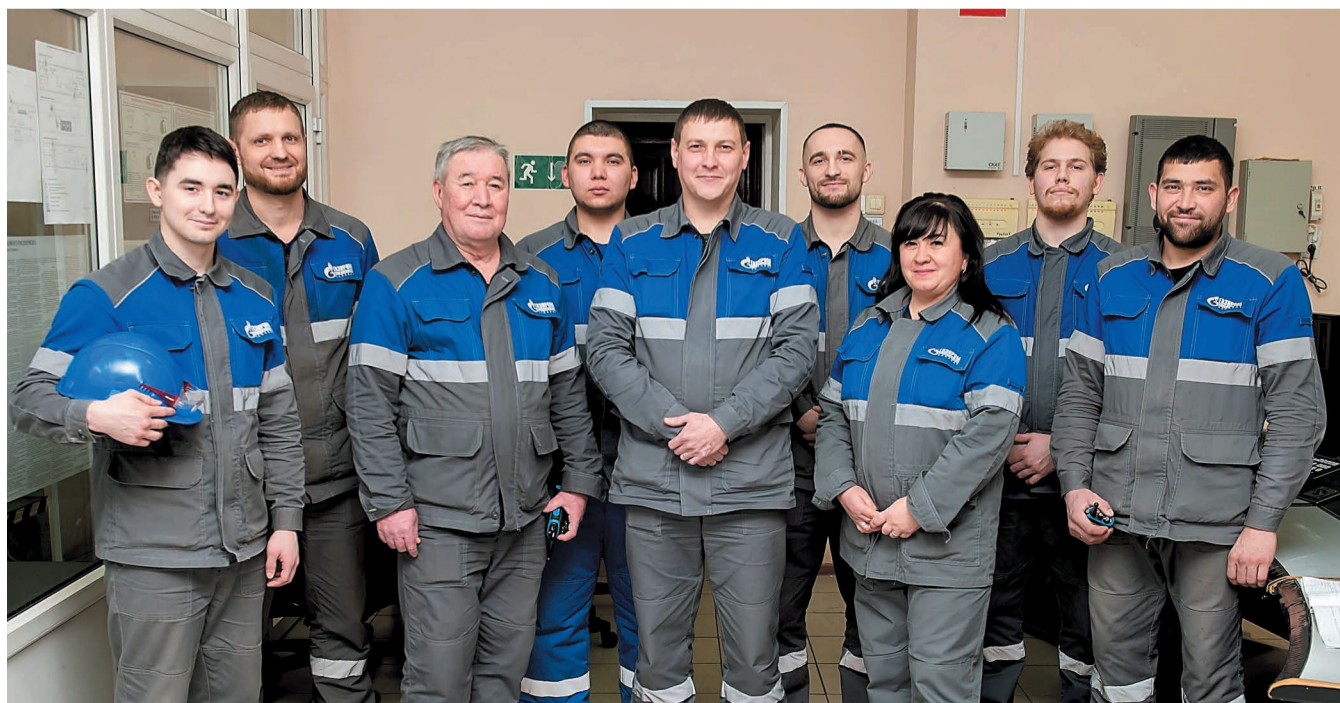
Бригада № 2 – настоящая команда, находят общий язык с полуслова