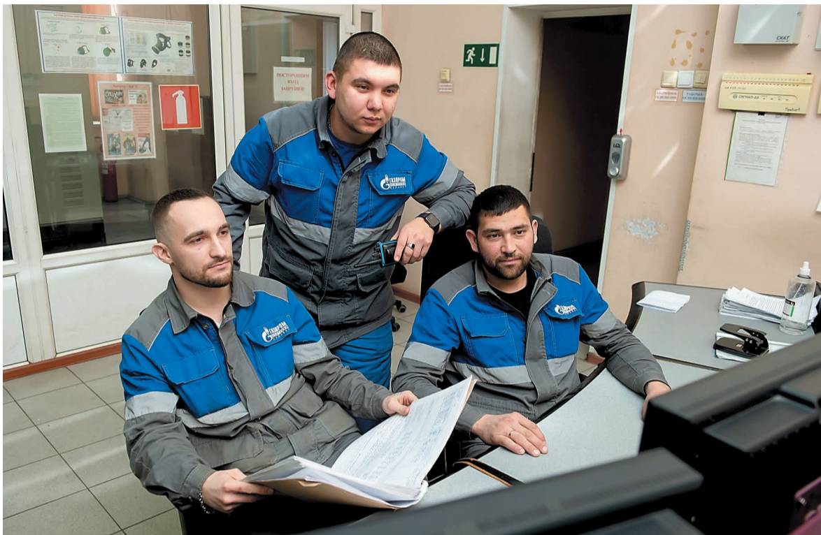
В операторной установки фталевого ангидрида

Пластификаторы – широковостребованный товарный продукт, качеством которого по праву славится наше предприятие. Их добавляют в полимеры для придания эластичности и прочности. Пластификаторы получают в цехе № 48, главным сырьем для их изготовления является фталевый ангидрид. Бригаду № 2 установки производства фталевого ангидрида считают в цехе одной из самых дружных, профессиональных и инициативных.